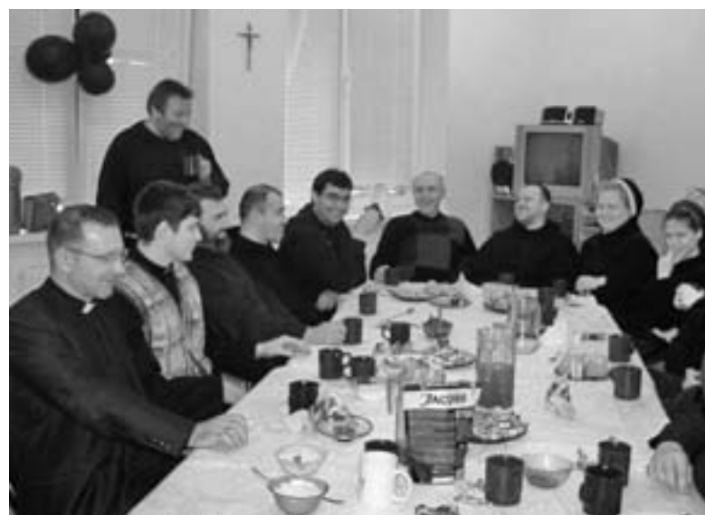
ВЕЧЕРНЯЯ МОЛИТВА ВО ВРЕМЯ ЭКУМЕНИЧЕСКОЙ КОНФЕРЕНЦИИ

Празднование проходило в полуразрушенном храме, под открытым небом. На улице стояла минусовая температура, но всех согревала любовь Христа, тепло братского общения и надежда на благословенное будущее общин Иисуса в Восточной Украине. ■