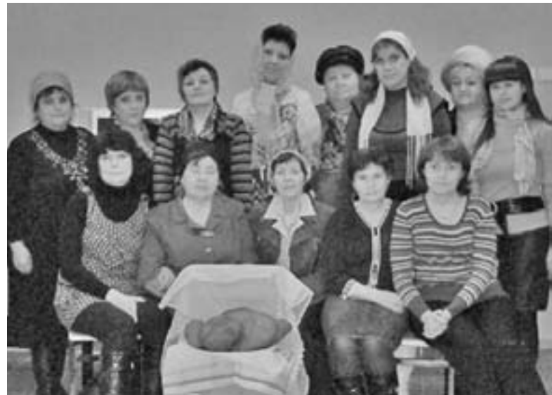
УЧАСТНИЦЫ БОГОСЛУЖЕНИЯ В КРАСНОТУРЬИНСКЕ

Слава Богу за единение нас в Нем, таких дальних по расстоянию, но объединенных Его Святым Духом. ■