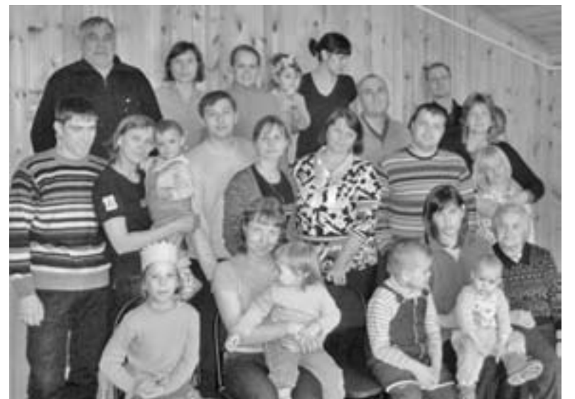
УЧАСТНИКАМИ СЕМИНАРА СТАЛИ СЕМЬ МОЛОДЫХ СЕМЕЙНЫХ ПАР И ИХ ДЕТИ