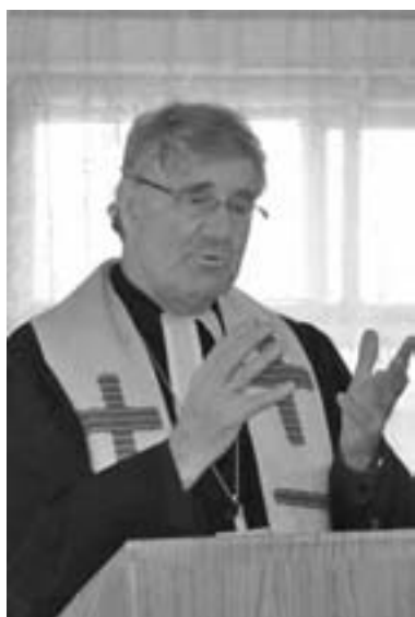
ЕПИСКОП ОТТО ШАУДЕ ПРОПОВЕДУЕТ В БОГРАДЕ