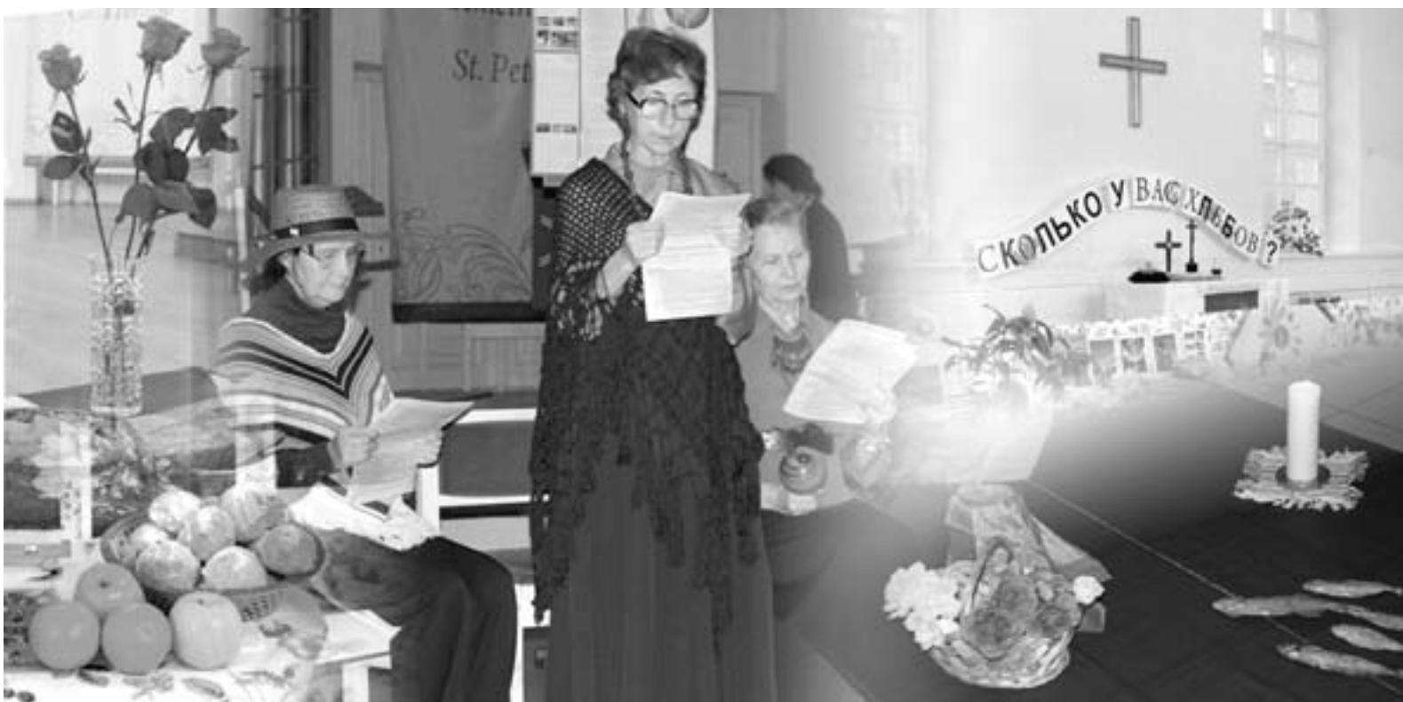
КОллаж на тему всемирного дня молитвы (по мотивам фотографий из общин)