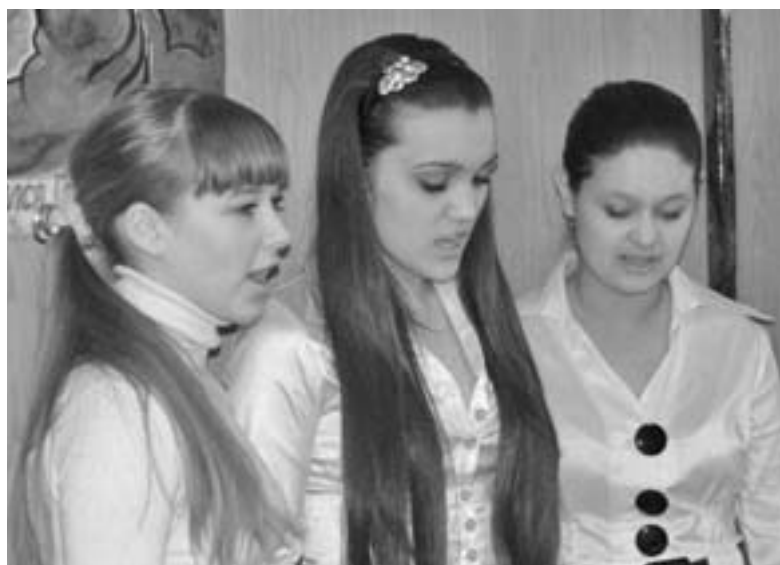
ХОР НА БОГОСЛУЖЕНИИ В ЧЕРНОГОРСКЕ

АБАКАН/ЧЕРНОГОРСК/БОГРАД/ШИРА/БОРОДИНО. Епископ Евангелическо-Лютеранской Церкви Урала, Сибири и Дальнего Востока (ЕЛЦ УСДВ) Отто Шауде посетил с 1 по 7 марта Хакасию и юг Красноярского края.