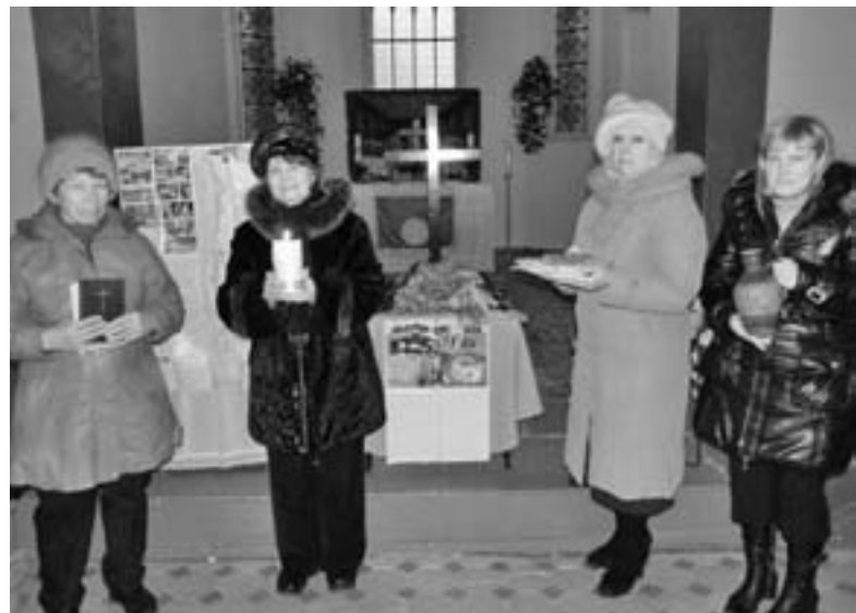
УЧАСТНИЦЫ ВСЕМИРНОГО ДНЯ МОЛИТВЫ В Г. ГРОДНО

Кульминацией молитвы стало преломление хлеба друг с другом как символа единства всех христиан во всем мире и как символа хлеба жизни, который необходимо нести дальше, проповедуя ближним. ■