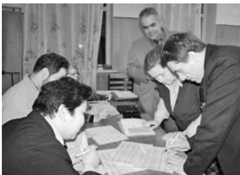
СИНОДАЛЫ ВО ВРЕМЯ ТАЙНОГО ГОСЛОСОВАНИЯ