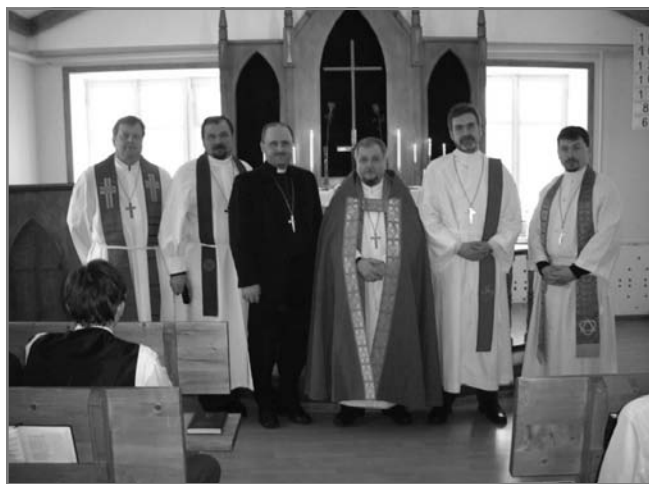
Пасторы у алтаря церкви во Ржеве

Внемлем же учению святых апостолов и отцов Церкви. Последуем заповеди Господней и примеру многих поколений христиан. Проведем благодатное время Великого Поста, воз-