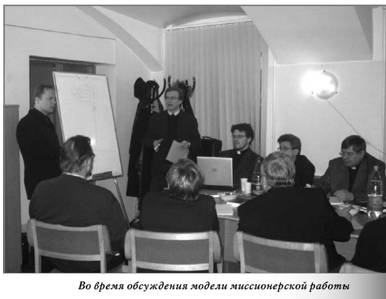
Во время обсуждения модели миссионерской работы