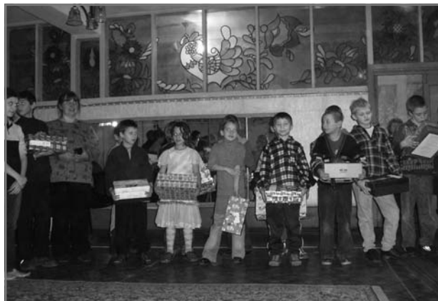
Дети получили подарки от сверстников из Польши

школы-интерната и их воспитанники неоднократно выражали благодарность членам общины, в том числе в местных СМИ. Поэтому о существовании общины в городе и районе знают и обращаются со своими нуждами.