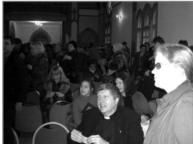
Церковь св. Павла. Перед концертом

наблюдать на концертах немецкого органиста Фолькмара Ценера в сентябре 2006 года. На наш взгляд, это является признаком того, что город