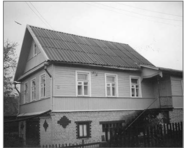
Дом общины в г. Витебске

18 февраля в витебской общине состоялось богослужение с Причастием, на котором присутствовали гости: Йенс Латтке из Магдебурга, представитель партнерской Церкви церковной провинции Саксонии, гости из гродненской