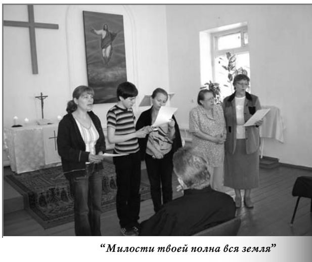
“Милости твоей полна вся земля”