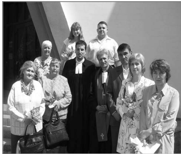
После богослужения с Крещением и конфирмацией

“Мы сегодня будем проводить Крещение взрослых, принимать конфирмантов в наш круг. Позади у них долгий путь занятий, несколько недель. Вме-