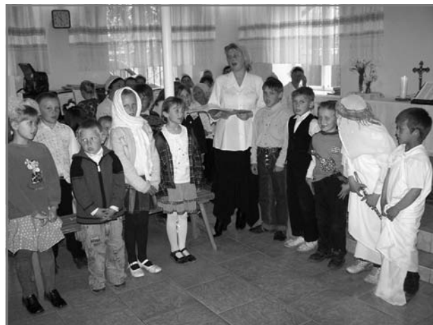
Выступление детей на Синоде

нивы: провел семинар для покаянных, молодежную встречу в Бишкеке с молодежной группой из села Ананьево, активно занимается сплочением молодежных групп близлежащих общин.