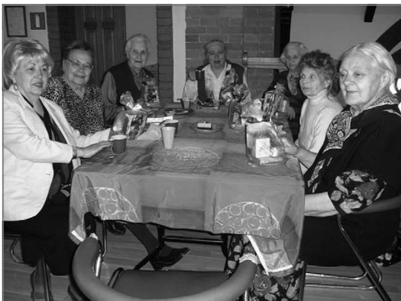
"Кружок сеньор" во Владивостоке