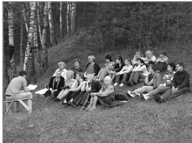
Богослужение на природе

Уже второй год община св. Марии в Ульяновске празднует Вознесение Христова под открытым небом. В этом году богослужение состоялось в живописном месте рядом с деревней Ломы в 30 км от города, в окружении оврагов и величественных сосен.