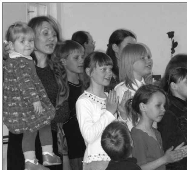
На празднике выступают дети