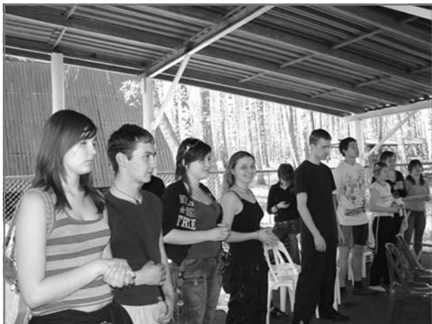
Христианская молодежь Ульяновска

ка. День начался с прославления Бога и проповеди о жертве хвалы за все то, чем Господь нас обильно благословляет. На протяжении всего дня устраивались соревнования по волейболу, футболу и другим играм. Участники мероприятия совершили прогулку на пруд, где некоторым посчастливилось прокатиться на плоту.