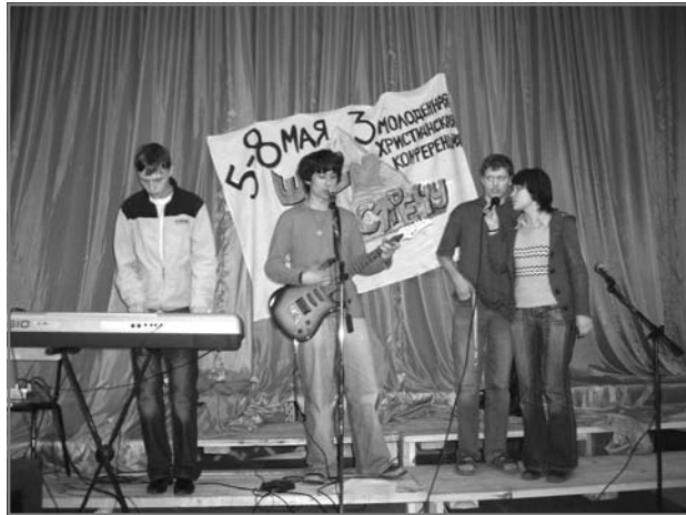
Наша музыкальная группа

Наша конференция была евангелизационной. Текст из Деяний 2:38 повествует нам о проповеди апостола Петра: "Петр же сказал им: покайтесь, и