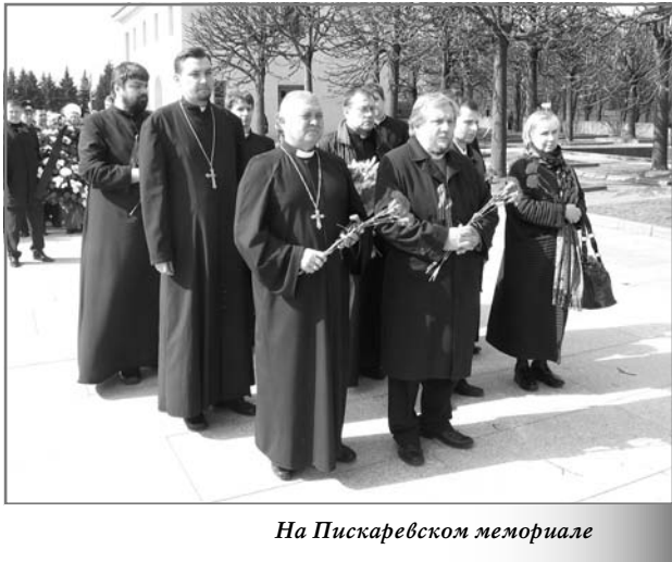
На Пискаревском мемориале