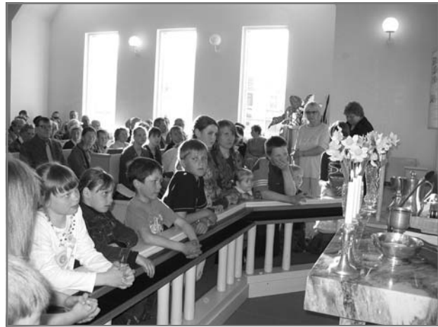
У алтаря перед благословением детей

В приходе накоплен большой опыт работы с теми, кто желает избавиться от алкогольной зависимости. Проводятся дни матери и ребенка, во время которых у мам есть возможность спокойно размышлять над Словом Божиим, а у детей – поиграть или посмотреть христианские мультфильмы.