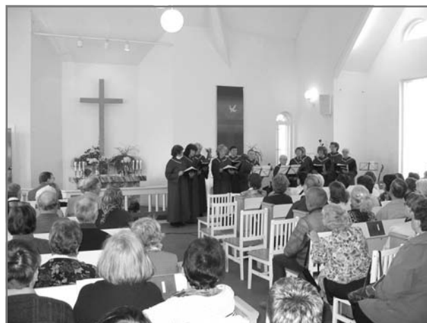
Хор во время праздничного богослужения