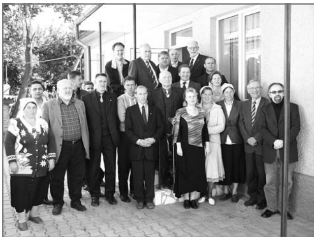
Делегаты и гости Синода

с этим диаконические центры обучают своих сотрудников основам религии и христианского вероисповедания. Новые работники проходят курс изучения катехизиса.