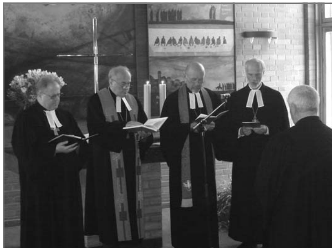
Посвящение епископа Августа Крузе

Церемонию посвящения в епископы проводил Архиепископ ЕЛЦ Эдмунд Ратц, он благословил нового епископа через