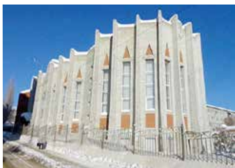
Собор св. Марии в Саратове

САРАТОВ. 14 февраля Президиум Синода и Консистория Евангелическо-Лютеранской Церкви Европейской части России (ЕЛЦ ЕР) приняли ряд кадровых решений, необходимость в которых возникла в связи с безвременным уходом епископа ЕЛЦ ЕР Андрея Джамгарова: