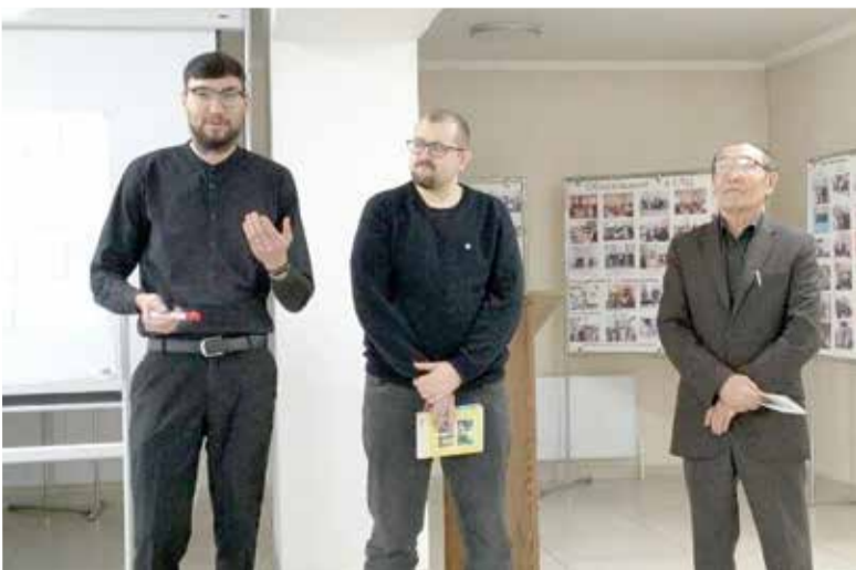
На семинар собрались служители и их помощники из большинства приходов ЕЛЦ РК...