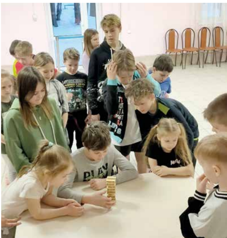
Участниками лагеря стали дети в возрасте от 4 до 14 лет из общины Краснотурьинска...

Днем ребята гуляли на свежем воздухе, катались с горки, играли в футбол, а вечером с родителями ели сосиски, приготовленные на костре. ■