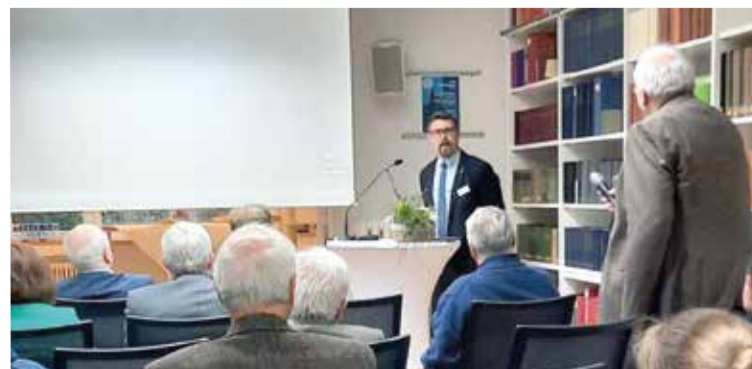
На конференции в Бенсхайме, посвященной 50-летию Лейенбергского конкордата

По материалам сайтов www.ekd.de ; www.leuenberg.eu ; www.leuenberg50.org