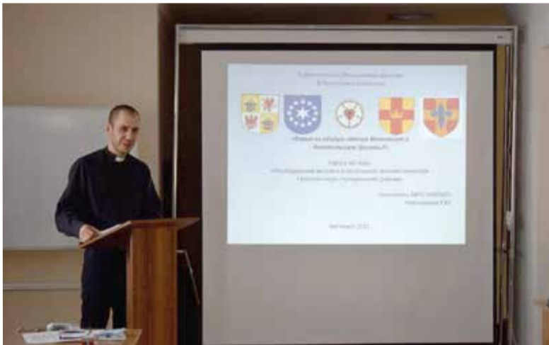
В основу книги лег доклад автора, прочитанный на заседании Синода ЕЛЦ РК в 2021 году