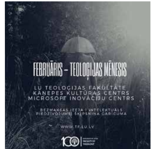
Афиша конференции в Риге

От Аристотеля, Аквината и Абеляра, Шлейермахера, Трельча и Тиллиха, безрелигиозности Бонхёффера, от истории преподавания в университете Дерпта в дискурсе Евангелическо-Лютеранской Церкви России как примера до нас, сегодняшних теологов, мы проследили, чем же так вызван научный интерес к теологии. Универсальные oratio, meditatio, tentatio faciunt theologum Лютера и псалмопевца Давида для поколений «Z» и «0» в эпоху секуляризации и постмодерна.