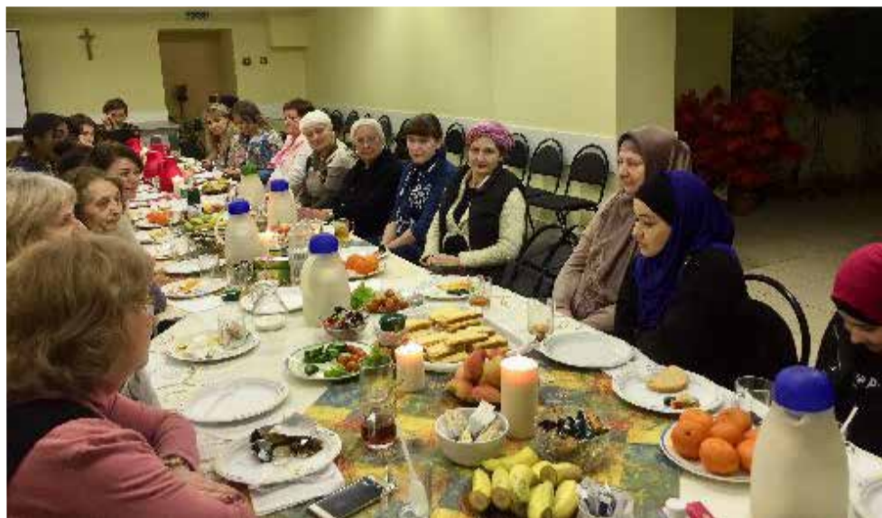
Участницы женской встречи в соборе свв. Петра и Павла