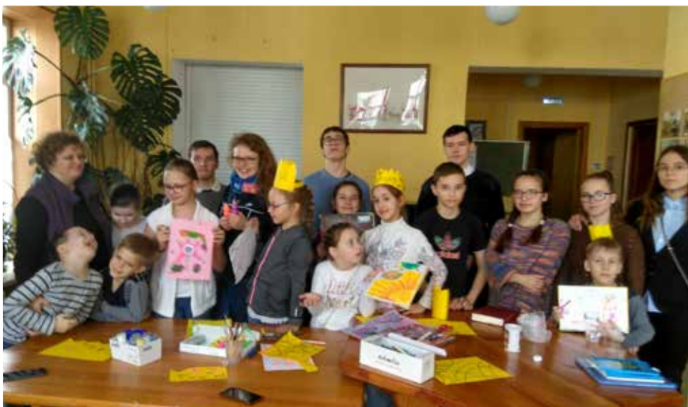
«Новость» о том, что все мы – «дети Бога-царя нашей жизни», послужила поводом для изготовления из бумаги короны для каждого ребенка...

Забота о ближнем и любовь – к себе, к родным и близким – помогают человеку правильно увидеть проблему и справиться с ней. К такому выводу пришли ребята. Христианские заповеди помогают всем, кто следует за Иисусом Христом! ■