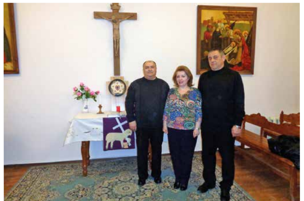
Совет пропства Крыма в церковном зале общины в Симферополе

По материалам группы «Церковный округ (Пропство) Евангелическо-Лютеранских общин РК и г. Сев.» на Facebook