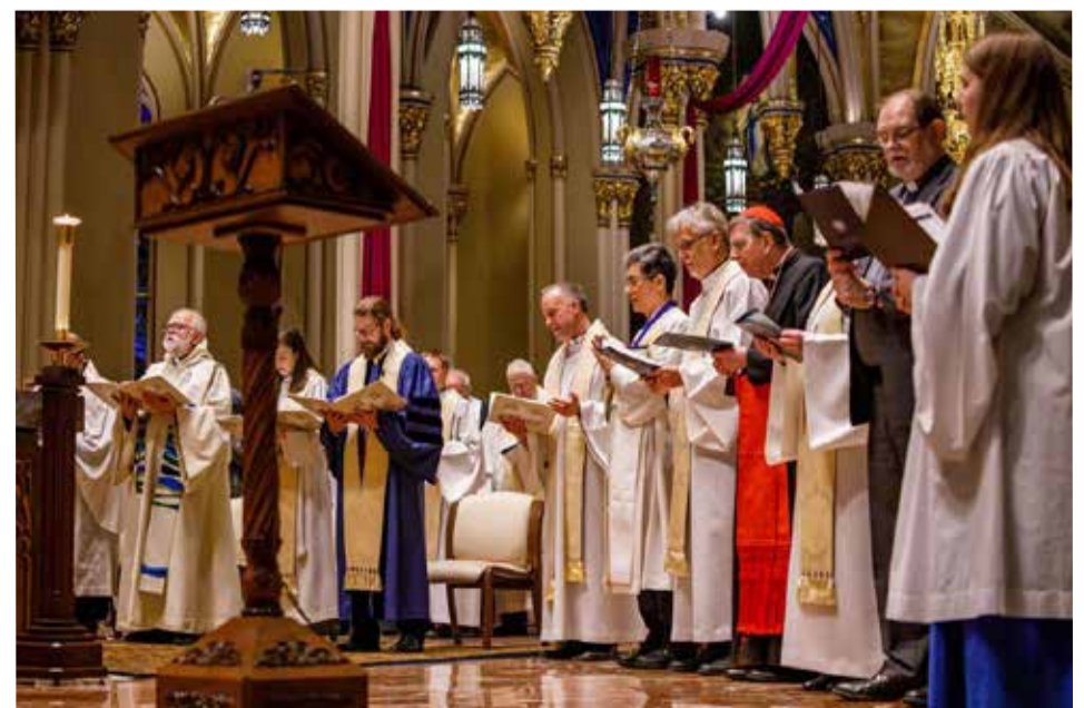
Экуменическое богослужение открыло встречу в университете Нотр-Дам