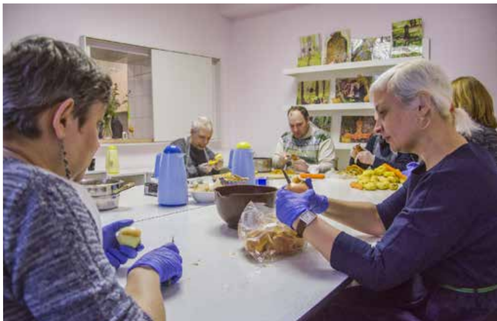
Приготовление обеда вместе с гостями из Дома Малецкого

Большим вдохновением стала для нас эта встреча и это общение. У каждого подопечного Дома Малецкого – своя непростая история, но каждый из них испытывает потребность заботиться о ближнем, и чудесным образом на это находят силы. ■