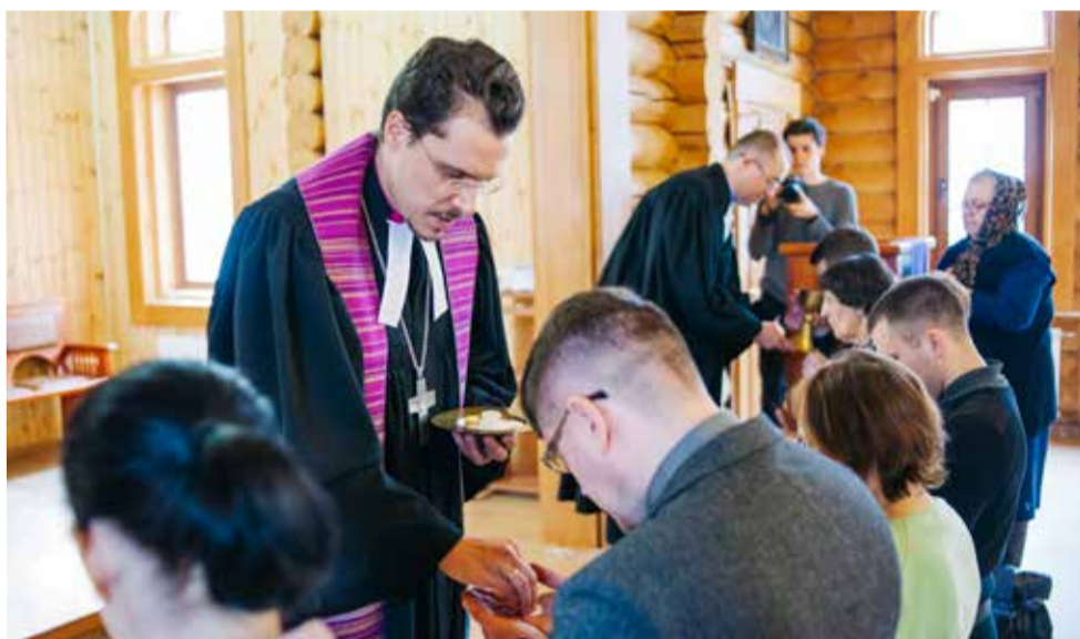
Архиепископ Дитрих Брауэр преподает Причастие на богослужении в церкви св. Марии