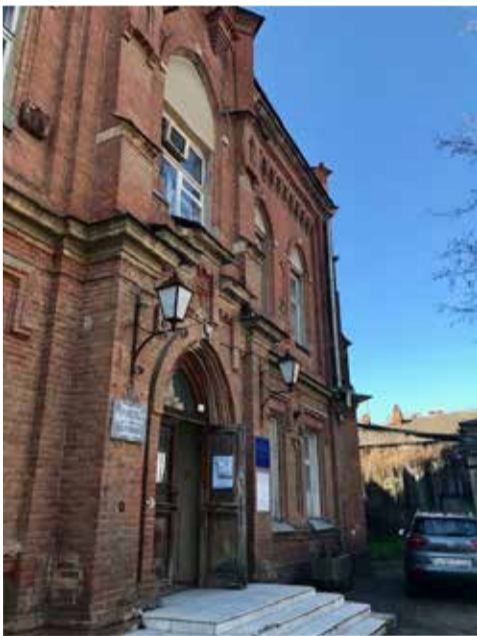
Сегодня в историческом здании лютеранской церкви в Краснодаре размещается Союз художников...