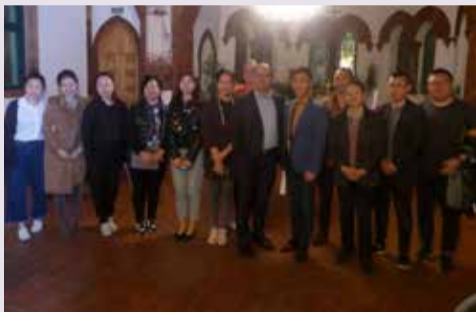
Представители организации протестантских церквей «Трех "само"» в церкви св. Павла

Владивосток. Китай – наш близкий сосед. Граница с Китаем находится на расстоянии около 100 км от Владивостока.