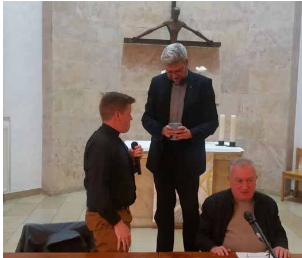
«Дни Лютера – 2018» в церкви Примирения

Посетителей было больше, чем в предыдущие годы, в том числе, и тех, которые пришли не из ЕЛЦГ. Важным и полезным для нашей Церкви в Грузии было то, что впервые в качестве лектора в «Днях Лютера» участвовал представитель православной Церкви. Пожалуй, можно сказать, что «Дни Лютера» получили признание как важное мероприятие ЕЛЦГ. ■