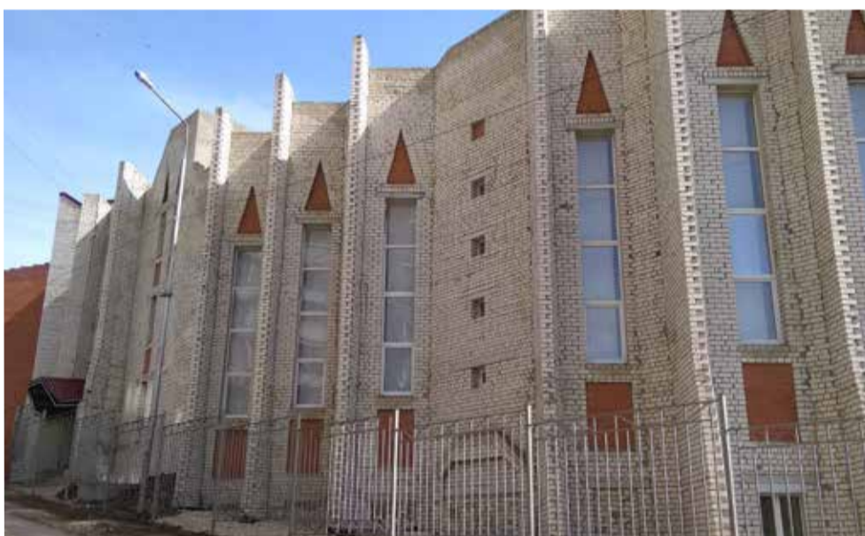
Здание церкви св. Марии строится уже более десяти лет