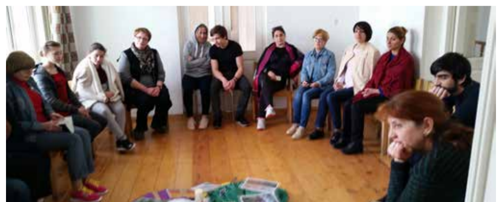
Рядом сидели и с интересом слушали лекции сотрудники Церкви, пасторы и молодежь...