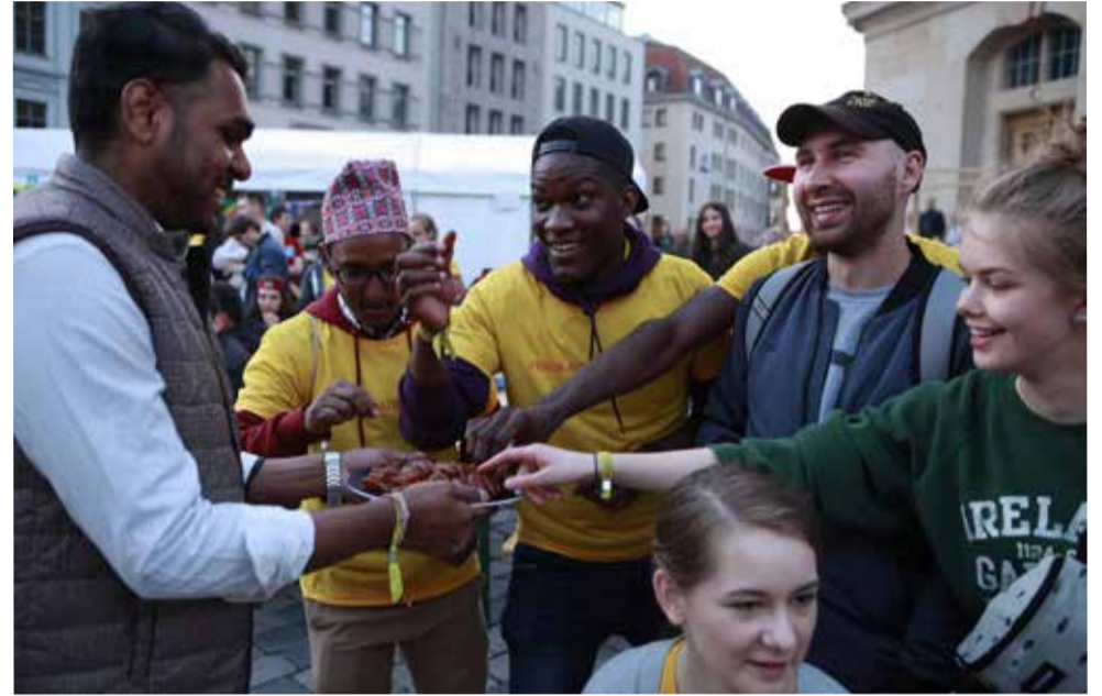
Молодежь из Самары и представители других стран на площади у церкви Богородицы (Фрауэнкирхе) в Дрездене

лись не только представители арабских стран, Африки, Южной Америки, но и взялась за руки молодежь России и Украины. В этом и заключается ценность нашего прекрасного мира. ■