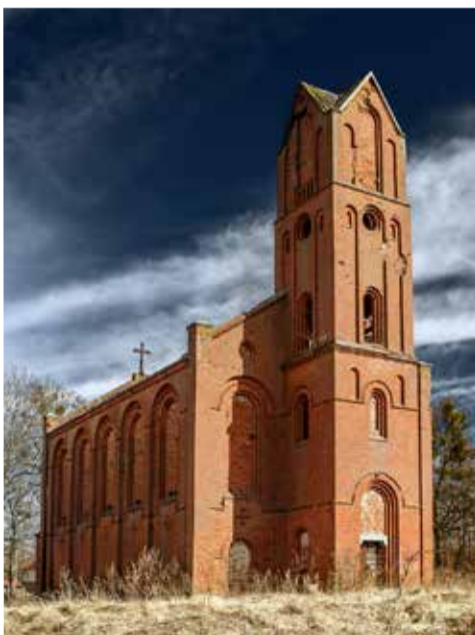
Заброшенное историческое здание лютеранской церкви в пос. Большая Поляна

Желающие отдохнуть в Балтийском регионе имеют прекрасную возможность остановиться в доме ев.-лют. общины в пос. Большая Поляна Калининградской обл. В гостевых комнатах дома предоставляется размещение для 5-6 человек. В доме есть кухня, ванная, туалет. Вокруг – сад с фруктовыми деревьями большой площади.