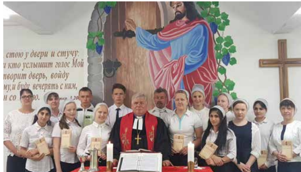
Епископ Альфред Айхголец с конфирмантами в общине с. Виноградное

Сегодня положение несколько изменилось. Многие прихожане покинули и продолжают покидать Киргизию. Но Церковь живет. Регулярно проходят церковные собрания: богослужения, библейские разборы, конфирмационные занятия, детские и молодежные собрания, репетиции хора. И эта очередная конфирмация является знаком надежды. ■