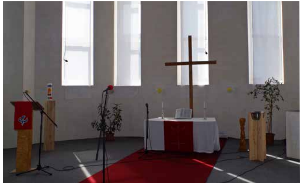
Алтарное пространство в церкви св. Марии

посол ФРГ Рюдигер фон Фрич. Освящение церкви в Саратове стало главной и наиболее продолжительной по времени присутствия причиной его визита в Саратовскую область. Примечательно, что посол впервые посетил регион ради этого события.