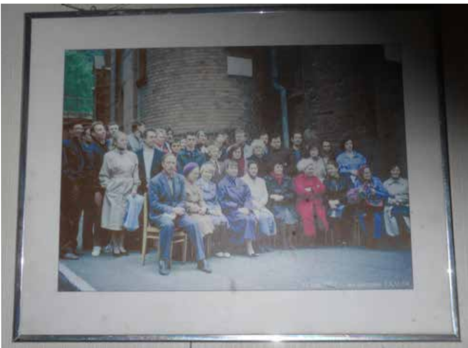
Фото, сделанное после первого богослужения в 1992 году, занимает почетное место в церкви св. Павла

На надгробии пастора Карла-Августа Румпетера, когда-то служившего во Владивостоке, стоят слова из псалма 100, 6: «Глаза мои на верных земли, чтобы они пребывали при мне». Это – лозунг общины св. Павла. С ним перекликаются слова Христа, сказанные Петру: «На сем камне Я создам Церковь Мою, и врата ада не одолеют ее» (Мф. 16, 18). ■