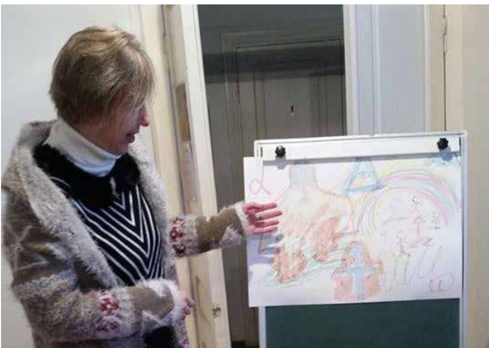
В центре большинства рисунков были крест, сердце, наполненное верой и любовью, Библия и взявшиеся за руки дети и взрослые...

В дискуссиях участвовали все, в том числе и молодежь, которая по активности не уступала старшему поколению Церкви и очень старалась повысить свой уровень знаний. А это значит, что молодежь любит свою Церковь и хочет активно участвовать в ее жизни и взять на себя ответственные служения. У нашей Церкви есть будущее. ■