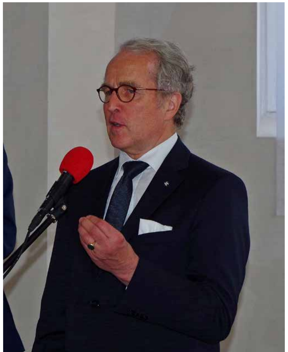
Посол Рюдигер фон Фрич прочитал проповедь в церкви св. Марии

«Exaudi». «Услышь». Господь слышит молитвы. В начале многим казалось, что построить церковь малочисленной общине не по силам – ни финансово, ни физически. И это освящение – хорошее доказательство тому, что с верой возможно многое. ■