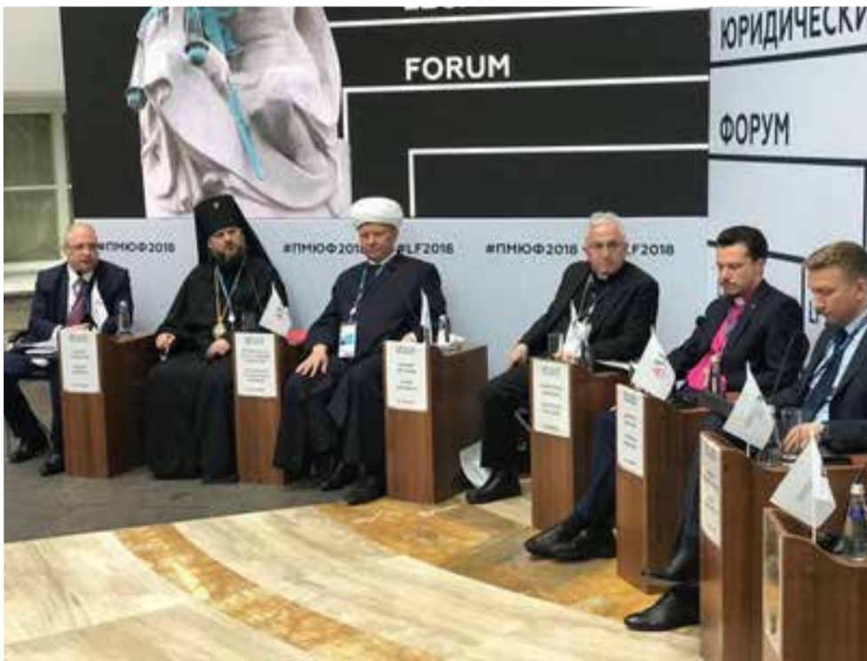
Представители традиционных российских конфессий и религий на юридическом форуме

17 мая Архиепископ провел рабочие встречи в Канцелярии Архиепископа. Обсуждался широкий круг вопросов: подготовка проповедников для Северо-Западного пропства, ход реставрационных работ по фасаду Петрикирхе и концертная деятельность в храме, создание литургического сборника и работа Теологической семинарии. ■