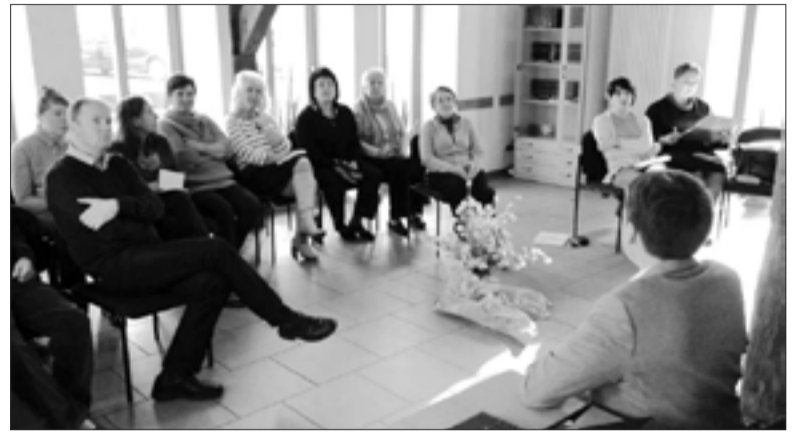
ВО ВРЕМЯ ЗАНЯТИЙ НА СЕМИНАРЕ