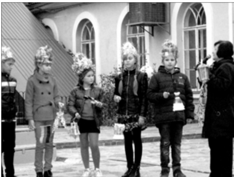
ДЕНЬ СВ. МАРТИНА В ЕВПАТОРИИ (КРЫМ)