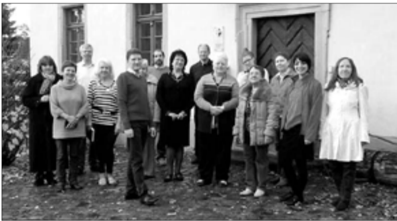
УЧАСТНИКИ СЕМИНАРА ИЗ ОБЩИН ГРУЗИИ, БЕЛОРУССИИ И ГЕРМАНИИ

Участники семинара надеются, что начатая совместная работа будет продолжена и в дальнейшем. ■