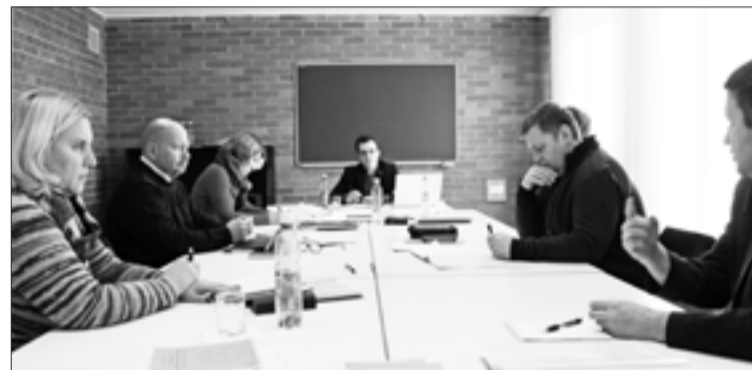
НА ЗАСЕДАНИИ КОНСИСТОРИИ

Также были приняты решения, касающиеся деятельности Теологической семинарии ЕЛЦ в Новосаратовке и проекта «Образование для служения». Члены Генеральной Консistorии положительно отреагировали на сообщение ректора об увеличении количества обучающихся на заочном отделении, о подготовке программы заочного образования в соответствии с требованиями Министерства образования, о регистрации Устава семинарии.