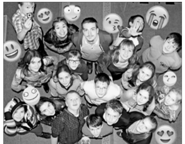
УЧАСТНИКИ МОЛОДЕЖНОЙ КОНФЕРЕНЦИИ “UPGRADE”-2015