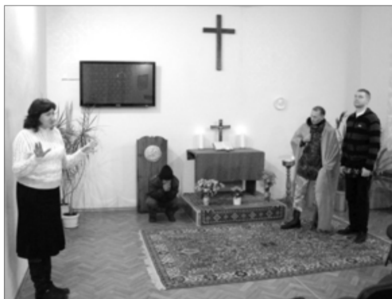
ДЕНЬ СВ. МАРТИНА В БЕРДЯНСКЕ (ЗАПОРОВСКАЯ ОБЛ.)

11 ноября в нескольких общинах Союза ЕЛЦ праздновали день св. Мартина – с традиционными фонариками, выпечкой и даже самим «Мартинином» на живой лошади!