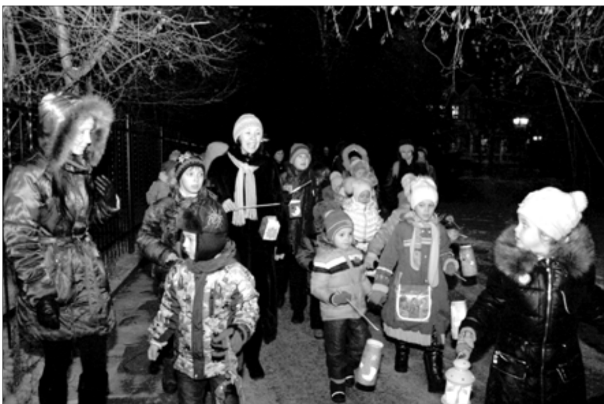
ДЕНЬ СВ. МАРТИНА В ТОМСКЕ