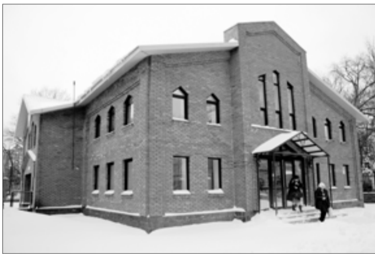
ЗДАНИЕ ДИАКОНИЧЕСКОГО ЦЕНТРА ЛЮТЕРАНСКОЙ ОБЩИНЫ В УФЕ