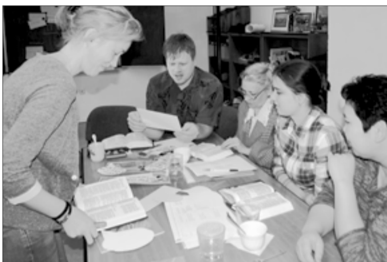
О КОММУНИКАЦИИ ГОВОРЯТСЯ И В БИБЛИИ

Почему фотография в уже отпечатанном издании является абсолютно неподходящей для публикации в газете или журнале? Ответ на этот и другие вопросы получили любознательные участники семинара в возрасте от 17