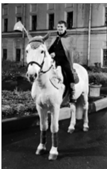
ДЕНЬ СВ. МАРТИНА В МОСКВЕ

11 ноября в нескольких общинах Союза ЕЛЦ праздновали день св. Мартина – с традиционными фонариками, выпечкой и даже самим «Мартинином» на живой лошади!