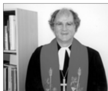
ПАСТОР ХАНС-ХЕРМАНН АХЕНБАХ

Писать некролог нелегко. От нахлынувших воспоминаний слезы застилают глаза, в горле ком, мысли путаются в голове. Я не могу поверить в то, что он ушел. Ушел навсегда.