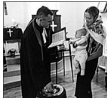
КРЕЩЕНИЕ В Г. МАЙСКОМ

По материалам сайта www.lutheranworld.ru