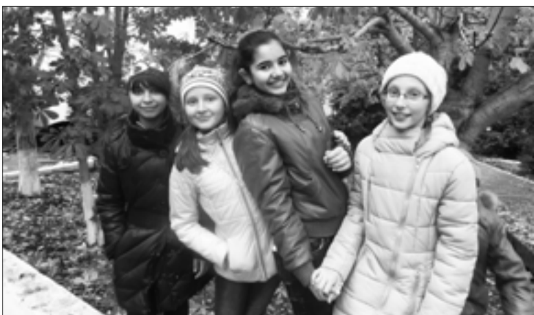
УЧАСТНИЦЫ БИБЛЕЙСКОЙ НЕДЕЛИ ДЛЯ ДЕТЕЙ

Также это мероприятие было приурочено к наступающим праздникам – дню св. Мартина и Рождеству. Ребята начали разучивать рождественский спектакль, репетиции которого собрали их затем во время Адвента. ■