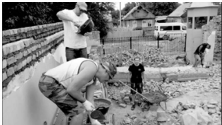
РАБОТЫ ПО ВОССТАНОВЛЕНИЮ СГОРЕВШЕЙ ЦЕРКВИ В БИШКЕКЕ