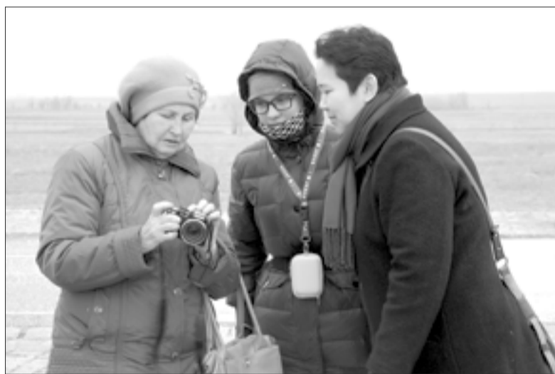
НА ЭКСКУРСИИ В РОССОШКЕ