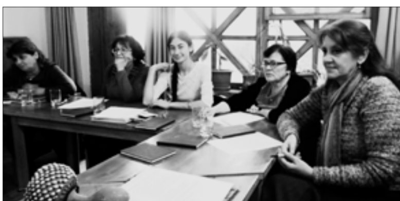
УЧАСТНИЦЫ СЕМИНАРА ДЛЯ ПЕДАГОГОВ

торой была работа в группах. Нам предстояло на основе случайного набора слов составить проповедь. Мы разделились на команды по три участницы, и, по счастливому стечению обстоятельств, каждая команда состояла из представительниц трех стран – Грузии, Армении и Азербайджана. Все участницы хорошо справились с заданием, наглядно продемонстрировав силу импровизации, что очень