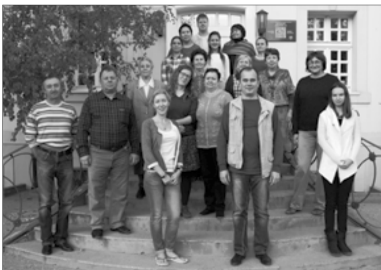
УЧАСТНИКИ И ПРЕПОДАВАТЕЛИ СЕМИНАРА

Шесть семинаров в Сарепте запланированы в период с 2015 до 2017 года. Они имеют различные темы и служат созиданию общин и обучению штатных сотрудников и волонтеров общин Поволжья. Финансовая поддержка осуществляется в рамках программы «Церкви помогают Церквям». ■