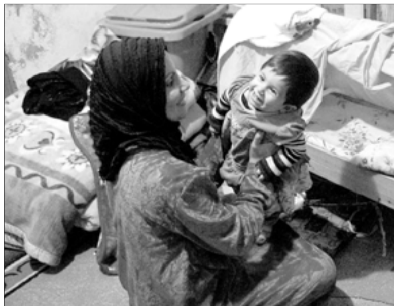
РОЖДЕСТВЕНСКАЯ ОТКРЫТКА ВЛФ: МАЛЕНЬКАЯ АМЕРА С МАМОЙ – БЕЖЕНЦЫ В СЕВЕРНОМ ИРАКЕ

Президент ВЛФ, семья которого также бежала в 1948 году из города Беэр-Шева (сегодня на территории Израиля), подчеркивает, что во все времена Церковь призвана служить слабым и защищать их – «искать для них пристанище». ■