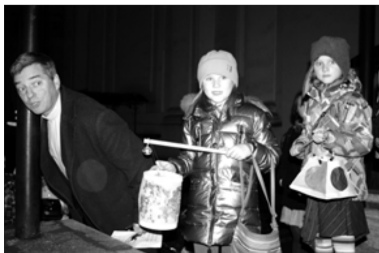
ДЕНЬ СВ. МАРТИНА В САНКТ-ПЕТЕРБУРГЕ