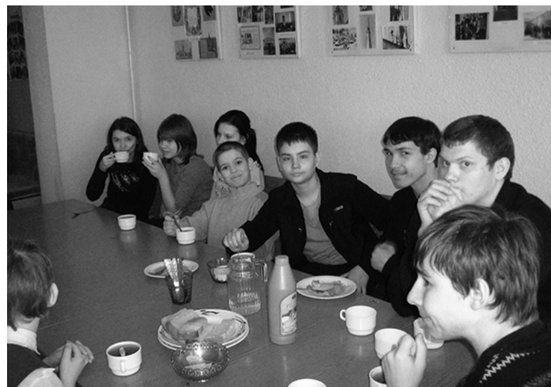
ШКОЛЬНИКИ В СТЕНАХ ЦЕРКВИ СВ. ГЕОРГА