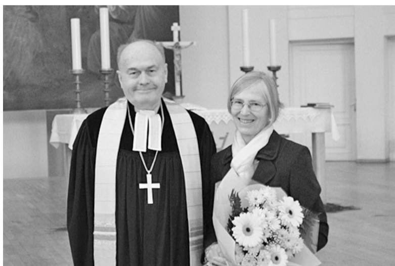
ПРОЩАНИЕ С ОБЩИНОЙ СВ. АННЫ И СВ. ПЕТРА СОСТОЯЛОСЬ НА ВОСКРЕСНОМ БОГОСЛУЖЕНИИ 30 МАЯ