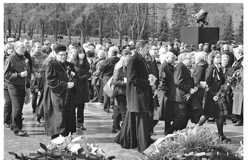
ВОЗЛОЖЕНИЕ ВЕНКОВ НА ПИСКАРЕВСКОМ КЛАДБИЩЕ