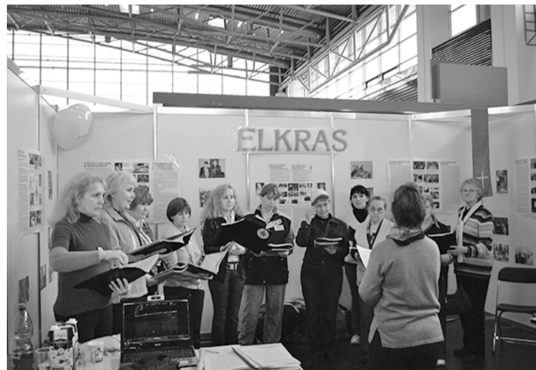
ХОР ЦЕРКВИ ВОСКРЕСЕНИЯ (КАЛИНИНГРАД) НА СТЕНДЕ ЕЛЦ