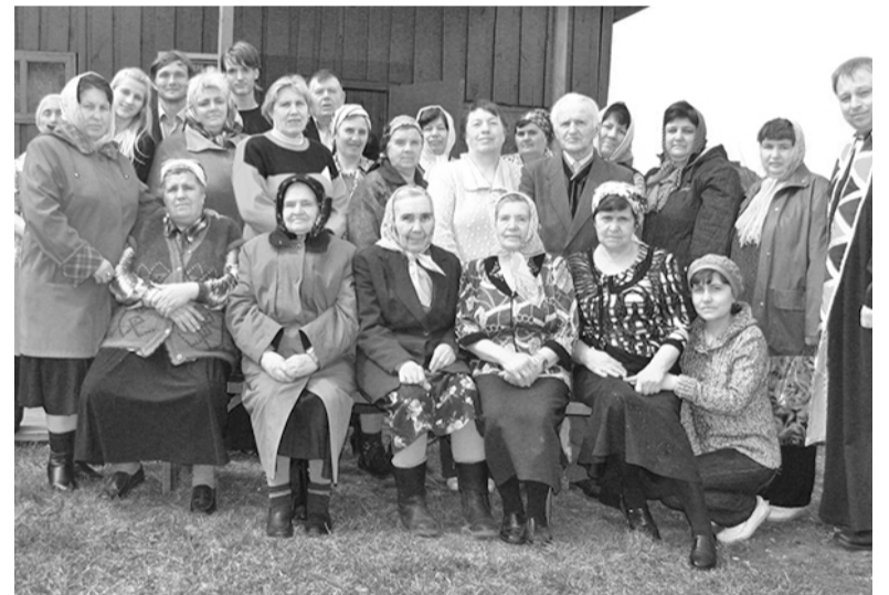
УЧАСТНИКИ ДНЯ ОБЩИН ПЕРЕД МОЛИТВЕННЫМ ДОМОМ В БОГРАДЕ