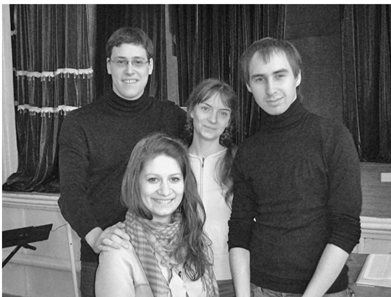
УЧАСТНИКИ МОЛОДЕЖНОЙ ГРУППЫ САМАРСКОЙ ОБЩИНЫ В НАДЕЖДИНО

САМАРА. Если верить опросу общественного мнения, то более 50% населения знает, что празднуется на Пасху – Воскресение Иисуса Христа. Но,