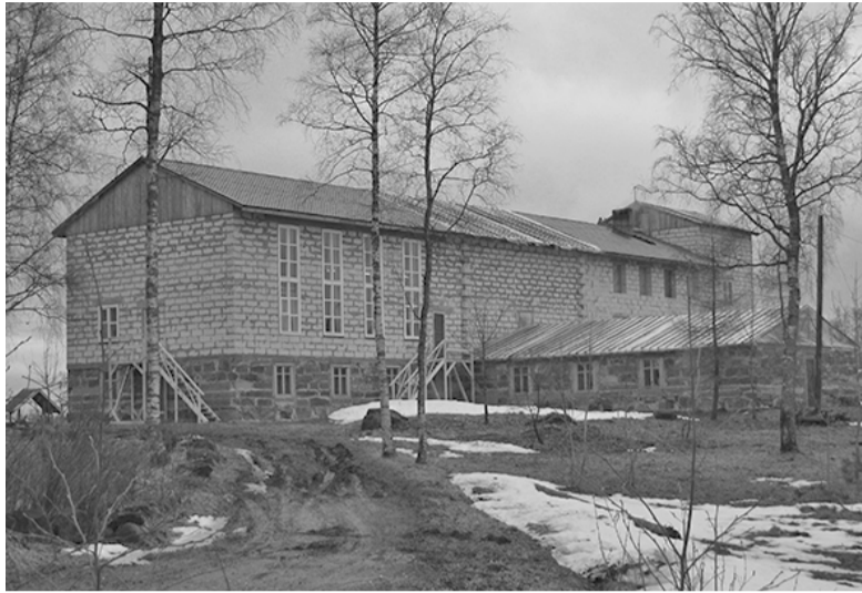
НОВАЯ ЦЕРКОВЬ В РУСКЕАЛА