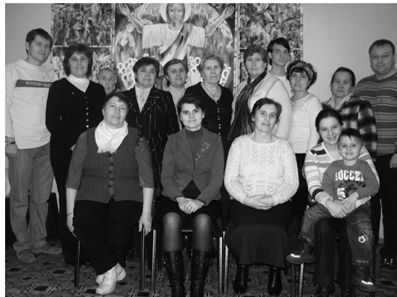
СОТРУДНИКИ ВОСКРЕСНЫХ ШКОЛ ОБЩИН ВОСТОЧНОЙ СИБИРИ – УЧАСТНИКИ СЕМИНАРА

АБАКАН. Община г. Абакана стала принимающей стороной для проведения регионального семинара по подготовке наставников воскресных школ. Подготовили семинар общины г. Абакана и г. Черногорска. 15 сотрудников из семи общин Восточной Сибири собрались 10 и 11 апреля в столице Хакасии. Лозунгом для семинара был взят стих из 126 Псалма «дети, награда от Него». В процессе семинара был разобран базовый курс, в который входили такие темы, как «Цели и задачи детского служения», «Шаги к организации воскресных школ», «Возрастные особенности и особенности современных детей в России», а так же «Структура занятия и условия проведения уроков». Участники смогли получить богатый практический материал для проведения игр, творческих занятий, библейских работ, а также много других идей для работы с детьми. Семинар прошел в доброй, семейной атмосфере и был отмечен хорошей организацией. Мы молимся за начало и за плоды этого семинара, чтобы знания, которые участники получили на нем, послужили становлению детской и молодежной работы в регионе. ■