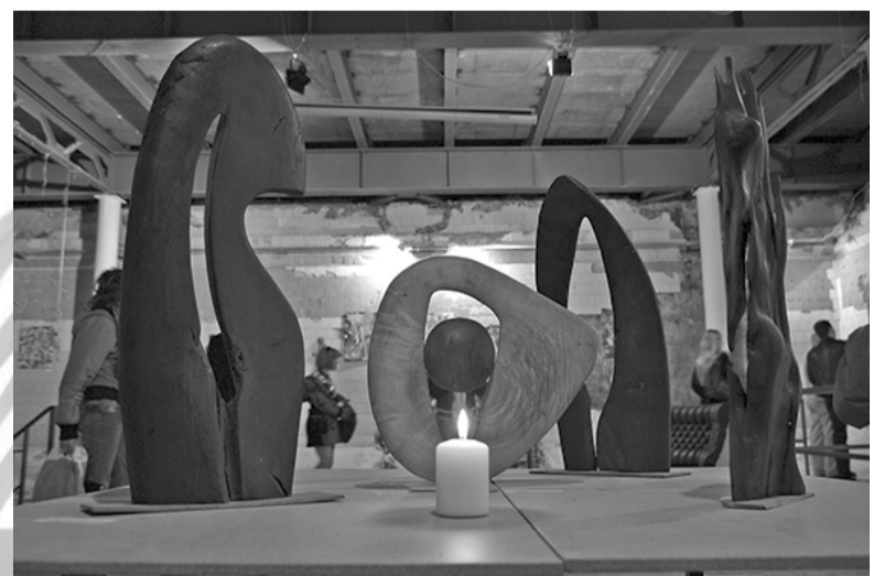
В ПОМЕЩЕНИИ ВЫСТАВКИ