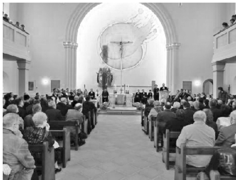
В ДЕНЬ ОТКРЫТИЯ 50-МЕТРОВОЕ ЗДАНИЕ, ВМЕЩАЮЩЕЕ ПОЛТЫСЯЧИ ЧЕЛОВЕК, БЫЛО ПЕРЕПОЛНЕНО

6 июня 2009 года в Одессе прошел обряд воздвижения нового креста на башню евангелическо-лютеранской церкви св. Павла. 27 февраля 2010 года состоялось освящение и поднятие колоколов восстанавливаемой церкви св. Павла. Наибольший колокол весит 1 000 кг и подарен городом-побратимом Регенсбургом. ■