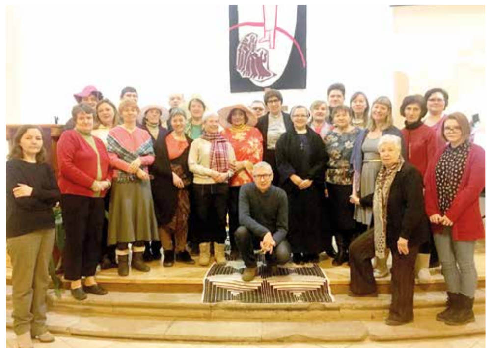
Участники богослужения ВДМ в 2018 году

Праздник завершился совместным чаепитием с выпечкой и суринамским национальным блюдом – бака бана. ■