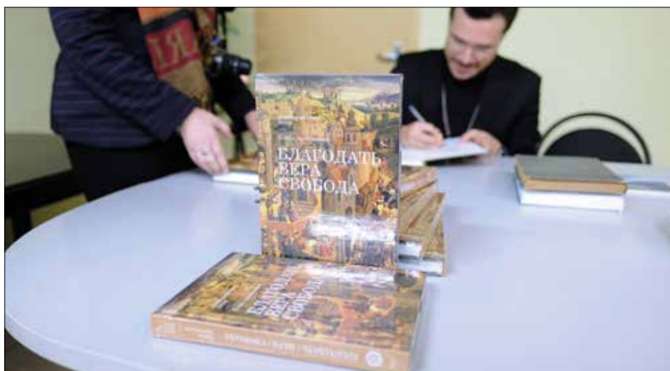
В издание вошли проповеди, прочитанные Архиепископом как в России, так и в других странах...

Книга выстроена в соответствии с циклом церковного года: от Адвента до Троицы, время после Троицы, включая Праздник урожая и День Реформации. В издание вошли проповеди, прочитанные Архиепископом как в России, так и в других странах. В него включены также молитвы на особые праздники. Книга иллюстрирована репродукциями картин Ганса Мемлинга и Рембрандта.