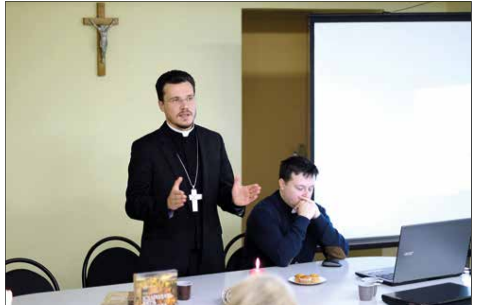
Дитрих Брауэр представляет свою книгу на встрече

«Вышел в свет сборник проповедей Архиепископа ЕЛЦР». Продолжение. Начало на с. 1