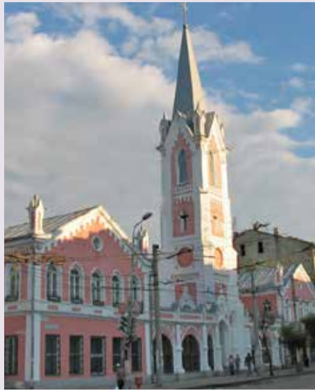
Церковь св. Георга в Самаре