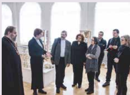
Гости встретились с представителями Русской Православной Церкви в Самарской области...