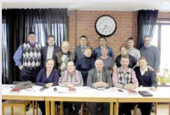
Участники встречи в Центре Христа