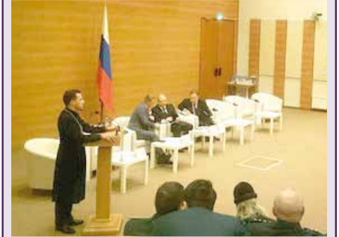
Архиепископ Дитрих Брауэр выступает на круглом столе

МОСКВА. Архиепископ Евангелическо-Лютеранской Церкви России Дитрих Брауэр принял участие в заседании круглого стола на тему «Религия и право. 20 лет Федеральному закону "О свободе совести и религиозных объединениях"».