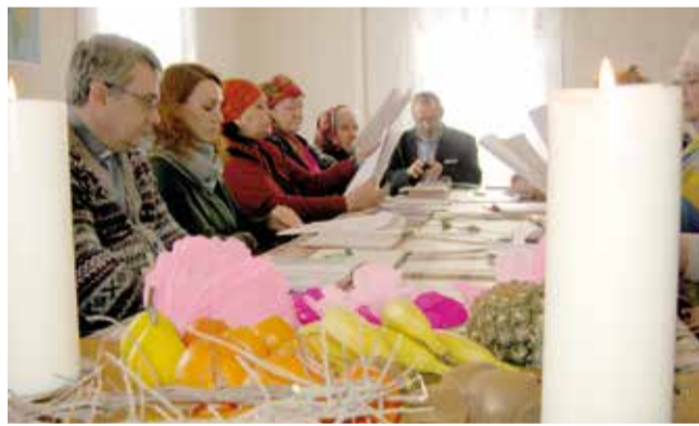
с. Пришиб (Благоварский р-н, Башкортостан)