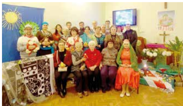
Бердянск (Запорожская обл.)