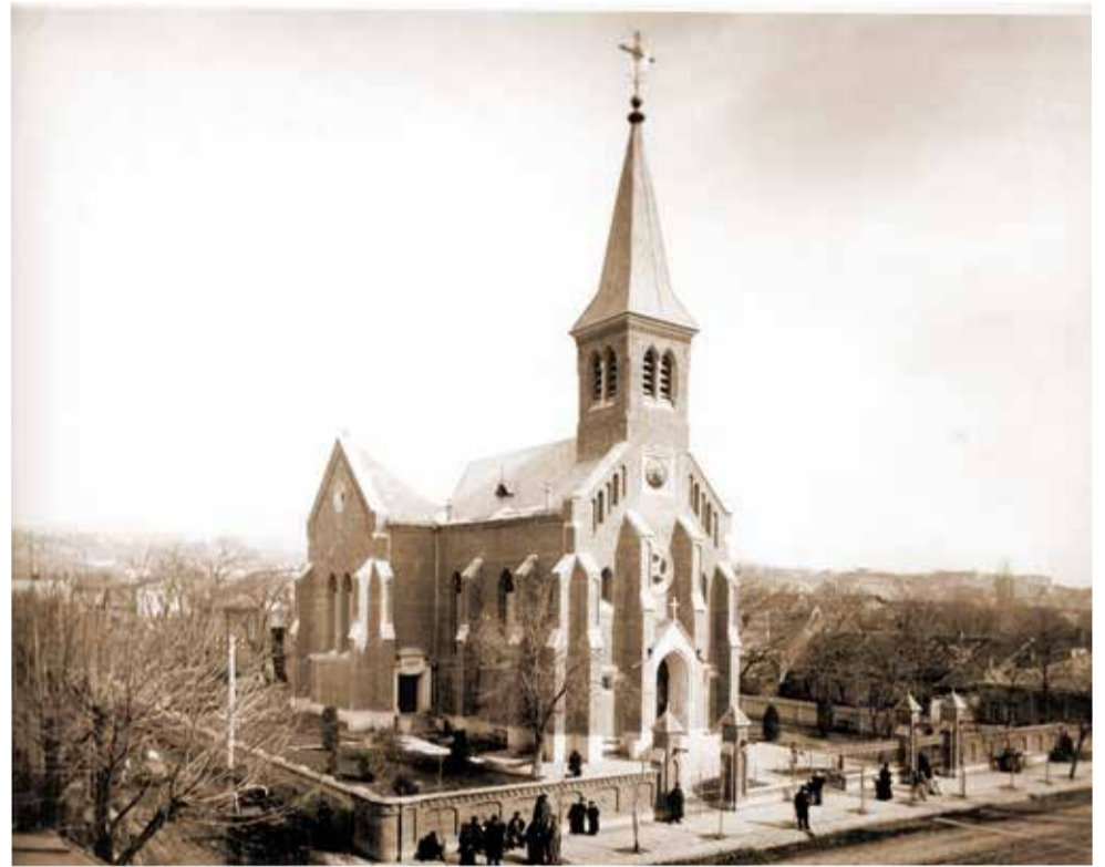
Лютеранская церковь свв. Петра и Павла на Кирочной площади в Тбилиси

Но что за звуки вдруг посреди ночи! Что случилось? Нет, это не взрыв, не бомбежка. Но что за звон и треск? Рушат кирху! Боже! Боже! Ужас и плач! Никто не ожидал и не мог даже подумать об этом! И кто рушит? Высокие, худые