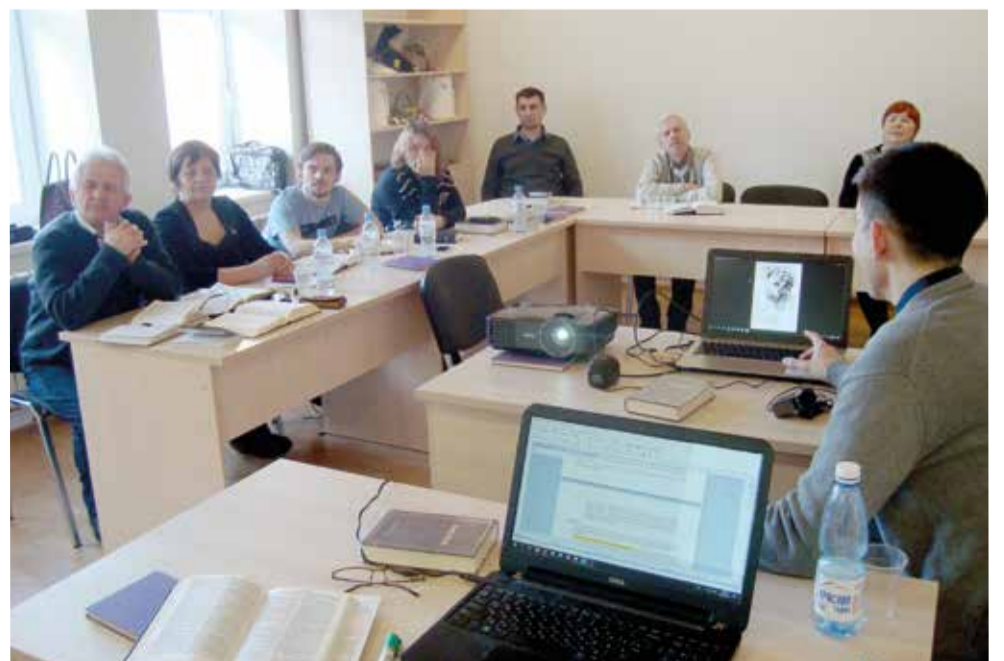
На семинаре в диаконическом центре

Показательно, что в ходе такого рода мероприятий на деле воплощается смысл Реформации, которую осуществил Мартин Лютер 500 лет назад. Христианство как вероучение из прерогативы клерикалов становится по-настоящему народным, когда простому человеку становится ясно и понятно Слово Божье и он начинает по нему строить свою жизнь, оно становится частью его повседневности. ■