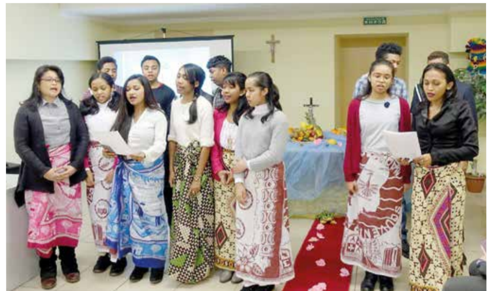
Украшением вечера стало яркое выступление хора франкоязычной общины...

Всемирный День Молитвы-2018 стал настоящим христианским праздником для всех пришедших в собор. Теплое дружеское общение продолжилось на фуршете в суринамском стиле, который готовили сами прихожане. ■