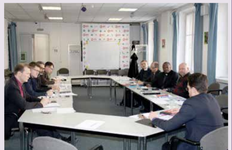
На заседании в историческом зале Консistorии в Петрикирхе