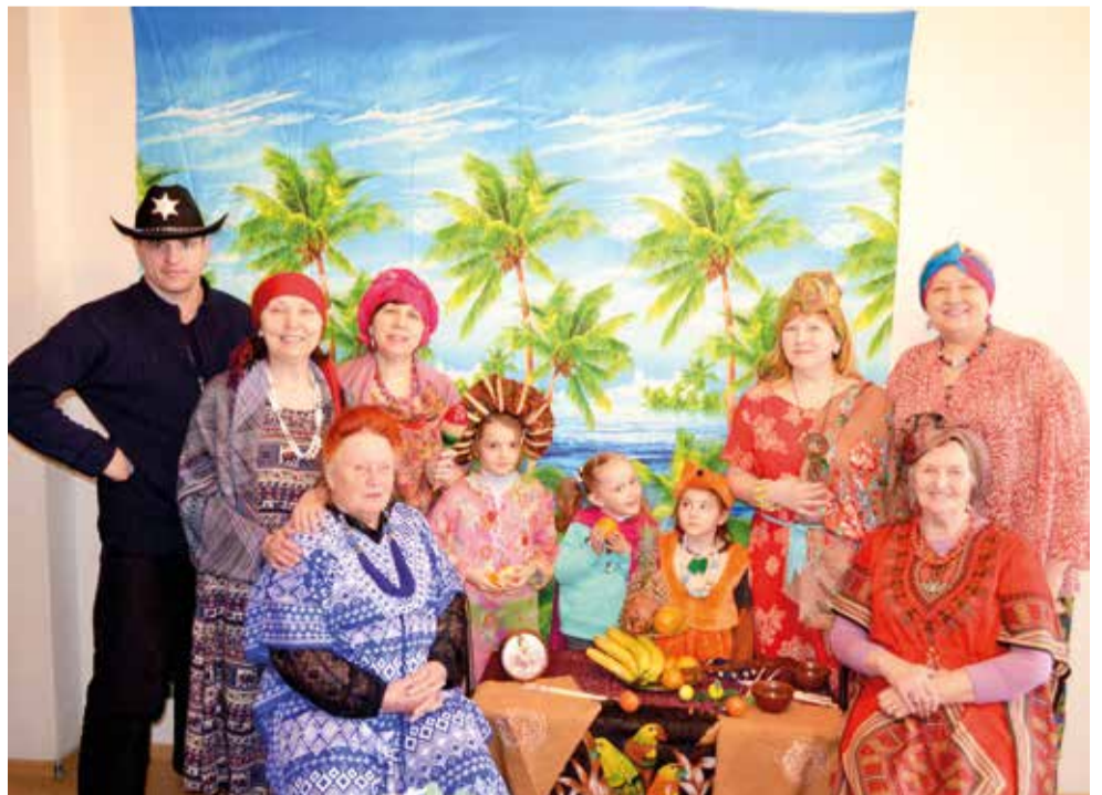
«Суринам» в Комсомольске-на-Амуре

тревожно, когда нам кажется, что у нас нет сил, что дух наш ослабел, обращаясь к Господу, мы получаем помощь. Он укрепляет нас и объединяет в одной общей молитве. ■