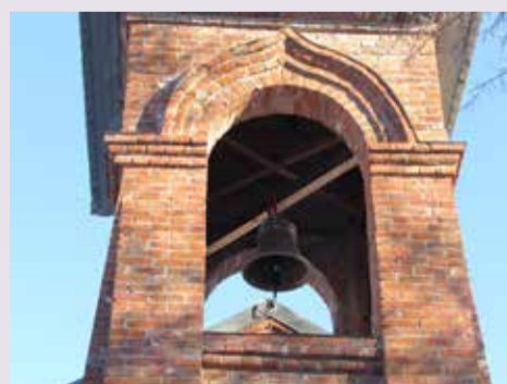
Колокол на колокольне церкви в Уфе

Колокол был приобретен при содействии благотворительного фонда «Урал», возглавляемого бывшим президентом Башкортостана Муртазой Губайдулловичем Рахимовым. ■