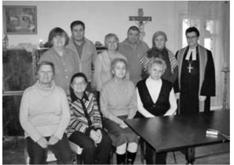
ВИЗИТ В ОБЩИНУ КОЛОМНЫ

Да благословит Господь служение Волгоградского пробства и всех тех, кто поддерживает его! ■