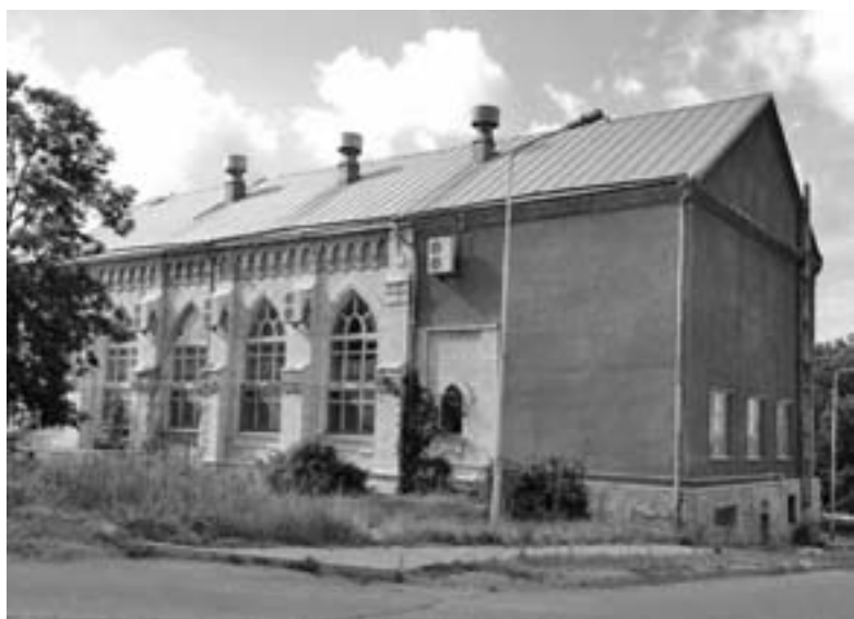
ЗДАНИЕ ЛЮТЕРАНСКОЙ ЦЕРКВИ В ПОС. ИНОЗЕМЦЕВО