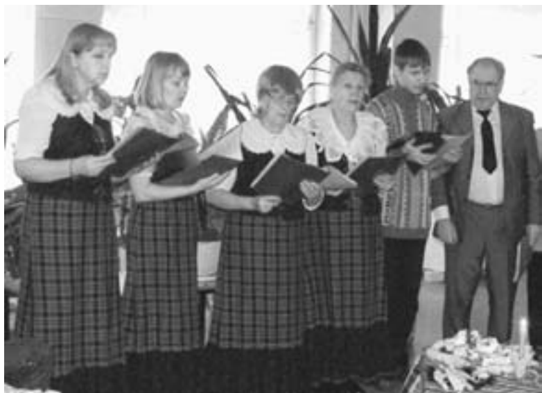
ВОКАЛЬНЫЙ АНСАМБЛЬ «САРЕПТЯНЕ» ДАЕТ КОНЦЕРТ В КАРДИОЛОГИЧЕСКОМ ОТДЕЛЕНИИ БОЛЬНИЦЫ Г. ВОЛГОГРАДА