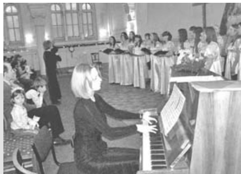
КОНЦЕРТ ХОРА «CANTARELLA» В ШВЕДСКОЙ ЦЕРКВИ

В программе концерта были рождественские песнопения и классическая музыка. Несмотря на столь серьезный репертуар, в течение полутора часов дети слушали музыку с восторгом и большим вниманием. По завершении концертной программы юных гостей ожидало чаепитие, а также специально приглашенный Дед Мороз, который раздал сладкие подарки и игрушки. ■