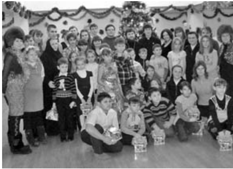
ДЕТИ ИЗ ТРЕХ ЦЕРКВЕЙ – УЧАСТНИКИ ПРАЗДНИКА