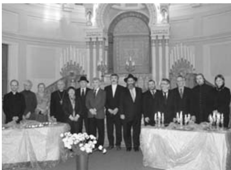
ПРЕДСТАВИТЕЛИ ХРИСТИАНСКИХ КОНФЕССИЙ, РЕЛИГИЙ, ПРАВИТЕЛЬСТВА ГОРОДА, ДИПЛОМАТЫ ПОЧТИЛИ ПАМЯТЬ ЖЕРТВ ХОЛОКОСТА

СООБЩЕНИЕ ЦЕНТРАЛЬНОГО ЦЕРКОВНОГО УПРАВЛЕНИЯ