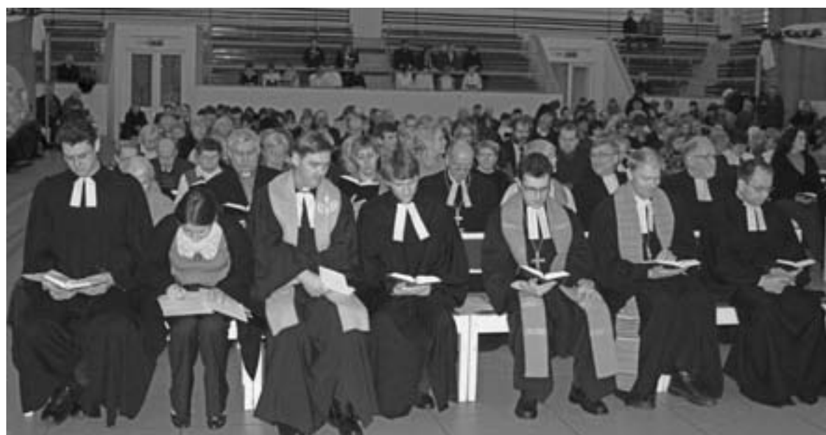
В ТОРЖЕСТВЕННОМ БОГОСЛУЖЕНИИ ПРИНЯЛИ УЧАСТИЕ МНОГИЕ ГОСТИ