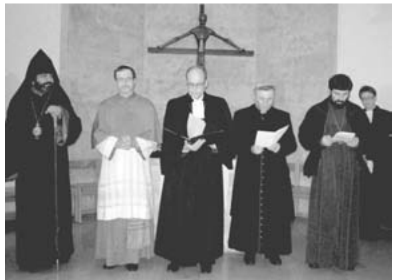
БЛАГОСЛОВЕНИЕ ЧЕТЫРЕХ ЕПИСКОПОВ

но, поэтому молитвы и литании были столь настойчивыми? Усилие в молитве и совместное обращение к Богу объединяют. Без совместной молитвы и выражения стремления к единству друг с другом, с различными Церквями и конфессиями нет христианства и христианской веры. Для этого не нужна единая Церковь, но нужно постоянное движение навстречу друг другу с уважением и взаимопомощью – экумена, а именно единое жизненное пространство перед Богом. Желание единства было видимым на совместном богослужении в лютеранской церкви Примирения 21 января, когда священнослужители устремились от алтаря к верующим, протягивая руки для приветствия мира. Это было замечательное и важное богослужение, несмотря на то, что оно не стало «официальным событием», и на нем отсутствовали не только представители Грузинской Православной Церкви, но также и представители государства, общества и посольств других стран. ■