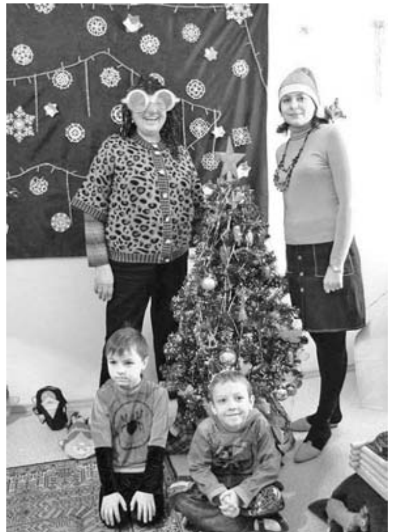
УЧАСТНИКИ ТЕАТРАЛИЗОВАННОГО ПРЕДСТАВЛЕНИЯ