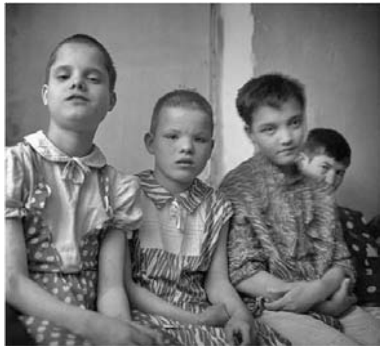
«КАК ВЫ СДЕЛАЛИ ОДНОМУ ИЗ СИХ БРАТЬЕВ МОИХ МЕНЬШИХ, ТО СДЕЛАЛИ МНЕ» (МФ 25,40)

«Надежда не постыжает...». Мы верим в то, что наш Бог силен, чтобы помочь тем, кому никто не может помочь. ■