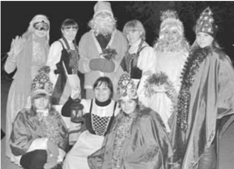
САНТА КЛАУС И МОЛОДЕЖЬ ОБЩИНЫ

Прошел парад по всей набережной Волги от Площади Ленина. Желающих посмотреть на необычный карнавал собралось много. Из-за полного отсутствия снега в тот день участники парада посыпали зрителей искусственными снежинками. Одним из главных событий парада стала передача особого «холодного» пламени от немецких Санта Клаусов российским Дедам Морозам. Возглавил праздничную колонну Дед Мороз – казак на коне и в папахе, а немецкая молодежь общины шла вслед за ним, приветствуя горожан. В радостной атмосфере на свежем воздухе среди участников праздника царил веселье. С собой они унесли много ярких впечатлений ■