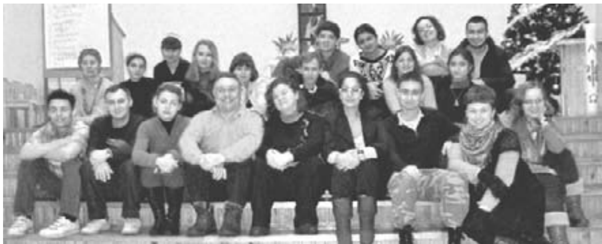
УЧАСТНИКИ МОЛОДЕЖНОГО ДНЯ В ЦЕРКВИ ВОСКРЕСЕНИЯ

Особый интерес вызвала игра «Три правды и одна ложь», которая позволила участникам лучше узнать друг друга, а также рождественский театр импровизаций. Около часа ночи присутствующие собрались в церкви для проведения вечерней молитвы. Это и стало апофеозом мероприятия для всех. Помещение церкви было освещено многочисленными свечами, стоящими на ступенях алтаря; каждый выходил вперед, зажигал свечу и тихо молился... ■