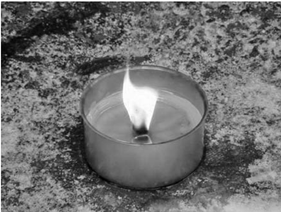
СВЕЧА НА МИТРОФАНИЕВСКОМ КЛАДБИЩЕ В САНКТ-ПЕТЕРБУРГЕ