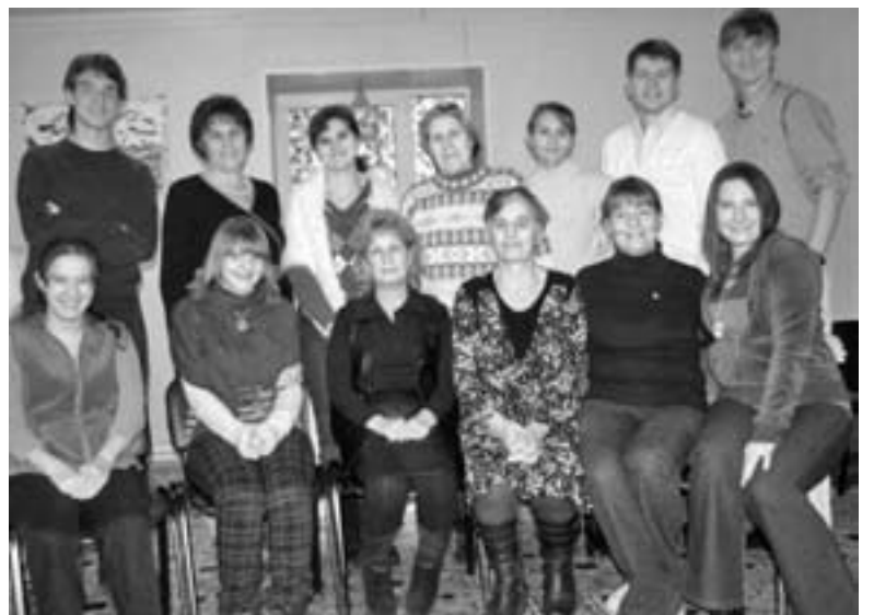
УЧАСТНИКИ СЕМИНАРА В АБАКАНЕ

тра для детской и молодежной работы стало еще одним шагом на пути объединения и интеграции внутри территориально очень большой региональной Церкви Урала, Сибири и Дальнего Востока. ■