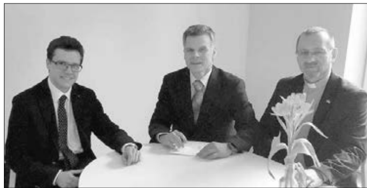
СЛЕВА НАПРАВО: АРХИЕПИСКОП ДИТРИХ БРАУЭР, СТАРШИЙ ЦЕРКОВНЫЙ СОВЕТНИК УЛЬРИХ ЦЕНКЕР, ЕПИСКОП СЕРГЕЙ МАШЕВСКИЙ