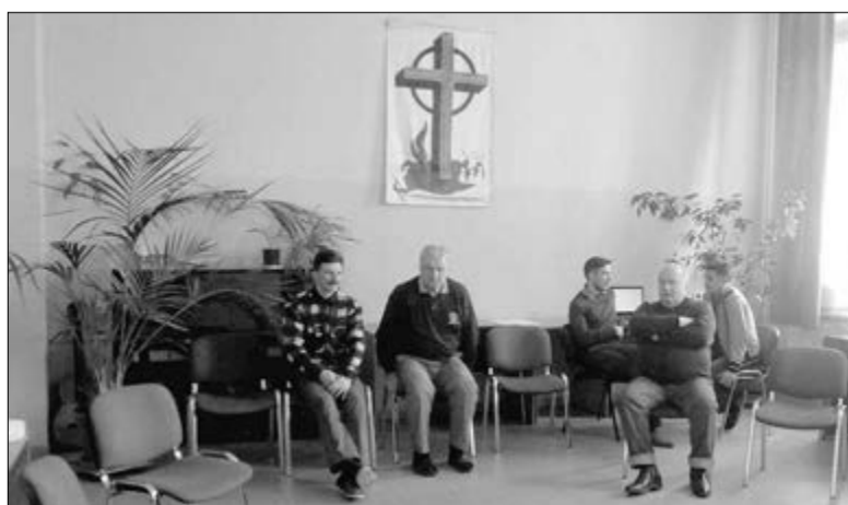
УЧАСТНИКИ КУРСОВ НА ЗАНЯТИЯХ