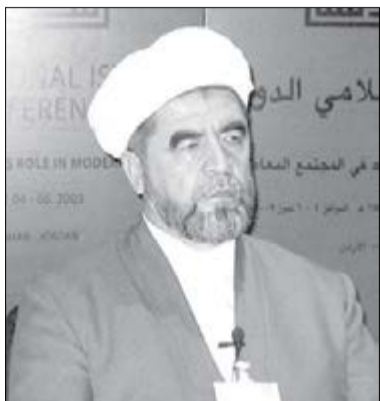
МУФТИИ МУХАММАД САДЫК МУХАММАД ЮСУФ