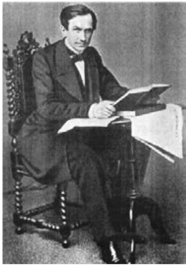
К.К. ГРОТ (1815-1897)