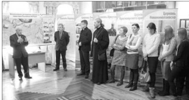
НА ОТКРЫТИИ ВЫСТАВКИ В ТОМСКОМ РОССИЙСКО-НЕМЕЦКОМ ДОМЕ

Посетить выставку можно будет до конца апреля. ■