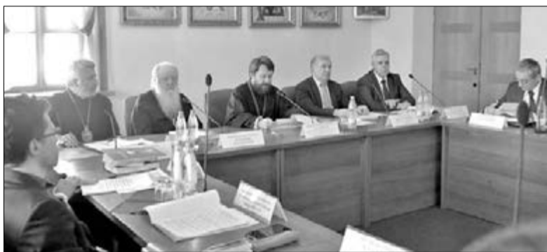
НА ЗАСЕДАНИИ КОМИССИИ ПО МЕЖДУНАРОДНОМУ СОТРУДНИЧЕСТВУ СОВЕТА ПО ВЗАИМОДЕЙСТВИЮ С РЕЛИГИОЗНЫМИ ОБЪЕДИНЕНИЯМИ ПРИ ПРЕЗИДЕНТЕ РОССИЙСКОЙ ФЕДЕРАЦИИ