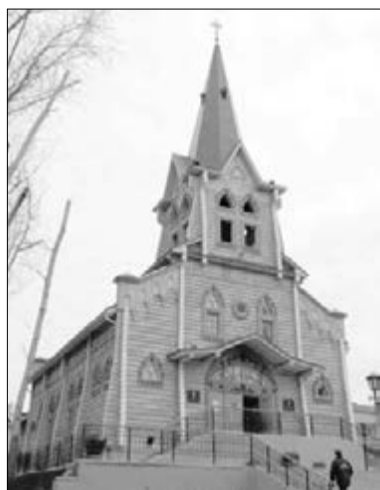
НЫНЕШНЕЕ ЗДАНИЕ ЛЮТЕРАНСКОЙ ЦЕРКВИ В ТОМСКЕ