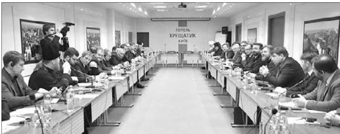
ЗАСЕДАНИЕ ВСЕУКРАИНСКОГО СОВЕТА ЦЕРКВЕЙ В ЗАЛЕ ОТЕЛЯ «КРЕЩАТИК»