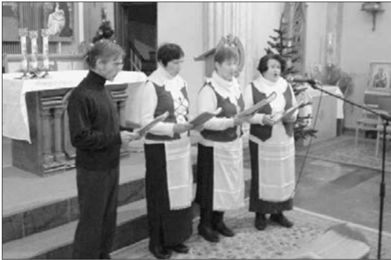
АНСАМБЛЬ ОБЩИНЫ ВЫСТУПАЕТ НА ФЕСТИВАЛЕ КОЛЯДОК В ЯЛТИНСКОМ КОСТЕЛЕ

Около 20 лет Бог ведет и сохраняет ялтинских лютеран как общину. ■