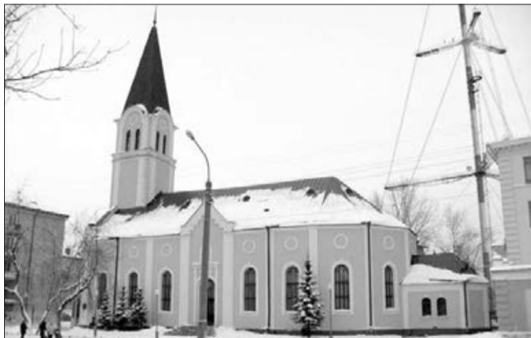
НА ИСТОРИЧЕСКОМ ЗДАНИИ ЦЕРКВИ СВ. ЕКАТЕРИНЫ БУДЕТ УСТАНОВЛЕНА МЕМОРИАЛЬНАЯ ДОСКА

16 марта евангелическо-лютеранской общине св. Екатерины г. Архангельска исполнилось 20 лет. 15 марта, в воскресенье Laetare,