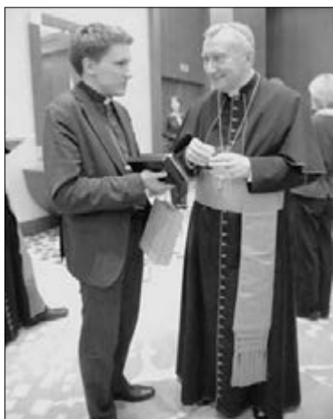
ПАСТОР ВЛАДИМИР ТАТАРНИКОВ (СПЕВА) ПЕРЕДАЛ В ДАР КАРДИНАЛУ ПЬЕТРО ПАРОЛИНЕ СБОРНИК ХОРАЛОВ ЕВАНГЕЛИЧЕСКО-ЛЮТЕРАНСКОЙ ЦЕРКВИ