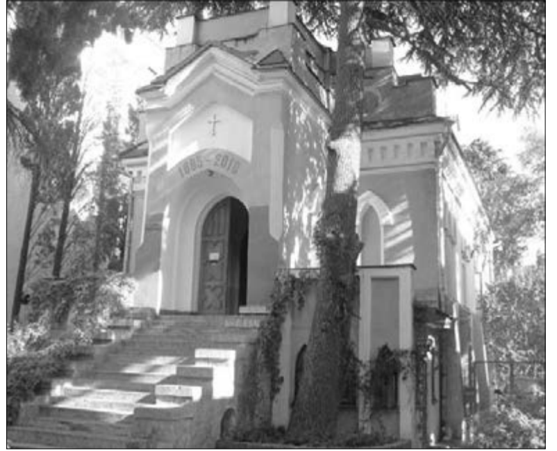
ИСТОРИЧЕСКОЕ ЗДАНИЕ ЛЮТЕРАНСКОЙ ЦЕРКВИ СВ. МАРИИ В ЯЛТЕ

Сегодня ялтинская община насчитывает 25 прихожан. С годами многие уходят, молодежь уезжает учиться, пожилые люди уходят из жизни. Порой община казалась неперспективной. Но приходят