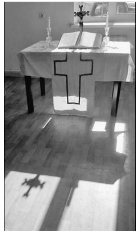
НОВОЕ РАСПЯТИЕ НА АЛТАРЕ

«Хорошие руки» нашлись довольно быстро. Первым человеком,