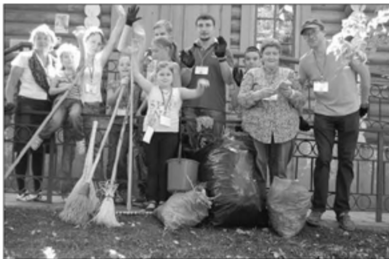
ДЕНЬ НА ТЕМУ «ТРУД»: ПОСЛЕ УБОРКИ ТЕРРИТОРИИ ВОКРУГ ЦЕРКВИ