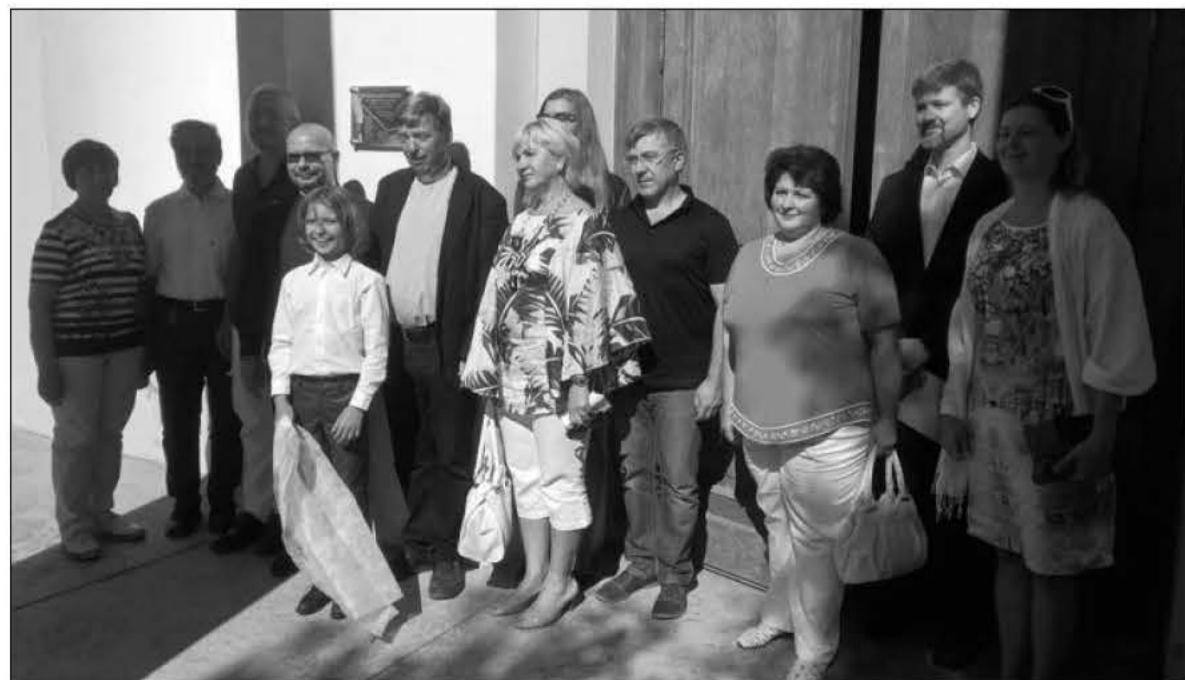
УЧАСТНИКИ ЦЕРЕМОНИИ УСТАНОВКИ ПАМЯТНОЙ ТАБЛИЧКИ

По материалам сайта www.novosaratovka.org