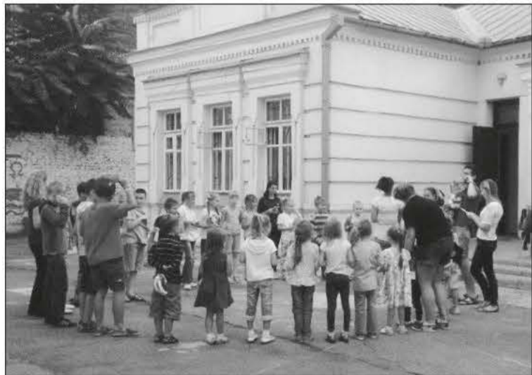
ВОСПИТАННИКИ И СОТРУДНИКИ ЛАГЕРЯ ВО ДВОРЕ ЦЕРКВИ СВ. ЕКАТЕРИНЫ

Господь благословил этот лагерь: привел детей, нашел сотрудников, дал ласковую и ясную погоду, благословил пожертвованиями, даровал хорошее настроение и уберек от всяческих проблем. За что Ему Единому честь, слава и благодарение! ■