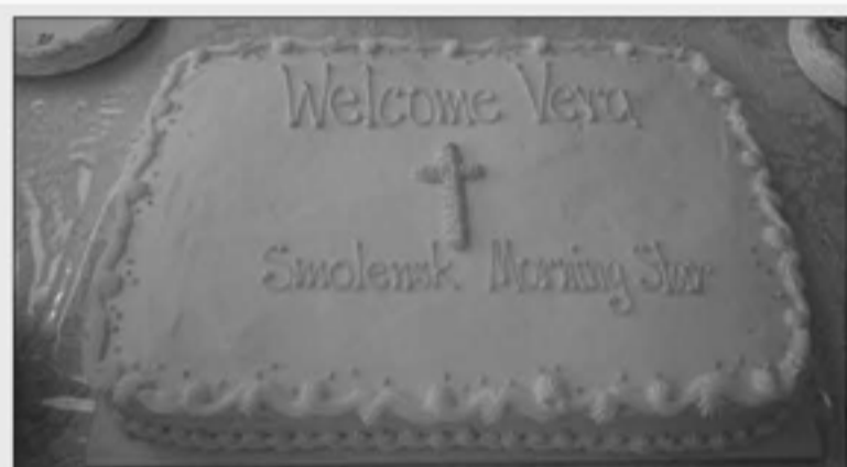
ИМЕННОЙ ТОРТ ДЛЯ ГОСТЕЙ ИЗ СМОЛЕНСКА В ОБЩИНЕ «УТРЕННЯЯ ЗВЕЗДА»

Встретили меня очень тепло и дружелюбно. Я услышала много незнакомых и непривычных имен,