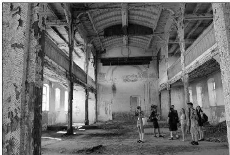
УЧАСТНИКИ СЕМИНАРА В ЗДАНИИ ЗАБРОШЕННОЙ КИРХИ В С. ПОДСТЕПНОЕ (РОЗЕНХАЙМ)

Данный проект осуществляется с 2007 года в местах бывшего и нынешнего компактного поселения российских немцев. В последние годы, помимо немецкого языка, истории, этнической идентичности большое внимание уделяется и религии. Ведутся занятия по истории религии, проводятся социальные акции, такие как уборка заброшенных церквей, неухоженных могил, ну и, самое главное, посещаются богослужения.