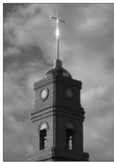
КОЛОКОЛЬНЯ ЦЕРКВИ СВ. ТРОИЦЫ С НЕДАВНО УСТАНОВЛЕННЫМ НА НЕЙ КРЕСТОМ

В начале 1990-х клуба не стало. Градообразующее предприятие, которому он принадлежал, уже не могло его содержать. Здание отдали городу. Какое-то время в нем был кинотеатр, его сменили магазины. Тогда же по воскресеньям