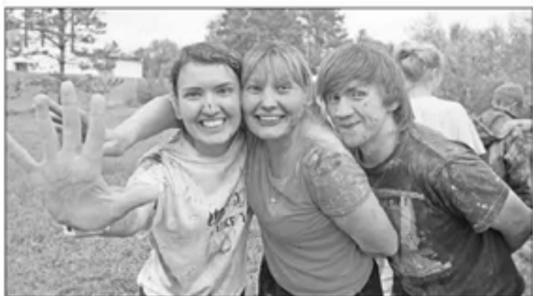
ФЕСТИВАЛЬ КРАСОК В МОЛОДЕЖНОМ ЛАГЕРЕ ЕЛЦ УСДВ

Темой лагеря в этом году была «Церковь». Он традиционно уместил