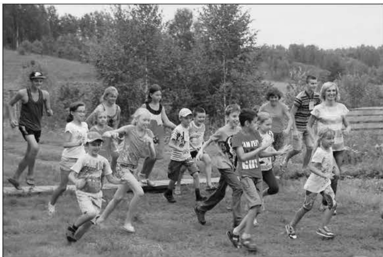
МЫ ПРИНЯЛИ АКТИВНОЕ УЧАСТИЕ В «ОЛИМПИЙСКИХ ИГРАХ»...

Наше пребывание в стране Дружбы закончилось, но осталось много друзей. Будут новые встречи. Мы очень надеемся, что через год вновь соберемся в христианском лагере, а друзьями останемся на всю жизнь. Мы хорошо уяснили, что «Друг любит во всякое время и, как брат, явится во время несчастья» (Притч. 17,17). ■