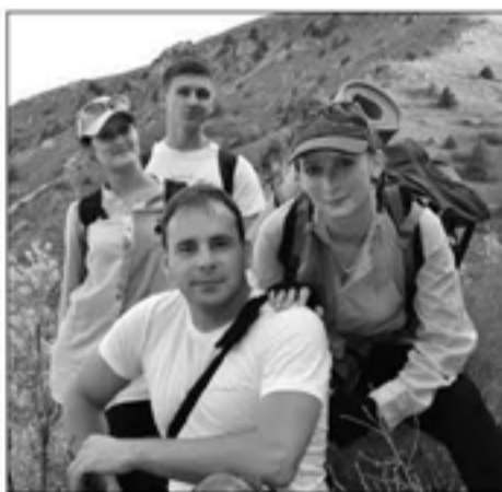
МОЛОДЕЖНАЯ ГРУППА ОБЩИНЫ ТАШКЕНТА – УЧАСТНИКИ ПОЕЗДКИ В ГОРАХ

ТАШКЕНТ. 18-19 августа молодежная группа общины г. Ташкента совершила поездку по Великому шелковому пути, проходящему по территории Узбекистана. Семеро участников путешествия познакомились с частью этого древнего маршрута – от Ташкента до Самарканда.