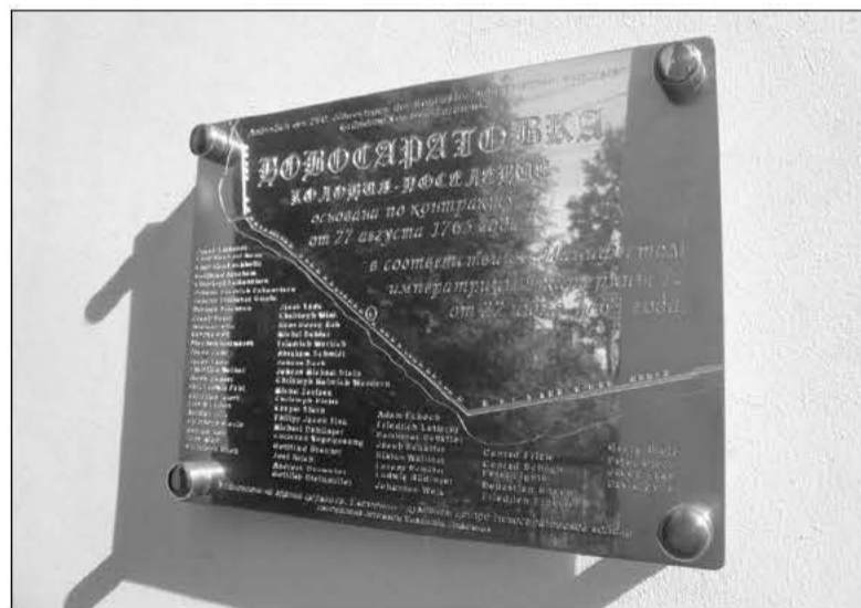
ПАМЯТНАЯ ТАБЛИЧКА УСТАНОВЛЕНА У ВХОДА В ЦЕРКОВЬ

Новосаратовская колония — отдельная, к сожалению, во многом забытая часть российской исто-