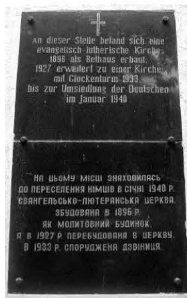
ПАМЯТНАЯ ДОСКА НА МЕСТЕ КИРХИ

переселения немцев в январе 1940 года евангелическо-лютеранская церковь, возведенная в 1896 году как молитвенный дом. А в 1927 году перестроенная в церковь. В 1933 году сооружена колокольня».