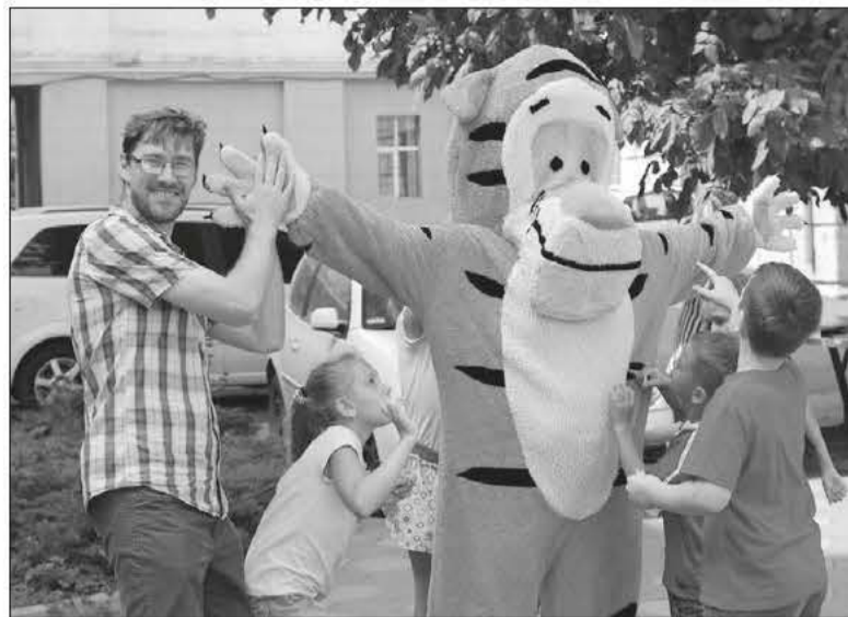
УТРОМ РЕБЯТ ВСТРЕЧАЛ ПУШИСТЫЙ ЛАГЕРНЫЙ ДРУГ – ТИГР...

Сотрудники лагеря (они же «советники мэра города особенных») пригласили детей в увлекательное пятидневное путешествие по сказочному городку. В первый же