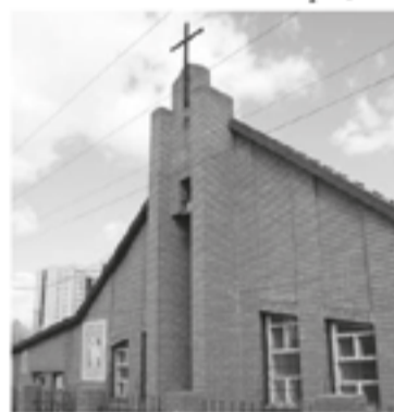
ЗДАНИЕ ЛЮТЕРАНСКОЙ ЦЕРКВИ В АСТАНЕ

По материалам пресс-службы Всемирной Лютеранской Федерации