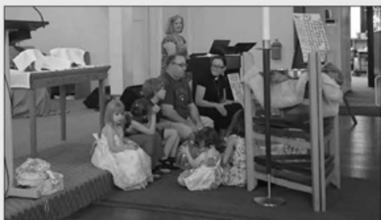
ДЕТСКАЯ ГРУППА НА БОГОСЛУЖЕНИИ В ОБЩИНЕ «УТРЕННЯЯ ЗВЕЗДА»

После службы все прихожане и гости отправились на первый этаж, где общение продолжилось уже в неформальной обстановке и где, к моему изумлению, меня ждал именной торт! С куском торта, кружкой чая и прочими вкусностями я отправилась развивать партнерские отношения. Ведь что лучше всего располагает людей к общению? Конечно, совместное чаепитие и доброжелательный настрой, который не может не быть таковым после вдохновляющей службы и куса изумительного торта! ■