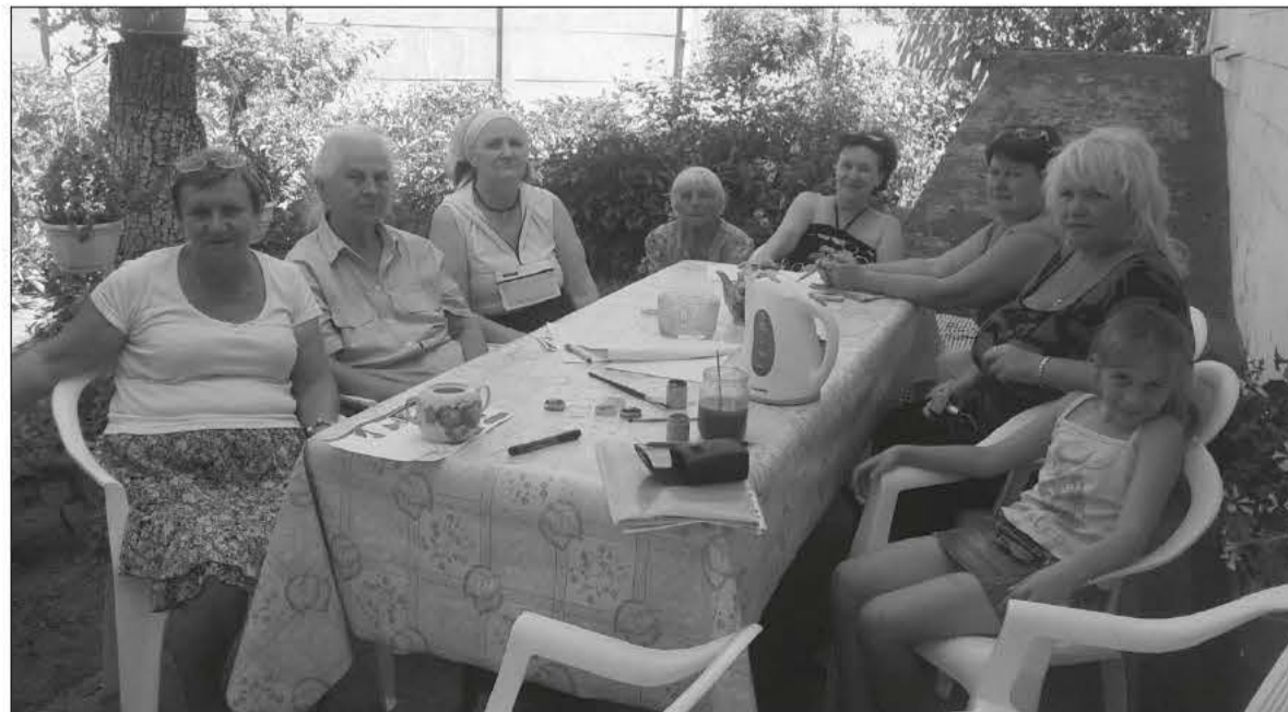
УЧАСТНИЦЫ ЖЕНСКОГО СЕМИНАРА В ОБЩИНЕ ЗАПОРОЖЬЯ

Проведение семинаров приближает нас к Богу и сближает друг с другом. ■