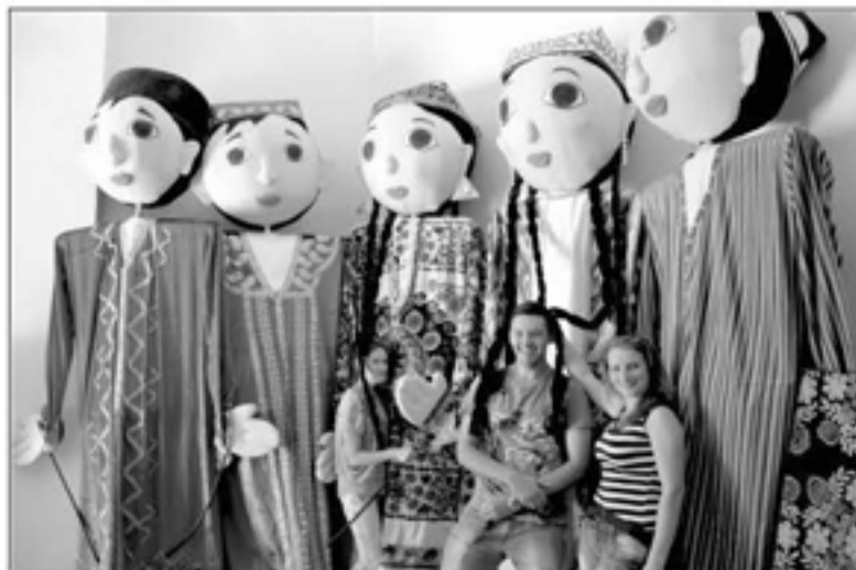
С «МЕСТНЫМИ ЖИТЕЛЯМИ»

ЮНЕСКО приняла в 1987 году программу «Шелковый путь – путь диалога». Не так давно страны-участники Великого шелкового пути, среди которых Китай, Киргизия, Казахстан, Узбекистан и другие, приняли решение о совместной подготовке к подаче заявки в ЮНЕСКО на включение Великого шелкового пути в список мирового наследия.