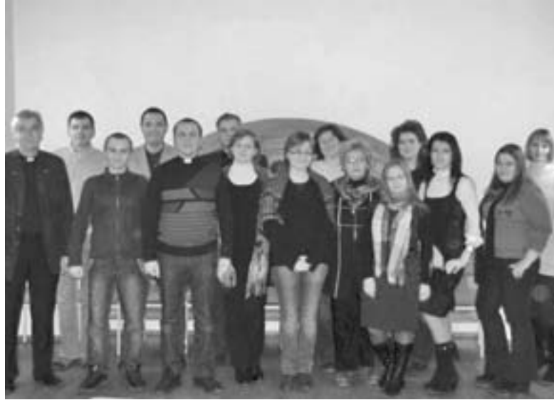
УЧАСТНИКИ СЕМИНАРА – ПРЕДСТАВИТЕЛИ РАЗЛИЧНЫХ ОБЩИН УКРАИНЫ

факультативная, но именно она стала важной частью программы во второй половине дня. Представители лютеранских общин выразили желание, чтобы подобного рода семинары проходили как можно чаще, и руководство НЕЛЦУ этому поспособствовало. ■