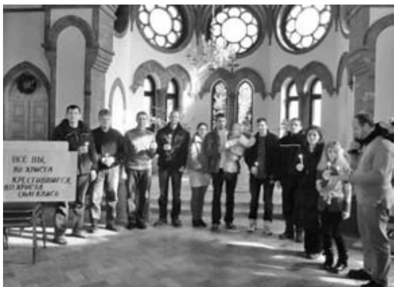
О СВОЕМ КРЕЩЕНИИ ВСПОМИНАЛИ УЧАСТНИКИ БОГОСЛУЖЕНИЯ В ЦЕРКВИ СВ. ПАВЛА

Главным изречением богослужения стали слова: «Все вы, во Христа крестившиеся, во Христа облечлись» (Гал 3,27). А основной идеей – то, что Крещение означает желание жить во Христе. ■