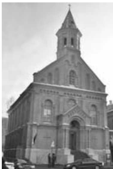
ЗДАНИЕ ЭСТОНСКОЙ ЕВАНГЕЛИЧЕСКО-ЛЮТЕРАНСКОЙ ЦЕРКВИ СВ. ИОАННА

ЭЛЬВИРА ЖЕЙДС, ТЕОЛОГИЧЕСКИЙ РЕФЕРЕНТ АРХИЕПИСКОПА ЕЛЦ