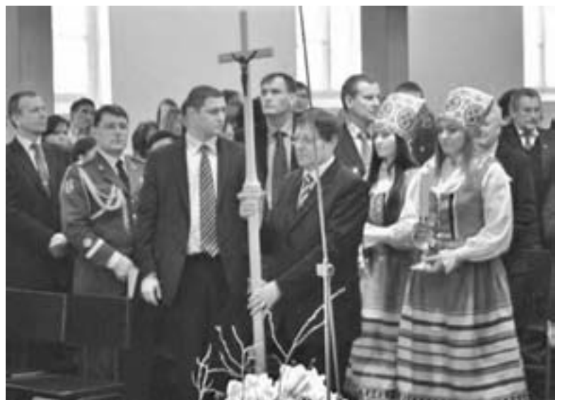
ГОСТИ ПРАЗДНИЧНОГО БОГОСЛУЖЕНИЯ