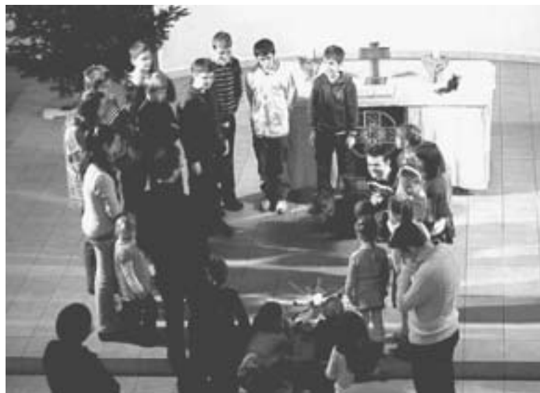
ПЕРЕД АЛТАРЕМ МЫ ОБРАЗУЕМ КРУГ...

Мы читаем детям истории из Библии, знакомя их, тем самым, с основами нашей веры. Конечно, от них требуется немного терпения для того, чтобы слушать библейскую историю с переводом. Однако и совсем маленькие, и детишки постарше с большим вниманием слушают истории, а затем рассказывают и о своих мыслях. Заканчивается детское богослужение молитвой и благословением. После этого начинается чаепитие и игры. Кстати, с этого года, каждый ребенок будет получать «карту детских богослужений», на которой будут отмечаться посещения. Как только на карте появится пять печат-