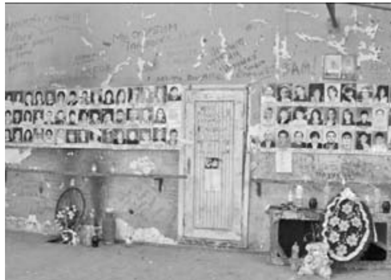
ГОСТИ ПОСЕТИЛИ ШКОЛУ N 1 В БЕСЛАНЕ