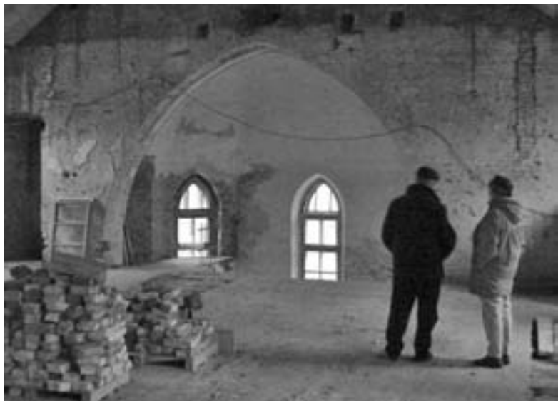
ТАК ВЫГЛЯДИТ ВНУТРЕННЕЕ ПОМЕЩЕНИЕ ЦЕРКВИ СЕГОДНЯ

БЕРДЯНСК. В Бердянске полным ходом идут работы по реконструкции кирхи Христа Спасителя. Она была построена в самом начале XX века и освящена в 1903 году, а в 1930-е закрыта и переоборудована под школу. Более семидесяти лет церковное здание использовалось не по назначению, было до неузнаваемости перестроено внутри. Все эти долгие годы оно не ремонтировалось и поэтому лишилось внешней красоты и величия.