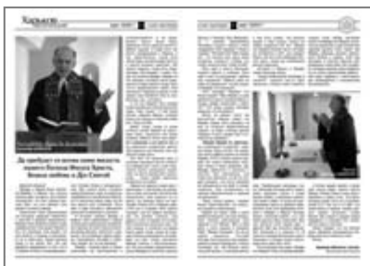
С ЛЮБОВЬЮ И ПОЖЕЛАНИЕМ БОЖЬИХ БЛАГОСЛОВЕНИЙ РЕДАКЦИЯ ГАЗЕТЫ «ХАРЬКОВ ЛЮТЕРАНСКИЙ»

о жизни, событиях и планах вашей общины, статьи о ваших личных переживаниях, эмоциональные отклики на церковные мероприятия, события, а также высказывания и пожелания об улучшении нашей работы. Ждем также предложения о новом названии газеты всего нашего Церковного округа.