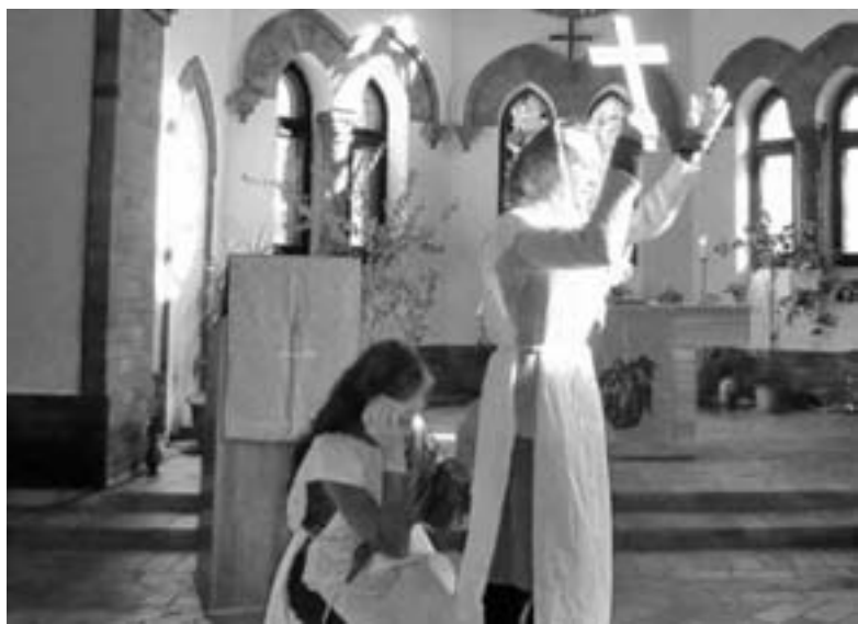
ОБЩИНА ПОДГОТОВИЛА НЕБОЛЬШОЕ ПРЕДСТАВЛЕНИЕ «ОТ САВЛА К ПАВЛУ»

Нас наполняет радостью и гордостью мысль о том, что церковь во Владивостоке носит имя апостола Павла. ■