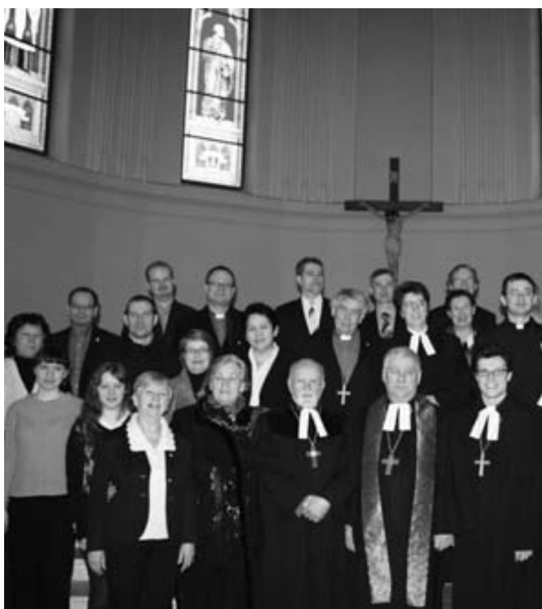
ДЕЛЕГАТЫ, ГОСТИ XVIII СИНОДА, ПРИХОЖАНЕ ОБЩИНЫ СВВ. ПЕТРА И ПАВЛА ПО ОКОНЧАНИИ БОГОСЛУЖЕНИЯ В ЗАВЕРШЕНИЕ СИНОДА В КАФЕДРАЛЬНОМ СОБОРЕ СВВ. ПЕТРА И ПАВЛА В МОСКВЕ 12 МАРТА 2011 ГОДА