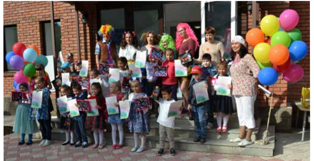
Выпускной проекта «Росток»

26 августа состоялся выпускной праздник с танцами, песнями, вручением памятных фотографий, поздравлений, благодарственных писем. После множества добрых слов в адрес друг друга оставалось только загадать заветное желание и выпустить в небо разноцветные шарики с нашими мечтами. ■