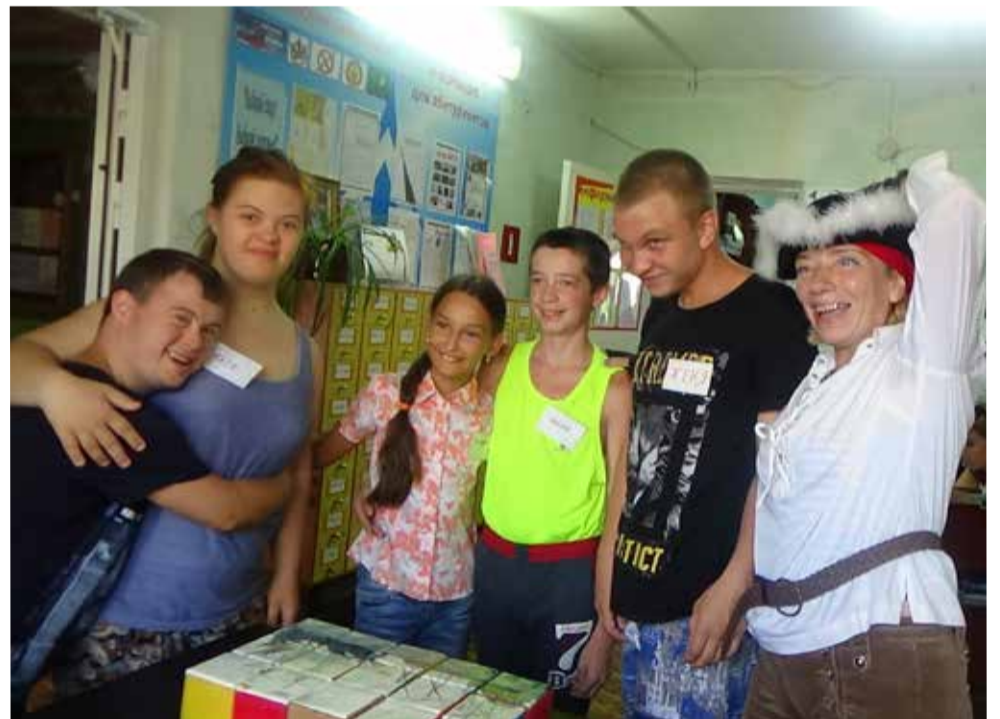
В местной библиотеке ребята приняли участие в квесте по книге Р.Л. Стивенсона «Остров сокровищ»...

Ребята рисовали и играли, занимались работой по дому и вечером танцевали. Все условия были созданы для того, чтобы каждый участник лагеря получил опыт трудовой деятельности, узнал что-то новое, отдохнул и приобрел новых друзей. ■