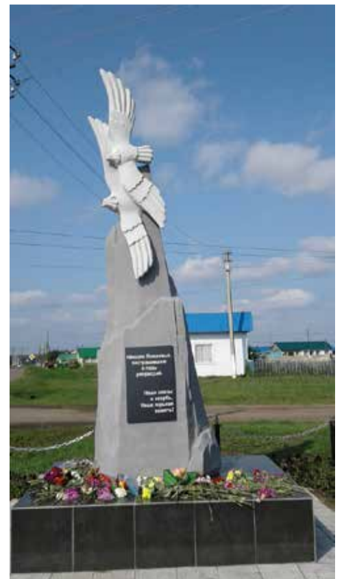
28 августа этого года в с. Суерка Упоровского р-на Тюменской обл. открылся памятник репрессированным немцам Поволжья