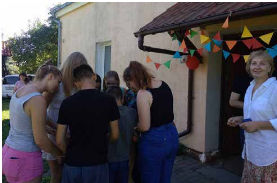
Ребята должны были пройти игру-квест, отправиться на поиски свободы и сокровищ...

Очень надеемся, что со временем общинный дом в Большой Поляне станет гостеприимным пристанищем для молодых людей не только из Калининградской области, но и из других регионов и эти встречи будут наполнены верой, дружеским общением, новыми знаниями и станут надежной опорой на жизненном пути девушек и юношей. ■