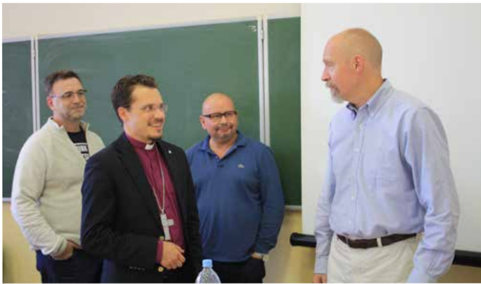
Архиепископ Дитрих Брауэр с преподавателями семинарии