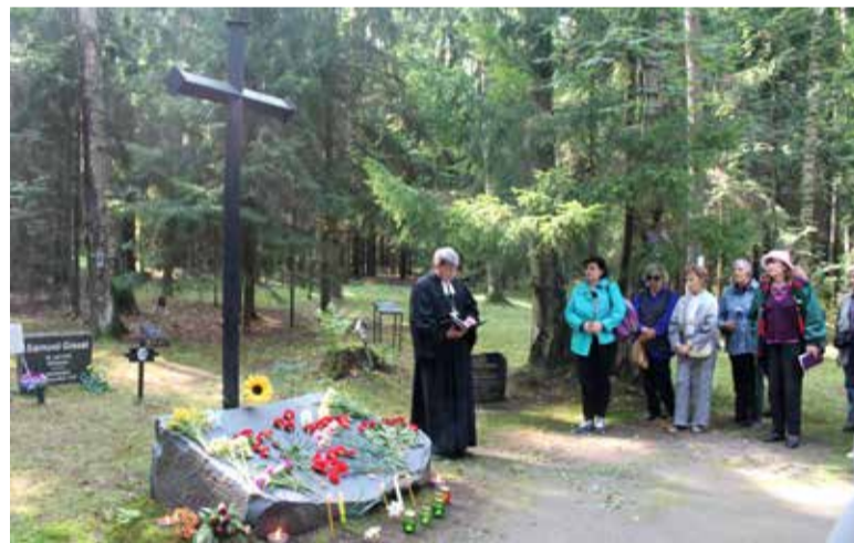
Молитва у мемориала российским немцам на Левашовском кладбище в Петербурге