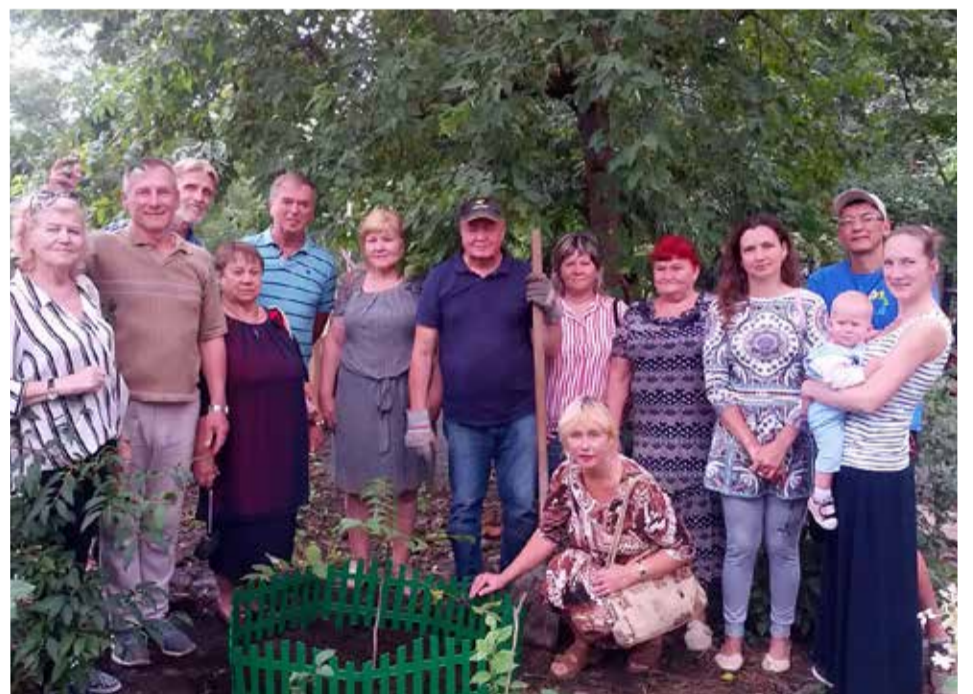
Памятное дерево в саду церкви св. Павла

Людей объединяют не только общее дело или интересы, но и общие страдания и испытания. ■