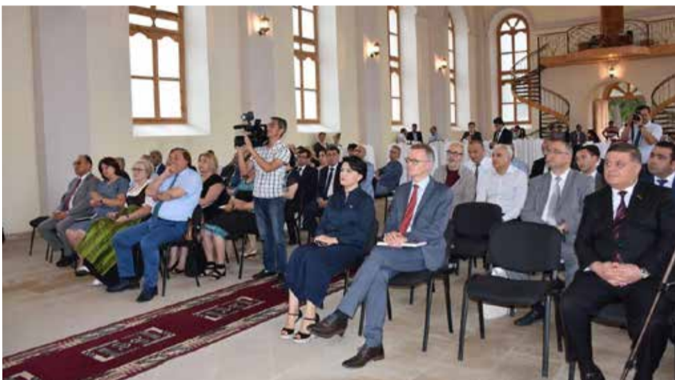
Памятное мероприятие 17 июля в здании лютеранской церкви в Гейгёле