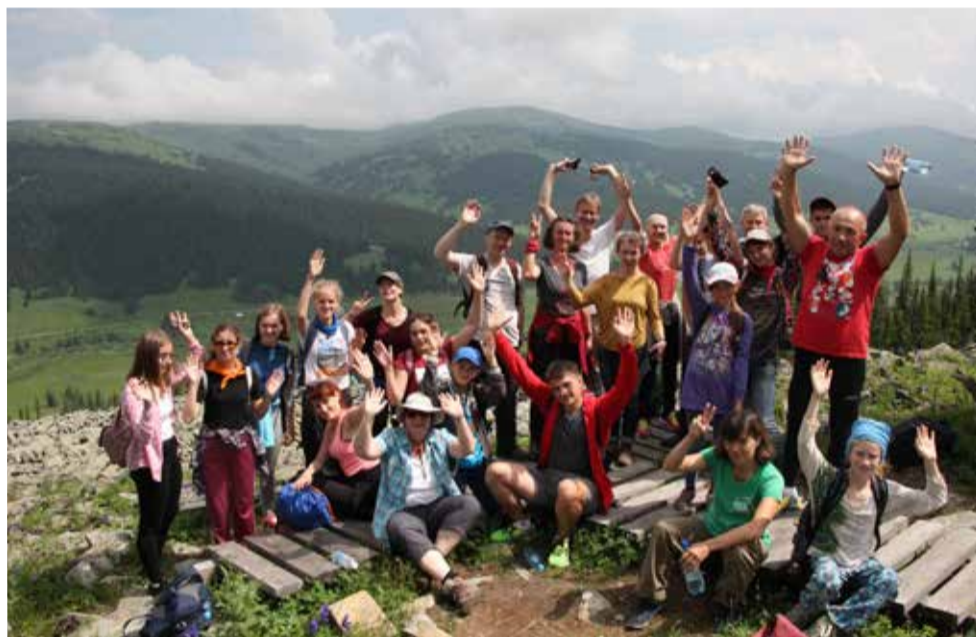
Поход с гостями из Йены в горы Сундуки – место древней обсерватории

В аэропорту мы как могли оттягивали время прощания. Но уже сейчас мы планируем следующую встречу. Знаем точно: наша дружба будет продолжаться. ■