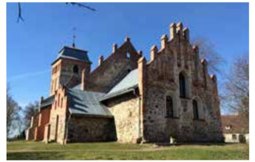
Здание церкви в Тургенево

До 1945 года здание функционировало как приходская евангелическо-лютеранская церковь. После Первой мировой войны на средней части здания, недалеко от колокольни, был установлен памятник жертвам войны. С 1945 по 1960 годы в церкви размещался сельский клуб, в дальнейшем здание находилось в запустении и разрушалось.