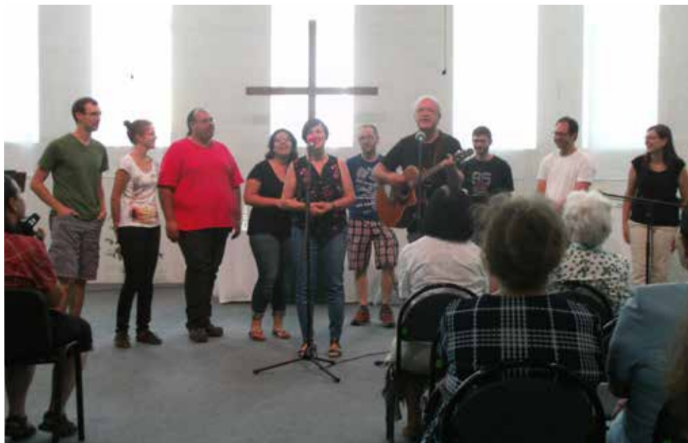
Команда помощников – волонтеров из Испании исполняют песнопения