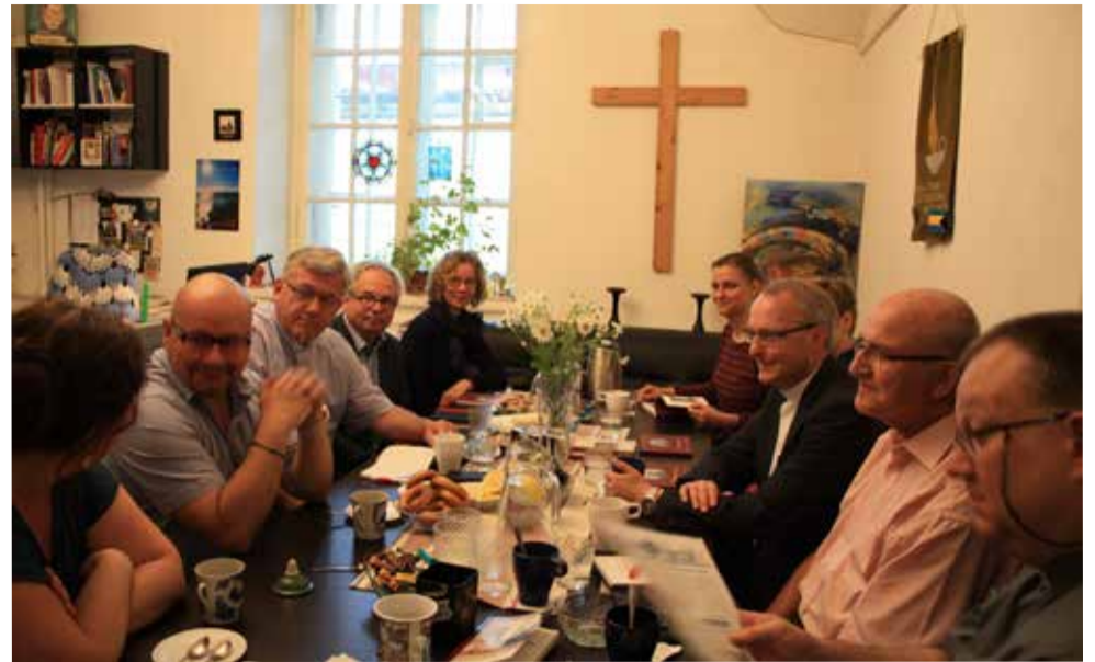
Гости в Канцелярии Архиепископа в Петербурге