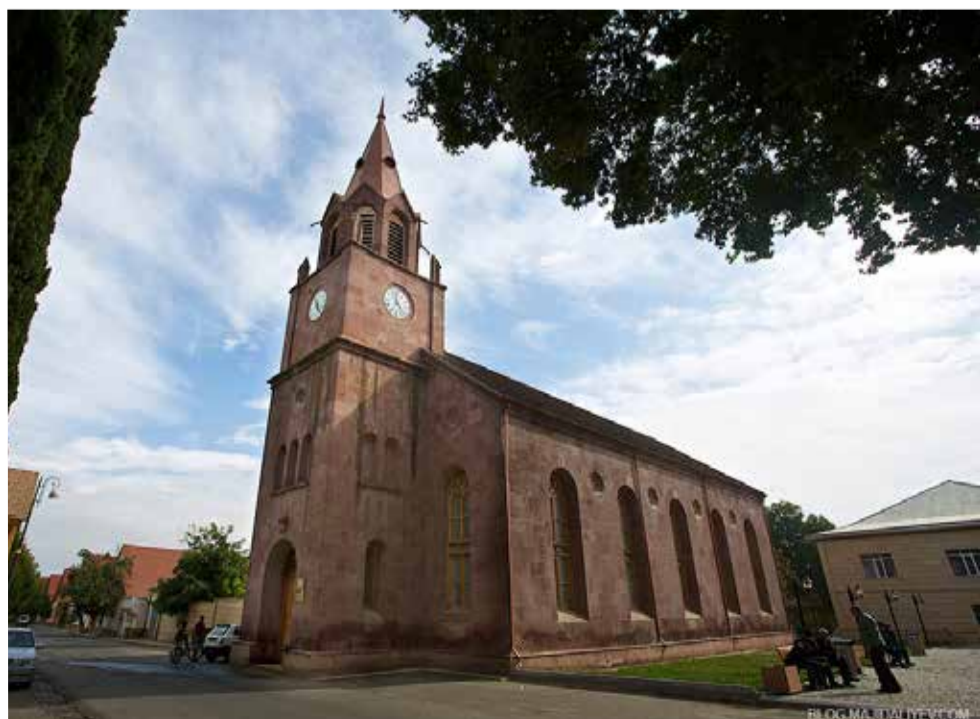
Здание бывшей лютеранской церкви в Гейгёле. Сегодня в здании размещается краеведческий музей