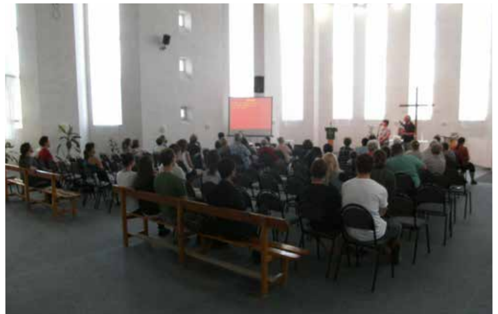
25 августа в церкви святой Марии собрались многочисленные гости на вечер общения