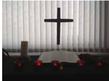
с. Азово Омской обл.

В День памяти и скорби, 28 августа, представители ев.-лют. общин совместно с представителями немецких культурных центров приняли участие в мероприятиях – молитвах у мемориалов жертвам политических репрессий и богослужениях в церквях – где вспоминали о депортации поволжских немцев в соответствии с Указом от 28 августа 1941 года.