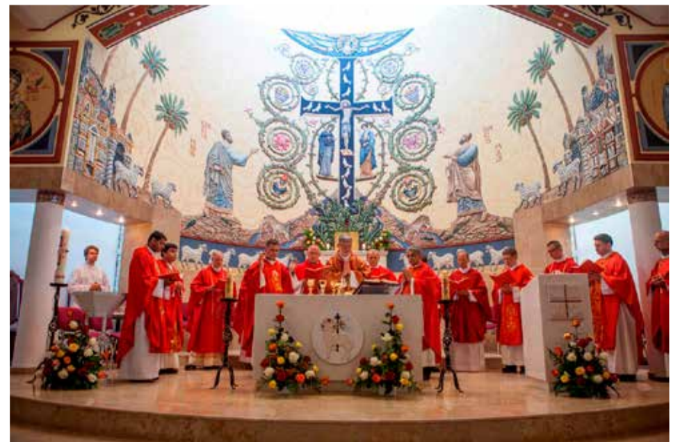
Вместе с епископом в мессе в честь освящения нового алтаря участвовали 16 священников

Митрополит Саратовский и Вольский Лонгин также посетил торжество и поздравил присутствующих. После окончания литургии гости и прихожане осмотрели роспись в алтарной части храма. Работа выполнена приглашенным мастером из Казани Олегом Шевелёвым. Художник с удовольствием согласился в будущем помочь и лютеранам в оформлении их церкви св. Марии. Торжество закончилось обедом на открытом воздухе. ■