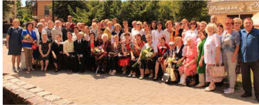
Община Черняховска и гости праздника

ЧЕРНЯХОВСК. 7 июля в евангелическо-лютеранской общине г. Черняховска (Калининградское пропство) прошли праздничные мероприятия, посвященные ее 25-летию юбилею.