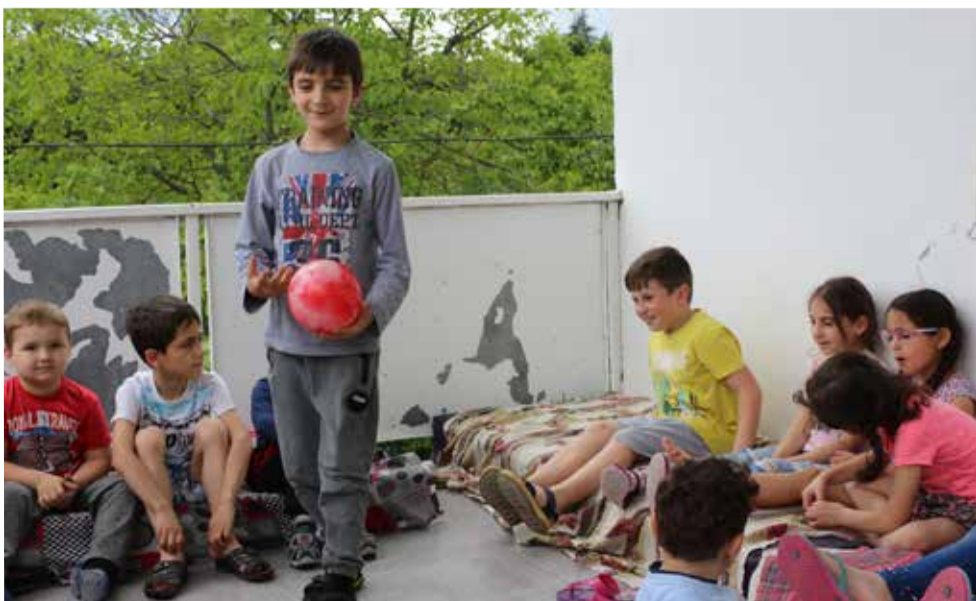
В лагере приняли участие 18 детей, самому младшему из которых не было еще двух лет, а старшей было девять лет...

Ласточкам надо успеть за лето построить гнездо, высидеть птенцов, вскормить их, научить летать и отпустить в самостоятельный полет. Так и нам надо успеть вырастить своих детей здоровыми, хорошими людьми и вложить в них знания и самые важные духовные истины прежде, чем они вылетят из гнезда и начнут самостоятельную жизнь. ■