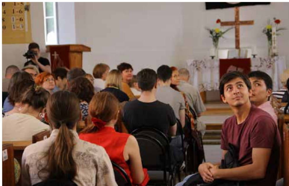
На концерте 28 августа

Выразительность музыки, трогательный переход от боли и скорби к надежде и утешению воспринимается не только рассудком, но, прежде всего, сердцем, открытым свету, и любящей, чистой душой. ■