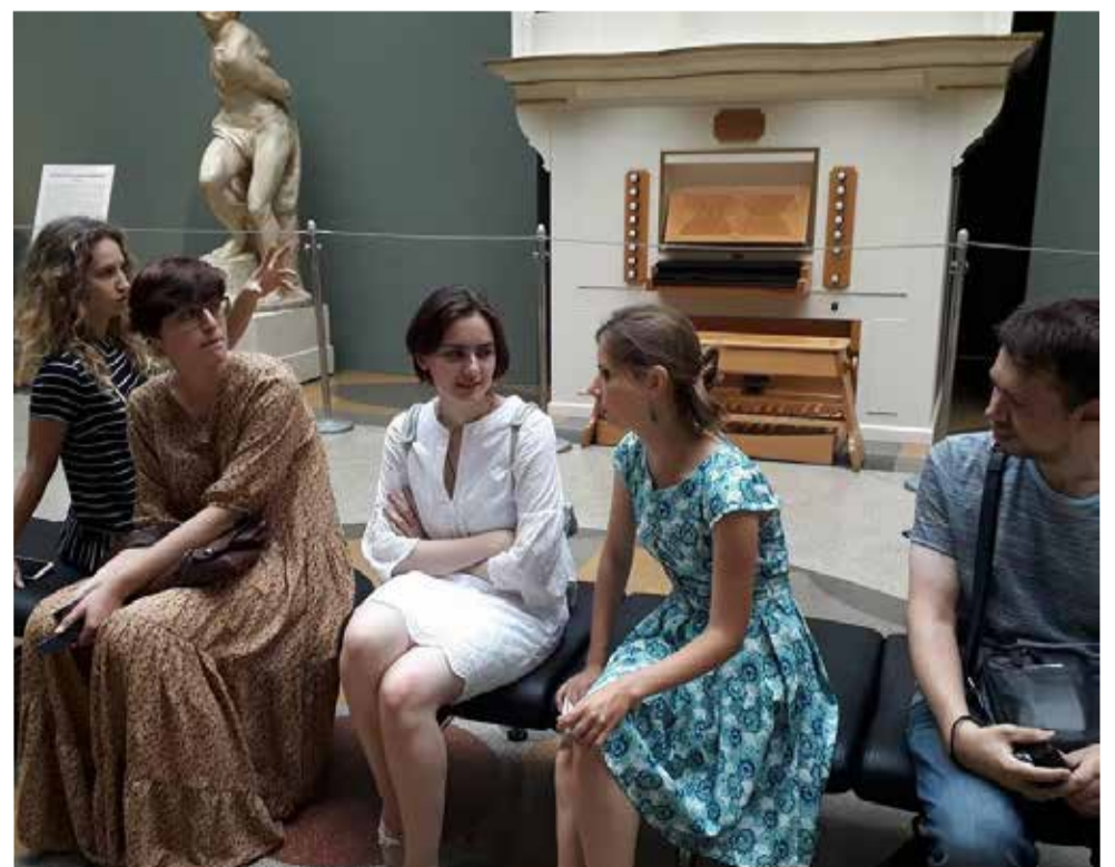
Молодежная группа в музее им. А.С. Пушкина

моих любимых голландцев на мои любимые ветхозаветные сюжеты и поучительные притчи. Вдобавок пройтись по полюбовившему сердцу парку Горького, радуясь погоде и восхищаясь Божьим творением». ■