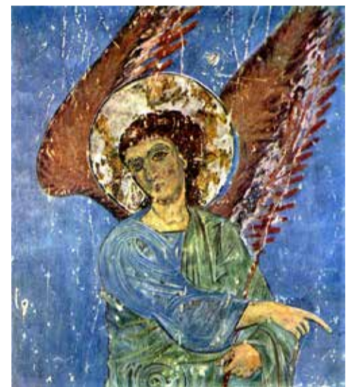
Фреска «Кинцвисский ангел»

Но, я думаю, всё гораздо проще. Мы хотели получить благословение, но что двигало нами в тот момент: праздное любопытство, жажда чуда или искреннее желание получить Божье благословение? Ведь всё зависит от нас самих: если мы хотим исцеления, духовного или физического, но при этом наша вера слаба, то вряд ли ожидаемое чудо свершится. Нас даже может постигнуть разочарование.