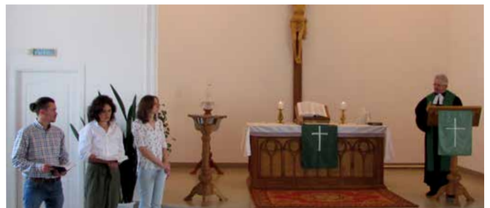
Конфирманты на богослужении 12 августа