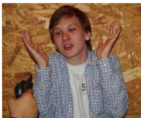
Каков он – настоящий детектив?...

Выражаю особую благодарность всем тем, кто организовал этот лагерь, указав каждому, от мала до велика, на Кого стоит возлагать все свои надежды. ■