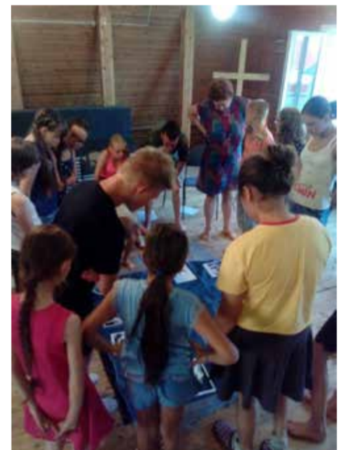
Каждый день дети изучали новый эпизод из жизни Иакова...

Это дало покой и надежду их душам. Надежду на то, что Бог рядом и защищает. Он благословляет на всю жизнь. ■