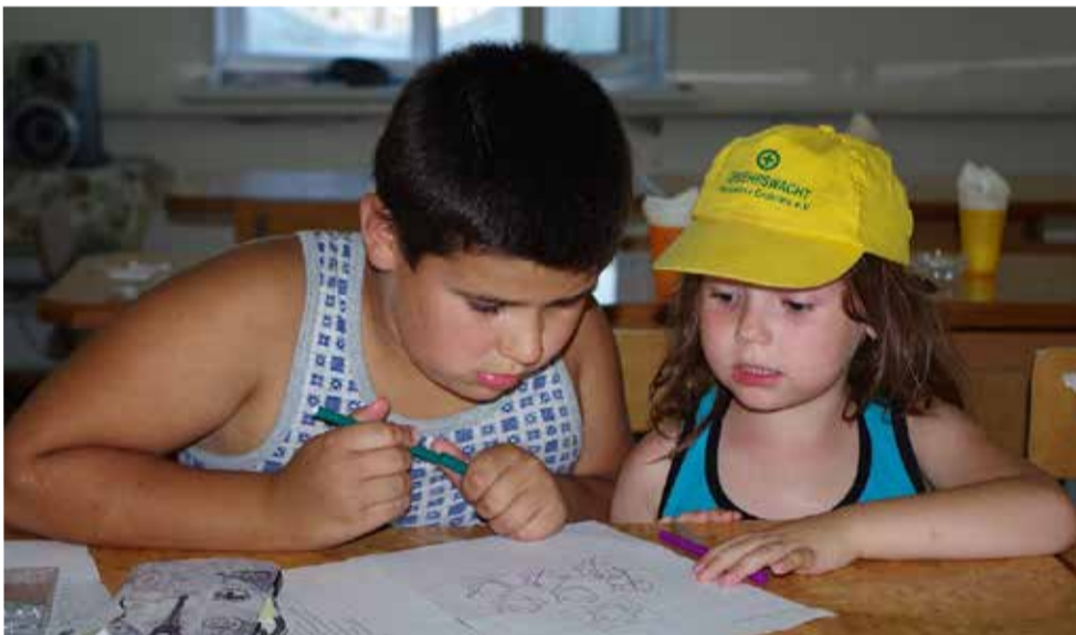
Ребята решали головоломки, задачки, квесты и даже устроили спортивную олимпиаду...