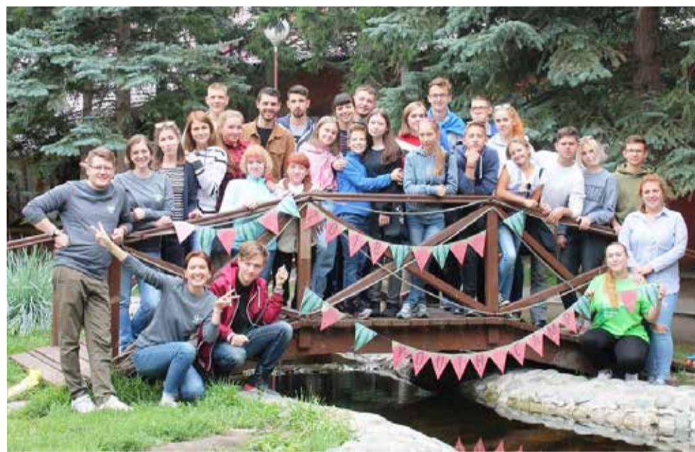
Участниками лагеря была молодежь из Омска и Омской области в возрасте от 14 до 25 лет