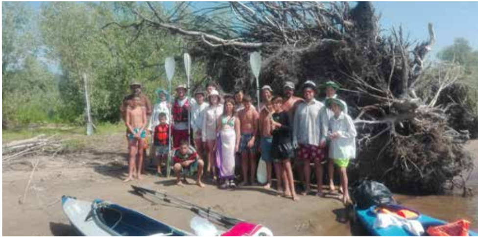
Стоянка участников похода

Ульяновск/Саратов. С 11 по 19 июля прошел байдарочный поход, организуемый ульяновской и саратовской общинами. В этом году впервые он начался с места проведения молитвенного лагеря – между с. Зольное и с. Солнечная поляна. В походе приняли участие 21 человек, из них – восемь из Саратова и 13 из Ульяновска. Впервые в походе было значительно больше мужчин (17 человек), чем женщин, которых было только четверо.