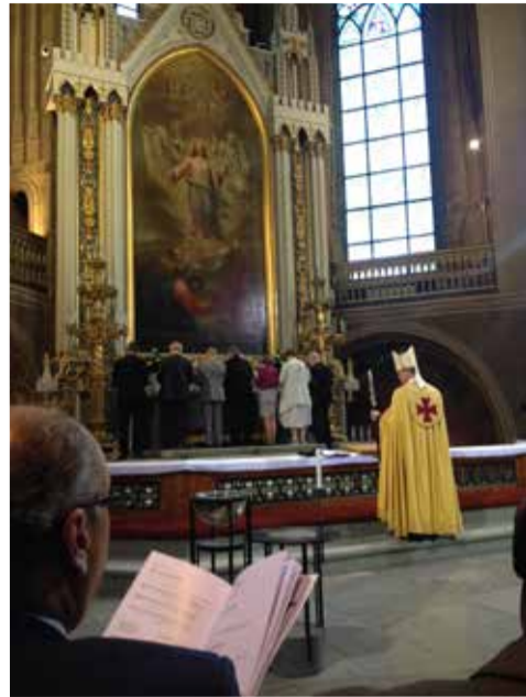
В средневековом соборе Турку

Для Евангелическо-Лютеранской Церкви России было большой радостью быть в числе приглашенных. В качестве представителя Архиепископа я ощутил сердечное общение во время богослужения, а также накануне, на официальном приеме в ратуше Турку. Большое впечатление произвели слова добрых пожеланий новому главе Церкви, и особенно мудрые наставления предшественника епископа