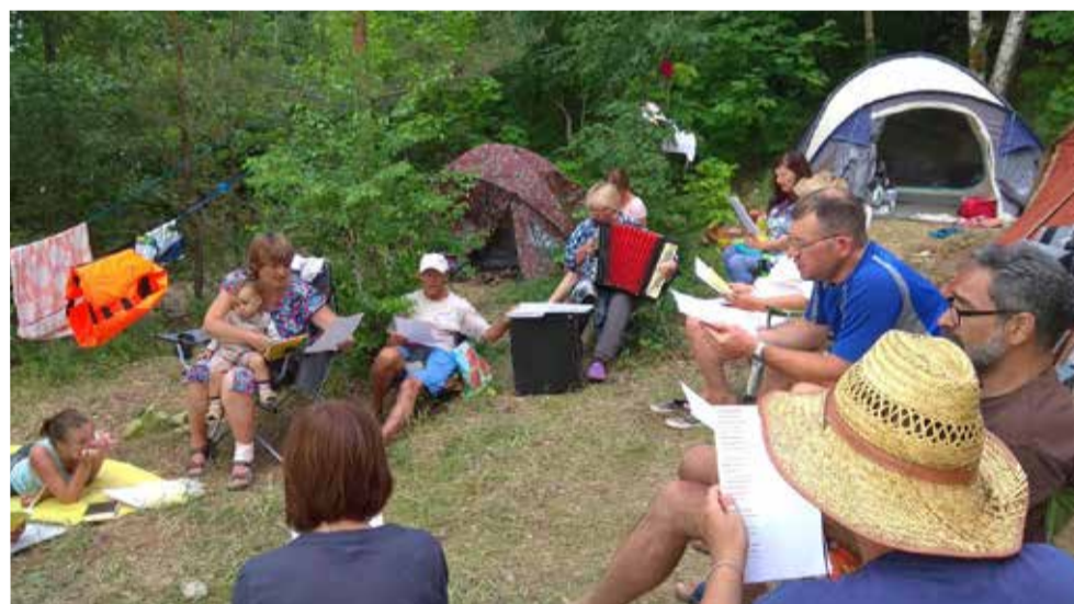
Музыкальная часть программы лагеря