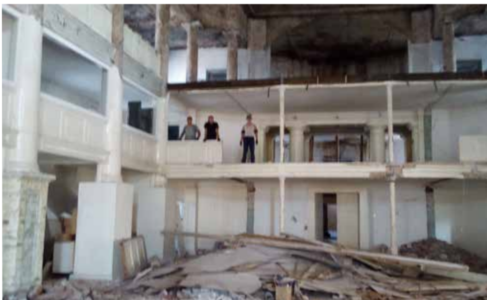
В церкви были полностью демонтированы лепные украшения из советского периода

В мае 2018 года строители приступили к внутренней реставрации здания. В течение летних месяцев была полностью демонтирована лепнина из советского периода, произведена прокладка системы электрического внутреннего освещения, а также оштукатурены колонны, стены и потолок. Кроме этого, осуществляется подготовка монтажа теплых полов. Прихожане благодарны всем помощникам за продолжение столь масштабных и дорогостоящих работ. ■