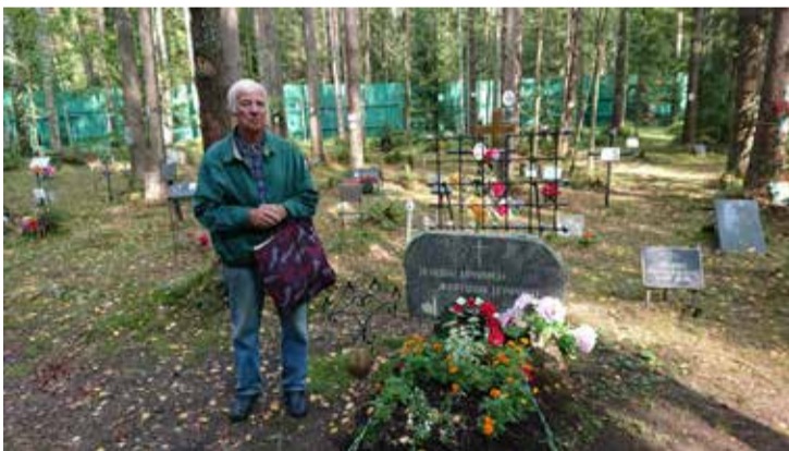
У латышского мемориала на Левашовском кладбище в Петербурге