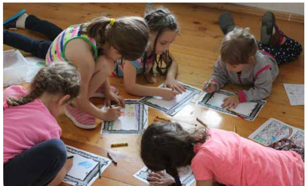
Мы попросили детей нарисовать семейные портреты в рамках...