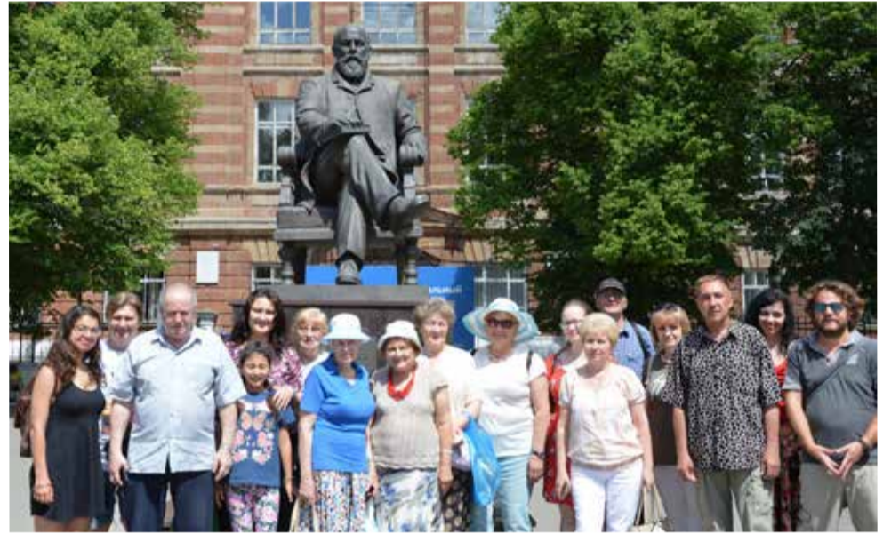
Группа из Казани у памятника Д.И. Стахееву в Елабуге

Много интересного, полезного и поучительного расскажут экспонаты, с любовью собранные сотрудниками музея. ■