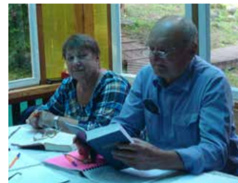
Несмотря на очень жаркую погоду, участники охотно проводили время «за партой»...