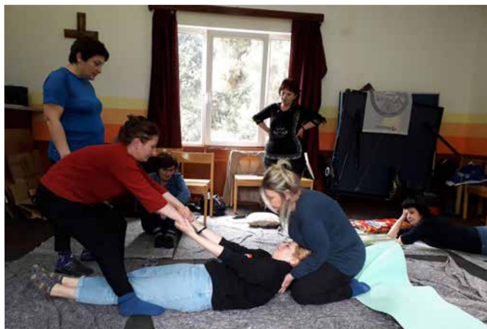
Диаконические работники на тренинге