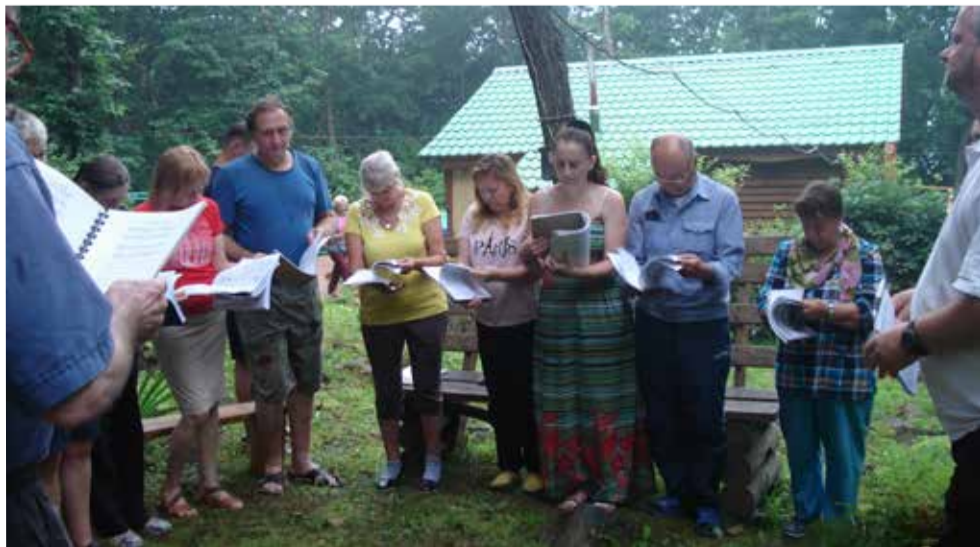
Люди, которые приезжают на семинар, представляют разные возрастные группы, различную степень вовлеченности в жизнь Церкви...

Последние говорили не только о тех «узких» темах, которые были заявлены в программе (женская и мужская работа,