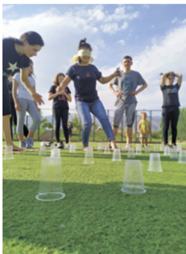
Молодежный лагерь на Иссык-Куле

На данный момент ситуация в стране стабилизируется. Блокпосты убрали, открылись места общественного пользования. Церкви вновь открыли свои двери, и в начале сентября нам удалось обвенчать молодую пару наших прихожан. ■