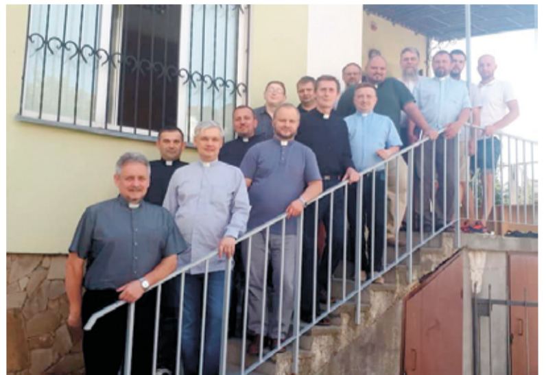
Участники лютеранско-реформатской конференции в Ивано-Франковске