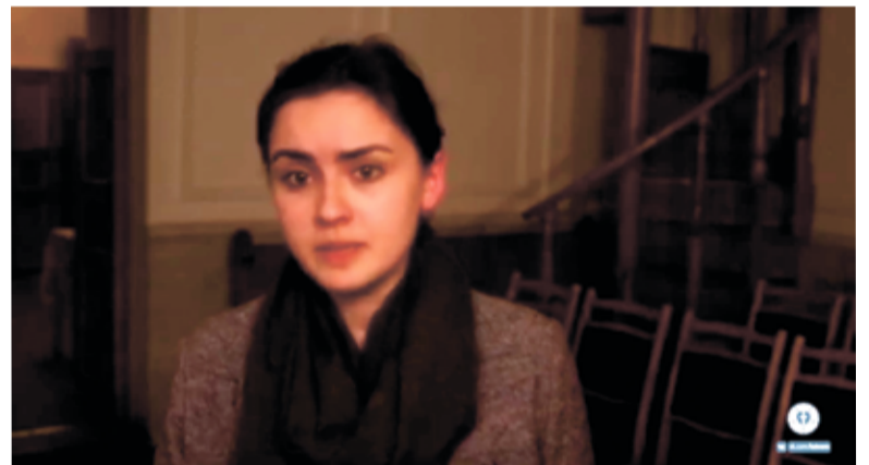
Кадр из фильма «Собор свв. Петра и Павла – 200 лет в Старосадском»

После завершения кратких вступительных приветствий программа продолжилась выступлениями актеров московских еврейских театров и просмотром документальных фильмов.