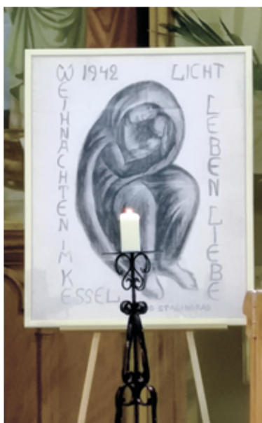
Освященная копия Сталинградской Мадонны в кафедральном соборе свв. Петра и Павла