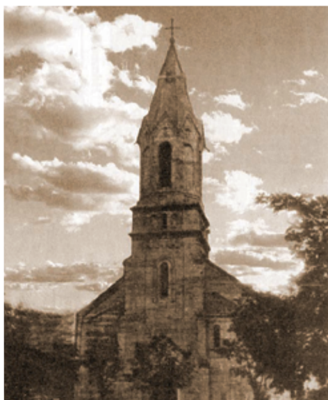
Церковь Спасителя в Асурети. 1925 год