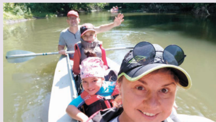
На байдарке по Свяге

Ульяновск. В этом году мы не изменили традиции нашей общины св. Марии и вновь организовали летом семейный байдарочный поход. Правда, в этот раз он был однодневным.