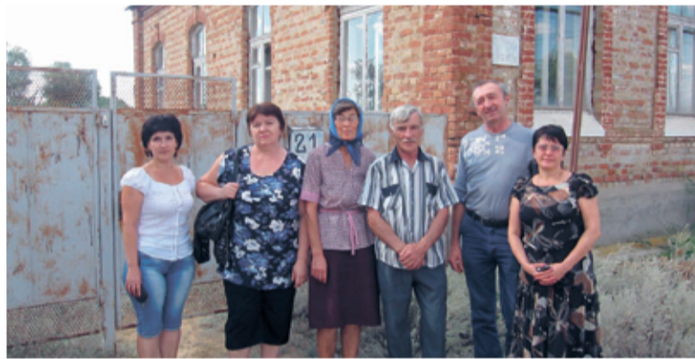
Прихожане лютеранской общины в Верхнем Еруслане