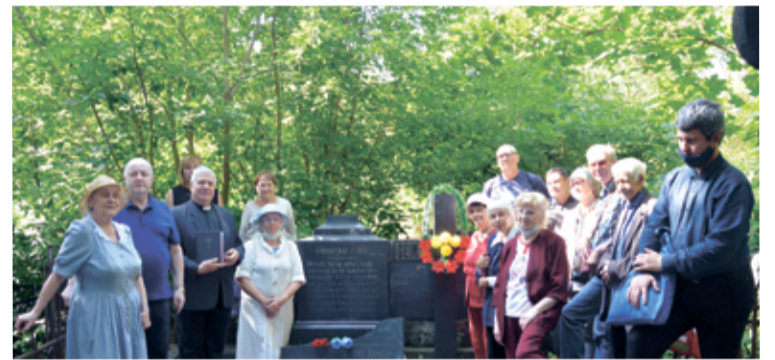
Участники памятного мероприятия на Арском кладбище

Затем пожилые члены немецкой общины Казани поделились воспоминаниями о перипетиях своих судеб и о лихой године. Были возложены цветы и зажжены свечи. После этого участники памятного мероприятия отправились в помещения кирхи св. Екатерины, где в Сиреновом зале было организовано чаепитие. ■