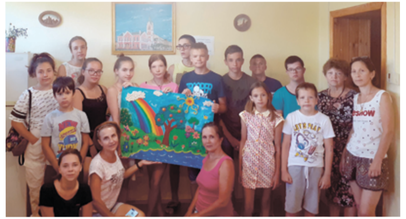
Необычным этим летом стало то, что в лагере были дети разного возраста, а также ребята с ограниченными возможностями здоровья вместе со здоровыми детьми...

В течение всей смены было организовано сбалансированное и очень вкусное питание,