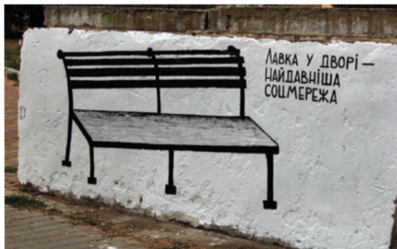
«Скамейка во дворе – старейшая социальная сеть». Одна из работ Гамлета Зиньковского в стиле стрит-арт на улицах Бердянска

«Киевский диалог» при поддержке Министерства иностранных дел Германии, организатор – Первое Антикафе Бердянска «Час е». ■