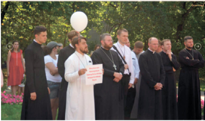
В это трудное время участники акции просили Бога о Беларуси. Они молились о мирном разрешении ситуации и освобождении невинно задержанных в стране...