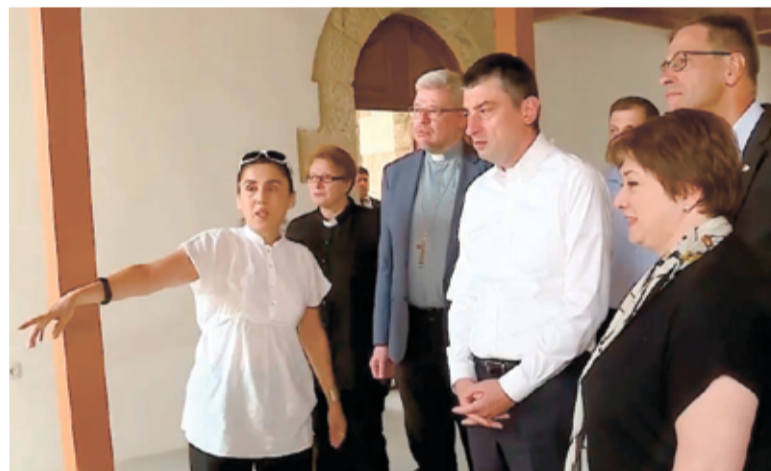
Делегация представителей власти страны и представителей ЕЛЦГ в отреставрированном помещении церкви Спасителя

По материалам сайта https://www.elkg.info