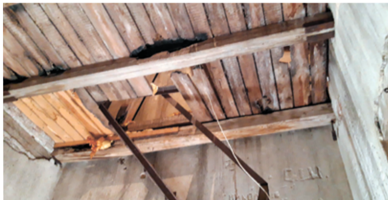
Опасный сгнивший пол звонницы препятствует даже нахождению внутри помещения

ведены следующие мероприятия по сохранению здания и территории кирхи: устройство отмостки периметра здания; остекление окон; устройство подъездной площадки и дорожек храма; устройство фасадной изгороди; ремонт кровли и кровельных конструкций и многие другие работы.