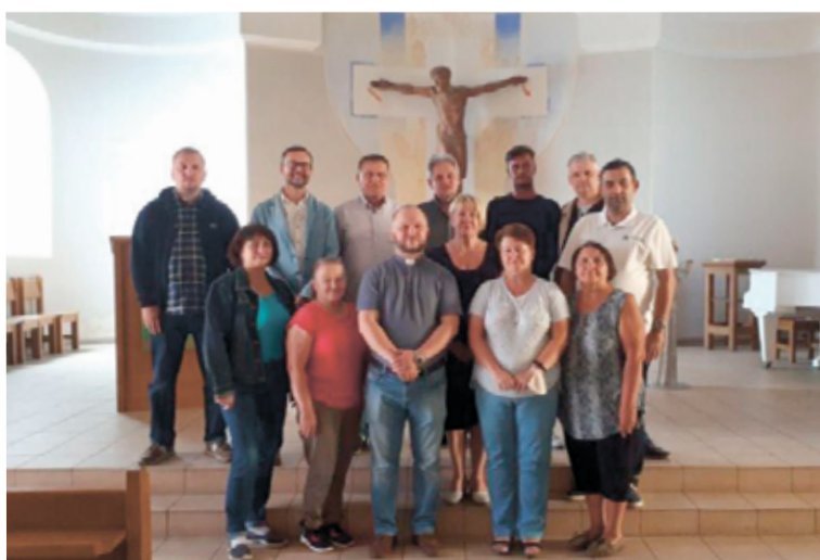
Участники семинара в церкви св. Екатерины