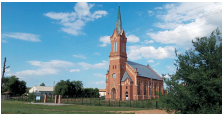
Кирха в Верхнем Еруслане

Верхний Еруслан. В 1859 году на богатом своим природным разнообразием левобережье Поволжья немецкие колонисты обосновали село Гнадентау (Верхний Еруслан). Многие постройки немцев Поволжья и по ныне украшают собой пейзажи села.