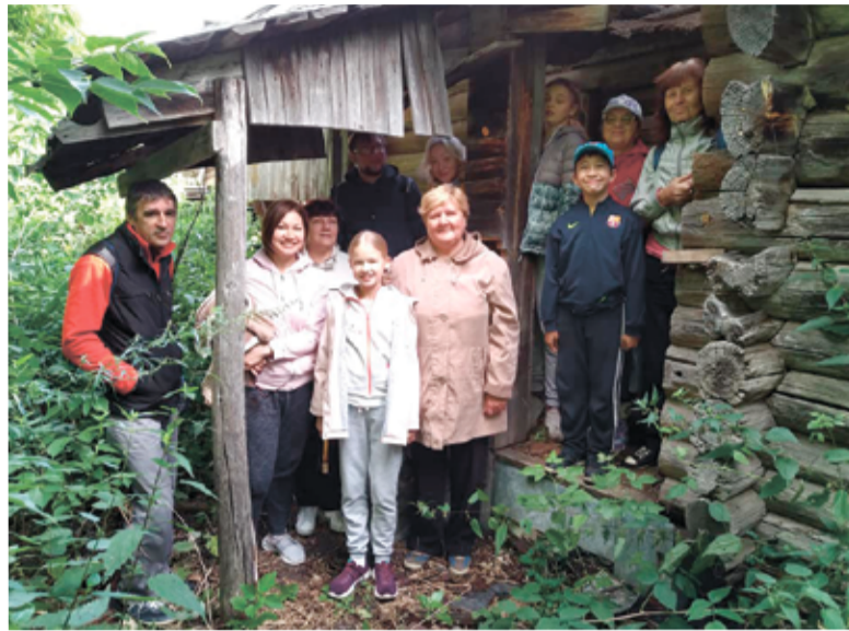
На крыльце дома Лейды

В течение нескольких лет мы думали о том, что наша община св. Марии когда-нибудь должна съездить в Светлое озеро, но всё никак не получалось это сделать. В этом году весной во время самоизоляции мы твердо решили и запланировали – летом едем точно!