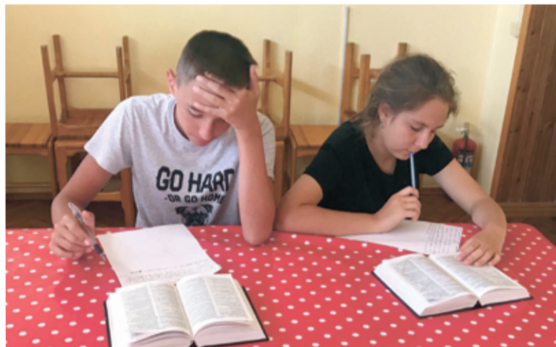
«Свобода – это возможность в любой момент взять Библию и прочесть ее»

ведь. Но мы хотим обозначить один очень интересный постулат: «свобода мысли ведет к действию!»