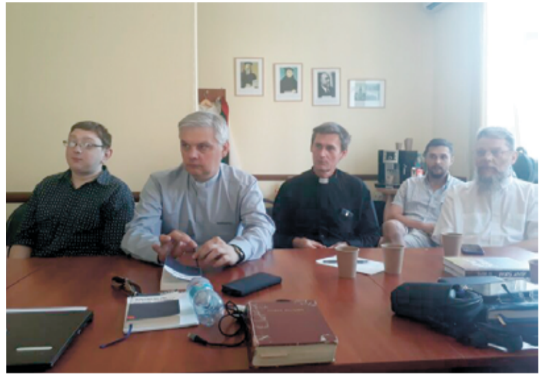
Время на конференции было особенным для всех участников...

По материалам сайта https://nelcu.org.ua