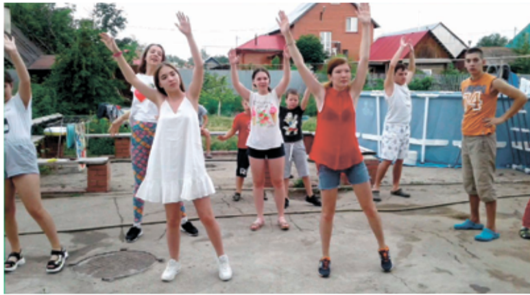
Утренняя зарядка проводилась под музыку на улице перед домом...

Ежедневно, сразу после завтрака, ребята читали Библию, дискутировали на различные темы («О сотворении мира», «Ной – строитель ковчега», «Иона, Божье предупреждение», «Бог – наш спаситель и защитник», «10 заповедей», «Дар Божий – жизнь вечная»), учили молитву «Отче наш» и «Символ веры», высказывали свое мнение по различным вопросам.