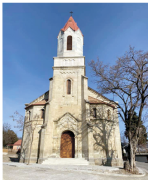
Церковь Спасителя в Асурети после реставрации

АСУРЕТИ. 10 июля епископ Евангелическо-Лютеранской Церкви в Грузии и на Южном Кавказе (ЕЛЦГ) Маркус Шох посетил отреставрированную лютеранскую церковь Спасителя в грузинском селе Асурети (р-н Тетрицкаро, регион Квемо-Картли) совместно с премьер-министром Грузии Георгием Гахария, с вице-премьером Грузии, министром регионального развития и инфраструктуры Грузии Майей Цкитишвили и послом Германии в Грузии Хубертом Книршем.