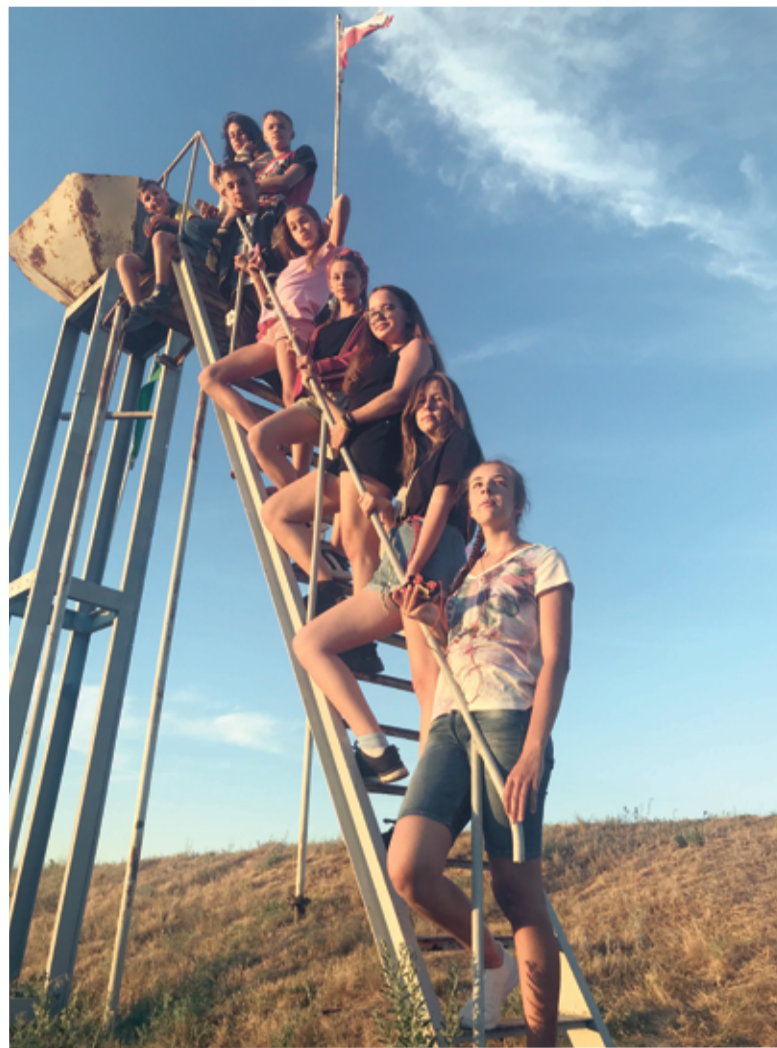
Ежегодный христианский лагерь в Красном Яру уже давно стал местом накопления силы, личностного развития и созидания для молодого поколения христиан Самарской области...

По каждому из этих пунктов можно написать отдельную проповедь.