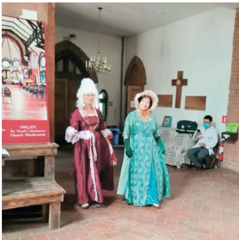
Участники смогли примерить исторический костюм

В третьей части программы участники смогли примерить понравившийся им исторический костюм и сделать в нем селфи. ■