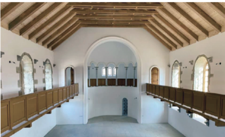
Интерьеры церкви Спасителя после реставрации