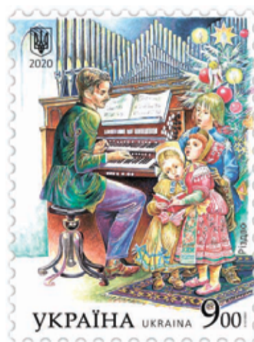
Почтовая миниатюра «Рождество» из серии «Национальные меньшинства в Украине. Немцы»

представлено четыре почтовых миниатюры: «Танец Штернполька», «Рождество», «В поле» и «Замок Шенборнов».