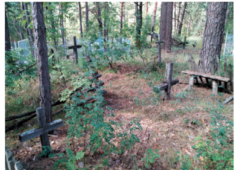
Эстонское лютеранское кладбище в с. Светлое озеро