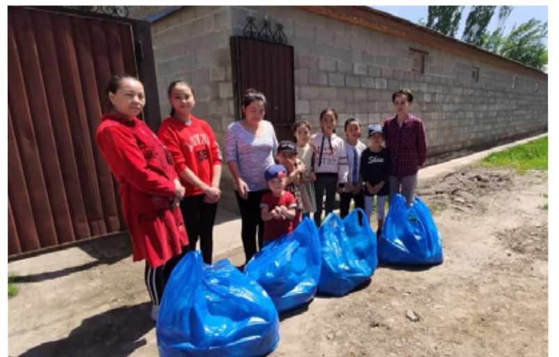
Около 300 семей получили продуктовые пакеты...