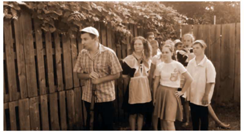
Кадр из фильма «Циркач». Реж. С. Андреев

«Сегодня мы предлагаем вам посмотреть фильм „Циркач“, снятый с участием этих молодых людей, – говорит она. – Наш экспериментальный театр называется „Встань и иди“... Мы так и сделали! Встали и пошли снимать наш первый короткометражный художественный фильм „Циркач“... Многого было впервые: первый фильм, первый рассказ, первые роли в кино, первая видеокамера (а, точнее, телефон) и первые бессонные ночи монтажа и озвучивания... Мы старались! Творчество наилучшим образом дает возможность проявить свой талант детям с разными особенностями и способностями. И, возможно, кто-то, посмотрев наш фильм, задумается перед тем, как нажать на курок своего оружия и, может быть, мы нашим фильмом спасем чью-то жизнь! Чудесным образом нам удалось в нашем фильме передать несколько мыслей: прежде, чем что-то сделать, нужно ответить себе на вопрос: „Зачем я это делаю?“. Любое убийство жестоко и бес-