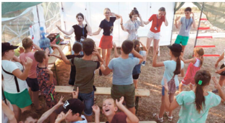
В течение пяти часов лагерного дня дети принимали участие в молитве, библейских занятиях, делали тематические поделки, играли на воздухе...

В течение пяти часов лагерного дня дети принимали участие в молитве, библейских занятиях, делали тематические поделки, играли на воздухе. Завершала день вечерняя программа. Всего в лагере приняли участие 26 детей и восемь сотрудников. ■