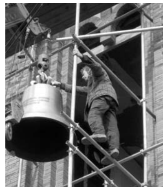
ПРОЦЕСС ПОДНЯТИЯ КОЛОКОЛА

Три колокола – это подарок фирмы Festo (Эсслинген, Германия) церкви св. Павла по случаю ее столетнего юбилея в минувшем году. На каждом из колоколов написано изречение из Библии на немецком и русском языках: «Бог нам прибежище и сила, скорый по-