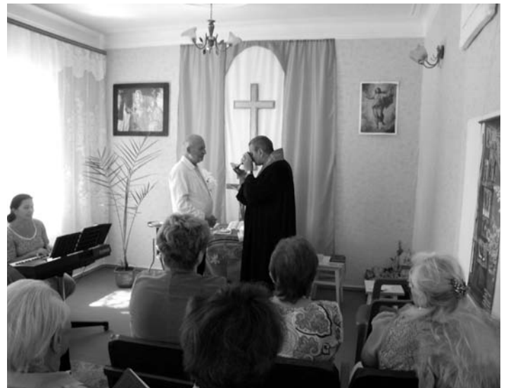
БОГОСЛУЖЕНИЕ В НОВОМ ДОМЕ