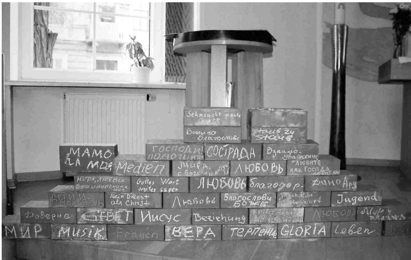
«КИРПИЧКИ» ДЛЯ СОЗИДАНИЯ ЦЕРКВИ НА СИНОДЕ НЕЛЦУ В ОДЕССЕ