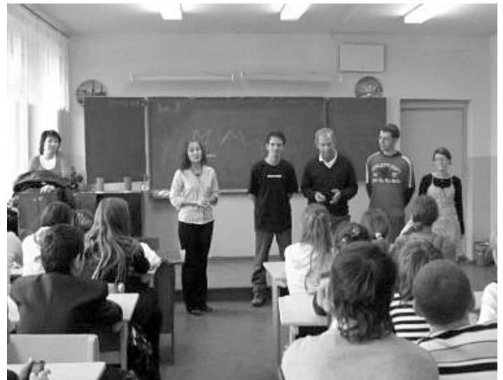
НАШИ УЧИТЕЛЯ ПРОПОВЕДОВАЛИ ОБ ОПРАВДАНИИ И УВЕРЕННОСТИ В СПАСЕНИИ