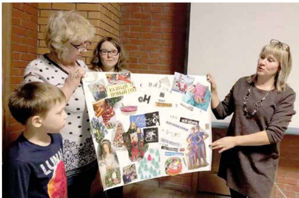
Все с удовольствием участвовали в различных конкурсах...