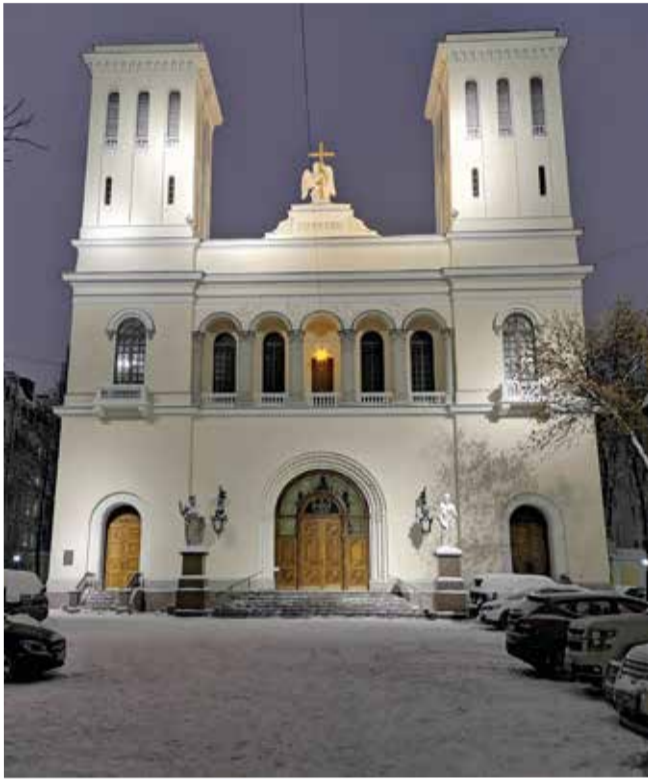
Сегодня здание Петрикирхе действительно «радует глаз»...

Руководство Евангелическо-Лютеранской Церкви России сердечно благодарит всех помощников, внесших такой неоценимый вклад в реставрацию самого большого на территории России евангелическо-лютеранского храма. Особая благодарность правительству Санкт-Петербурга и Комитету по охране памятников за поддержку в реставрации Петрикирхе! ■