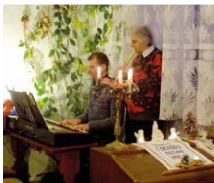
Бердянск (Запорожская обл.)