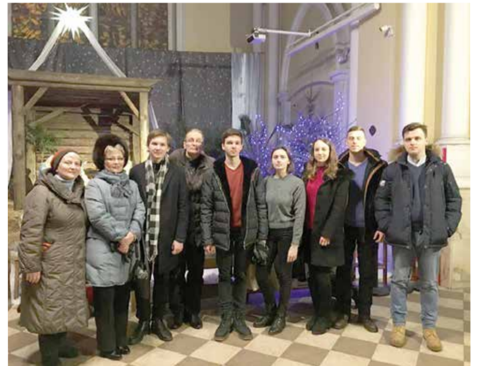
Прихожане из лютеранского собора свв. Петра и Павла в католическом соборе Непорочного зачатия