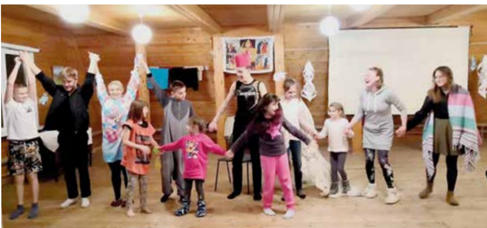
Дети и взрослые дали современную трактовку книге «Есфирь»...

Если вы хотите получить ответы на волнующие вас вопросы веры, приобрести новый духовный опыт, мы ждем вас! ■