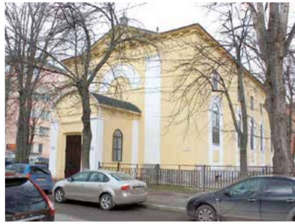
Церковь свв. Петра и Павла в Ярославле

ЯРОСЛАВЛЬ. 19 декабря на заседании муниципалитета Ярославля депутаты приняли решение передать в собственность ев.-лют. общине в Ярославле здание церкви свв. Петра и Павла, а также прилегающий к ней участок.