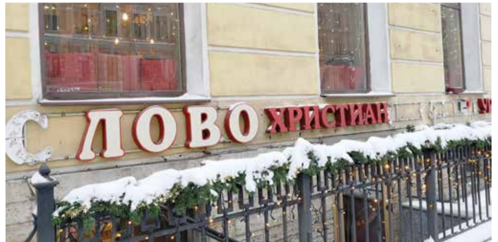
Так выглядела вывеска магазина после совершенного акта вандализма

При этом с самого начала своего существования и по сей день «Слово» является магазином межконфессиональным, предлагая покупателям литературу различных направлений христианства. В этом заключается его уникальность. Это сделало книжный магазин популярным не только в городе, но и далеко за его пределами, поскольку он работает также в формате «Книга-почтой».