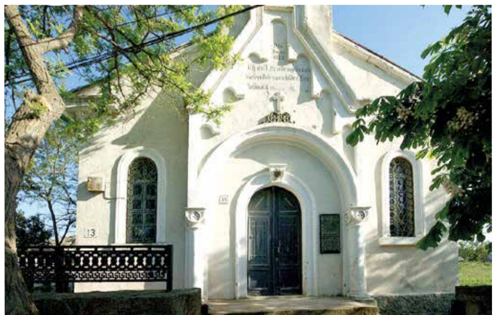
Кирха в Судаке построена в 1887 году. В советское время в ней располагался клуб