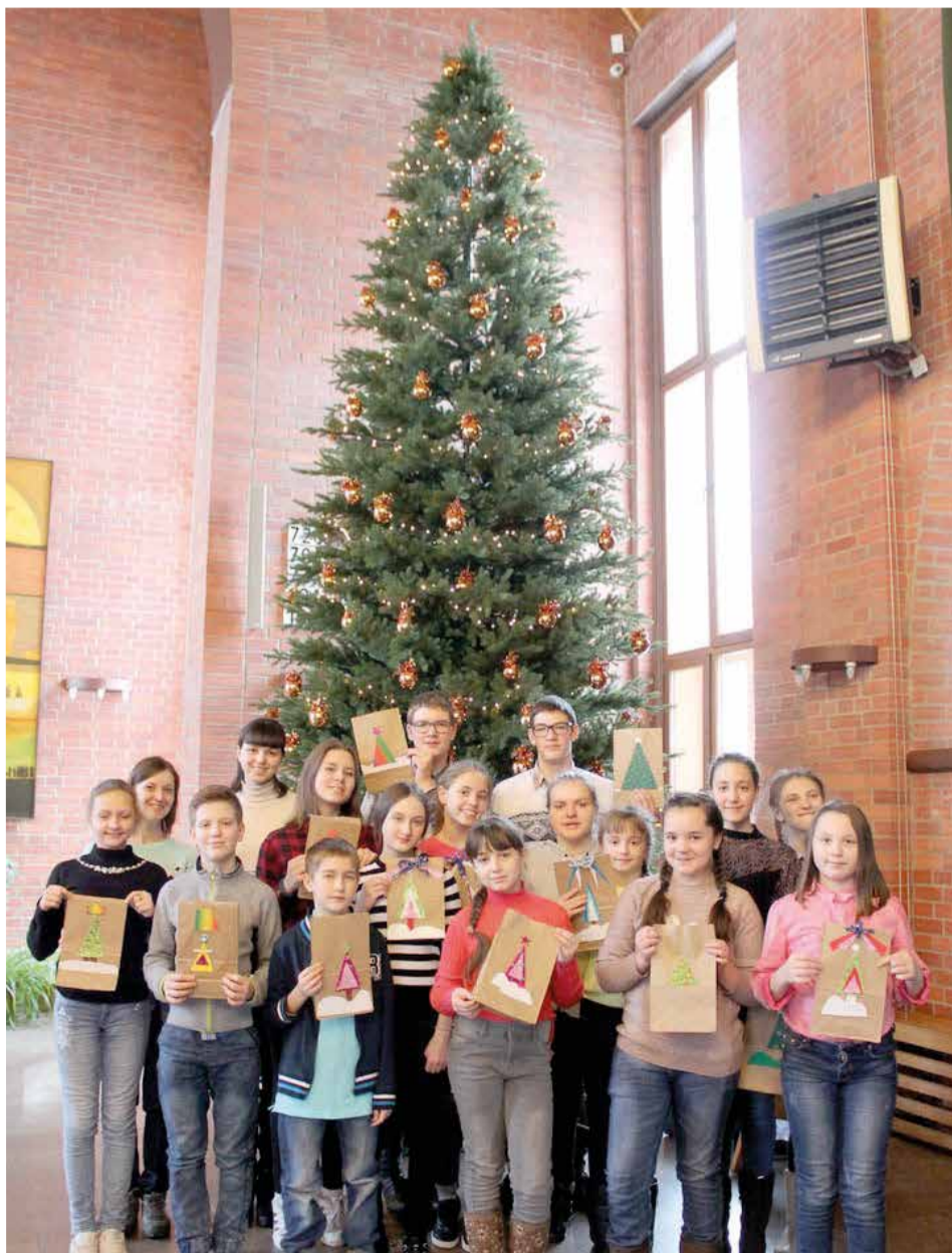
Праздник «Елки-квест» для подростков пропства Западной Сибири

Желаем всем благословенного нового года! ■