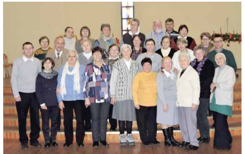
Участники Диаконического дня в церкви Воскресения

Помощь и служение ближним – не простая, но очень важная задача. И хорошо, когда для ее решения есть много помощников. ■