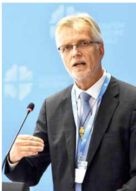
Генеральный секретарь ВЛФ Мартин Юнге