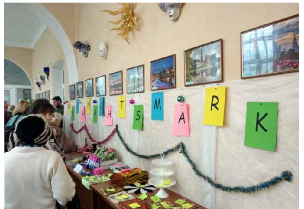
На ярмарке можно было приобрести и домашние кулинарные шедевры, и винтажную бижутерию, и елочные украшения, а также шитье, вязание и даже мед в сотах...