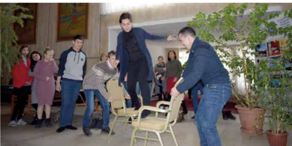
Игры на встрече

Подобные встречи помогают почувствовать тем, кто занимается служением, что они не одни и не только у них возникают те или иные трудности. Вместе с такими же лидерами и координаторами намного легче искать выход из них, появляется больше идей и приходит вдохновение от совместных молитв друг о друге и о служении, которое было доверено им Богом и Церковью. ■