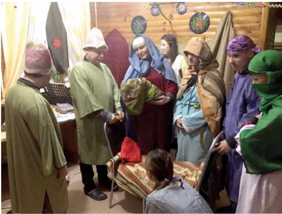
Празднование Рождества-2018 в деревне Исток организовано, по традиции, ев.-лют. общиной Шелехова