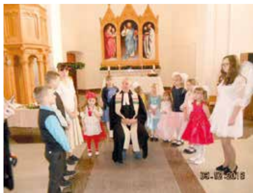
Зоркино (Саратовская обл.)