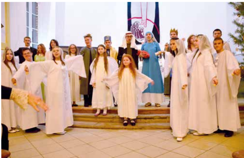
Спектакль «Рождение Чуда» в церкви св. Георга в Сочельник