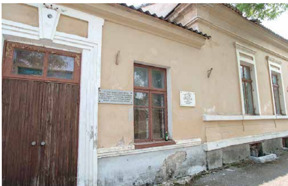
Здание лютеранской церкви в Евпатории постепенно разрушается

По материалам группы «Общины Евангелическо-лютеранской Церкви в Крыму» на Facebook