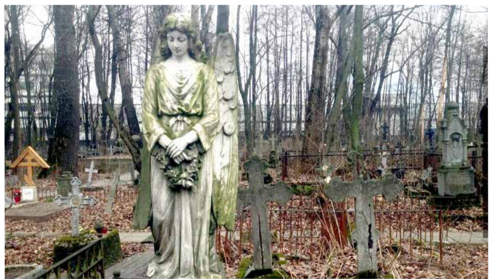
Смоленское лютеранское кладбище

САНКТ-ПЕТЕРБУРГ. Смоленское лютеранское кладбище стало памятником регионального значения. Его включили в единый государственный реестр в качестве объекта культурного наследия, сообщает КГИОП. Информация об этом появилась в петербургских СМИ 17 декабря.