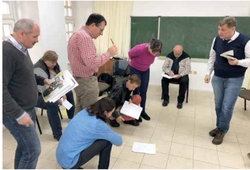
Занятия на семинаре в помещениях общины Волгограда в октябре 2018 года