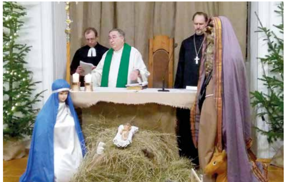
Священнослужители трех конфессий на богослужении 23 января в томском католическом кафедральном соборе св. Петра

Христиане разных конфессий собираются в молитве, чтобы возрастать в единстве. Они делают это в мире, где коррупция, жадность, несправедливость способствуют неравенству и разделению. Их молитва – молитва единения в разрушенном мире, поэтому она является настолько необходимой. ■