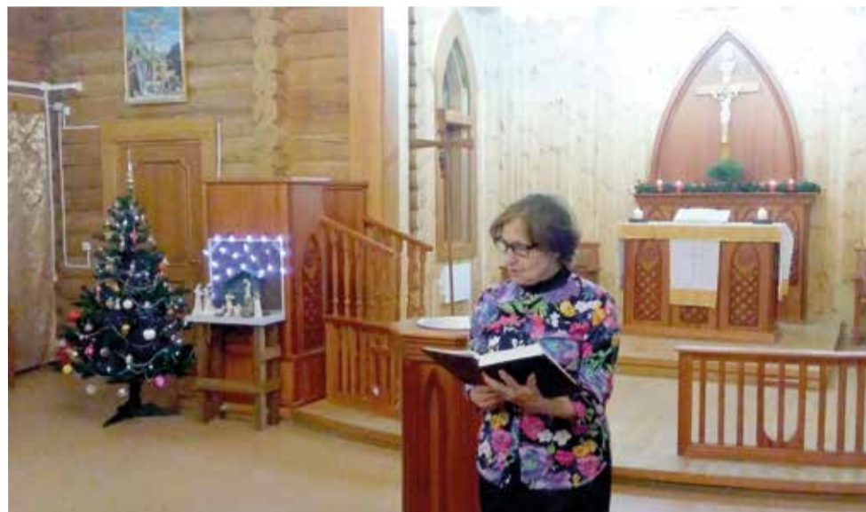
Предновогоднее богослужение в общине Томска

Так было и в этом году. Люди приходят в церковь вовсе не от одиночества, а потому что им хочется встретить Новый год с Богом. Ведь как новый день мы начинаем с молитвы, так и новый год знаменательно начинать с общения с Богом.