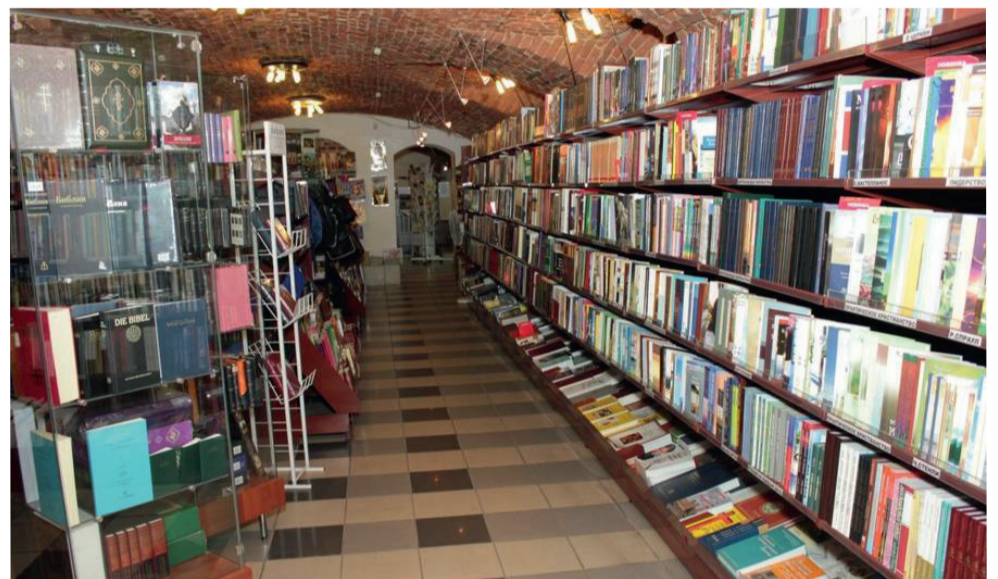
Войдя в магазин, сразу же понимаешь, почему это место столь популярно среди горожан и гостей нашего города, интересующихся книгами о христианстве...