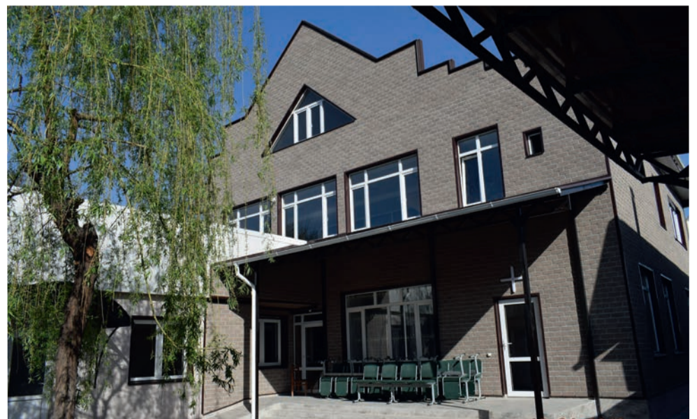
Во дворе нового молитвенного дома