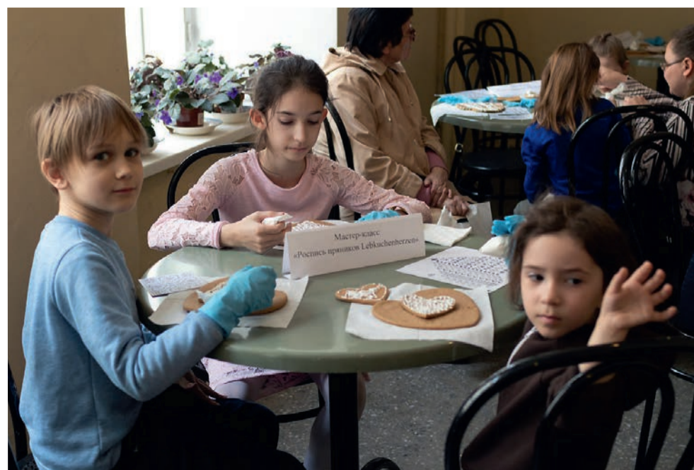
На маленьких пряниках-сердечках дети тренировались и сразу могли попробовать их на вкус или забрать их домой...

Это мероприятие показало, как важно знать и поддерживать отношения с соседями – другими христианскими общинами: как много можно делать вместе, как интересно можно проводить время, как можно дружить и как это здорово! ■