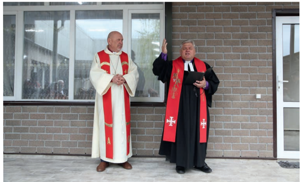
Освящение молитвенного дома: Архиепископ Юрий Новгородов (слева) и епископ Альфред Айхгольц

E-mail: medien@elkras.ru, bote@elkras.ru