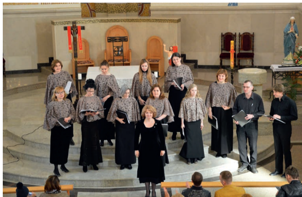
Вокальная группа "Freude" на фестивале «Свет Христов» в католической церкви «Воздвижение Святого Креста»