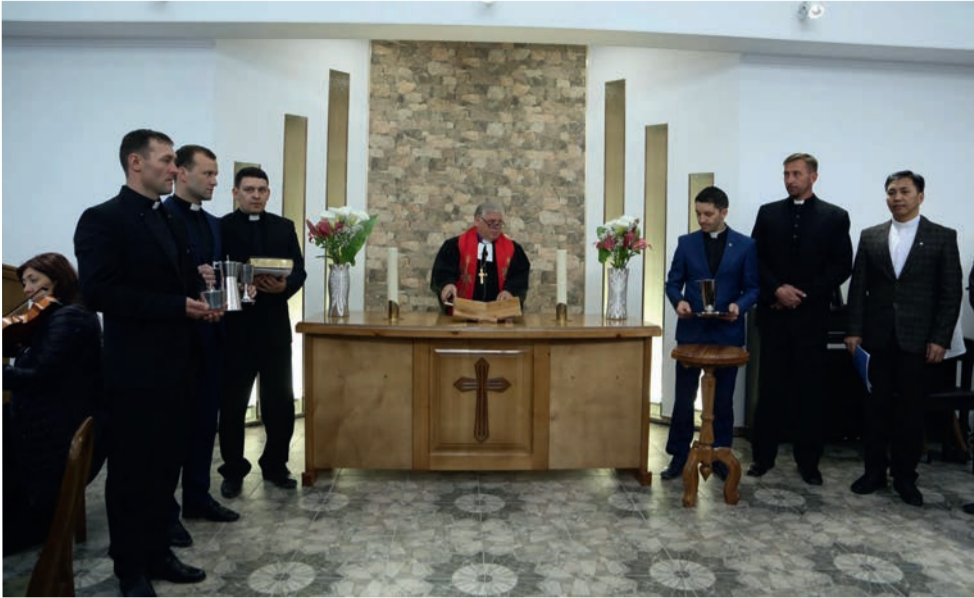
Служители ЕЛЦКР на торжественном богослужении 8 апреля

«Возрождение из пепла». Продолжение. Начало на с. 1