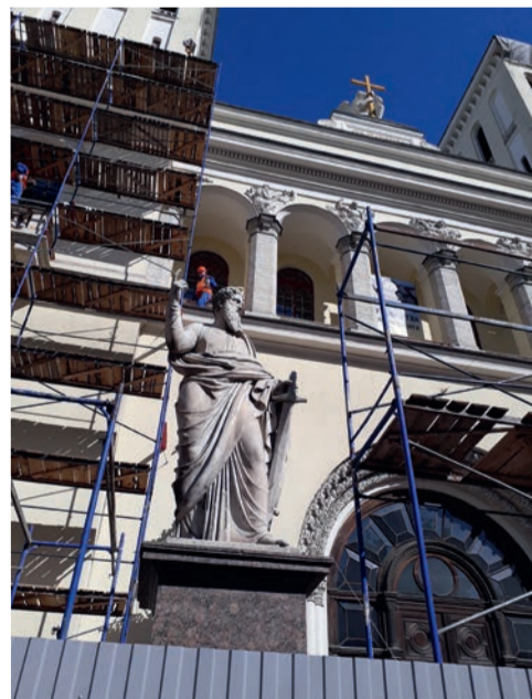
За три недели обе башни «оделись» в леса...

В проекте реставрации, подготовленном в 2017 году ООО «Научно-проектный реставрационный центр» на средства, собранные Евангелическо-Лютеранской