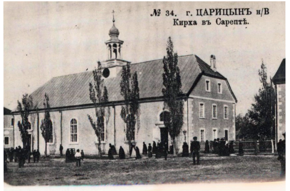
Кирха в Старой Сарепте. Историческое фото

Под сердцем мамы находился живой «комочек», который постоянно напоминал о себе и давал надежду и силы жить. Этим «комочком» была я. Родившись в апреле 1942 года, я спасла маму от трудармии, а она сберегла меня от смерти. Мама рассказывала, что, когда баржа отходила от затона, лютеране спонтанно запели хорал, который часто пели на церковной службе "Jesu, geh