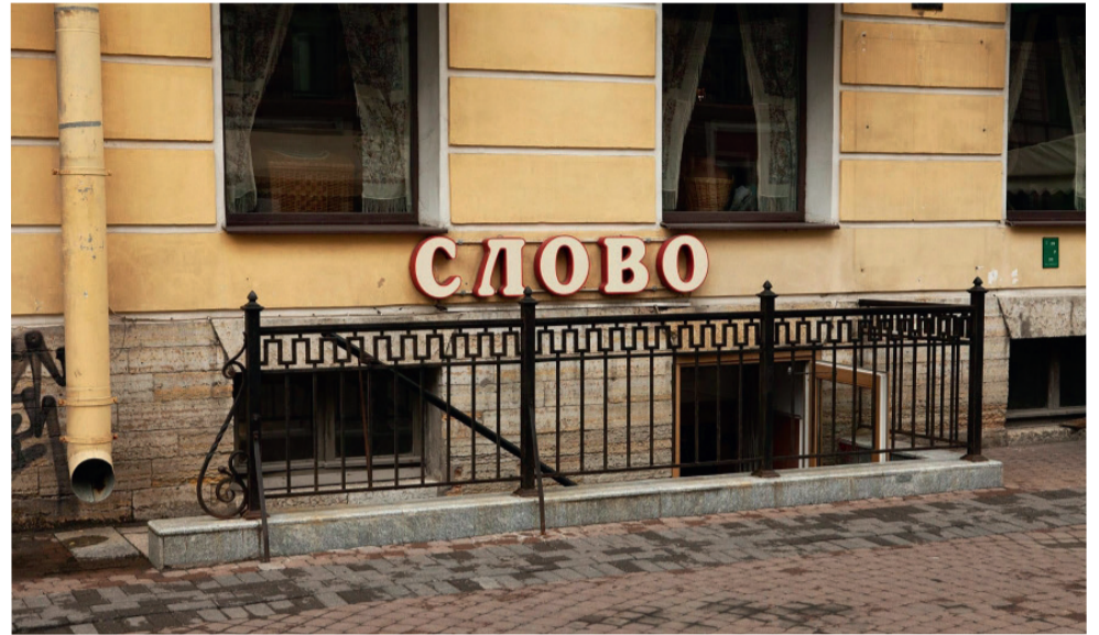
Спускаешься в подвал на Малой Конюшенной, 9 – и оказываешься в чудесном мире тихой высшей мудрости...