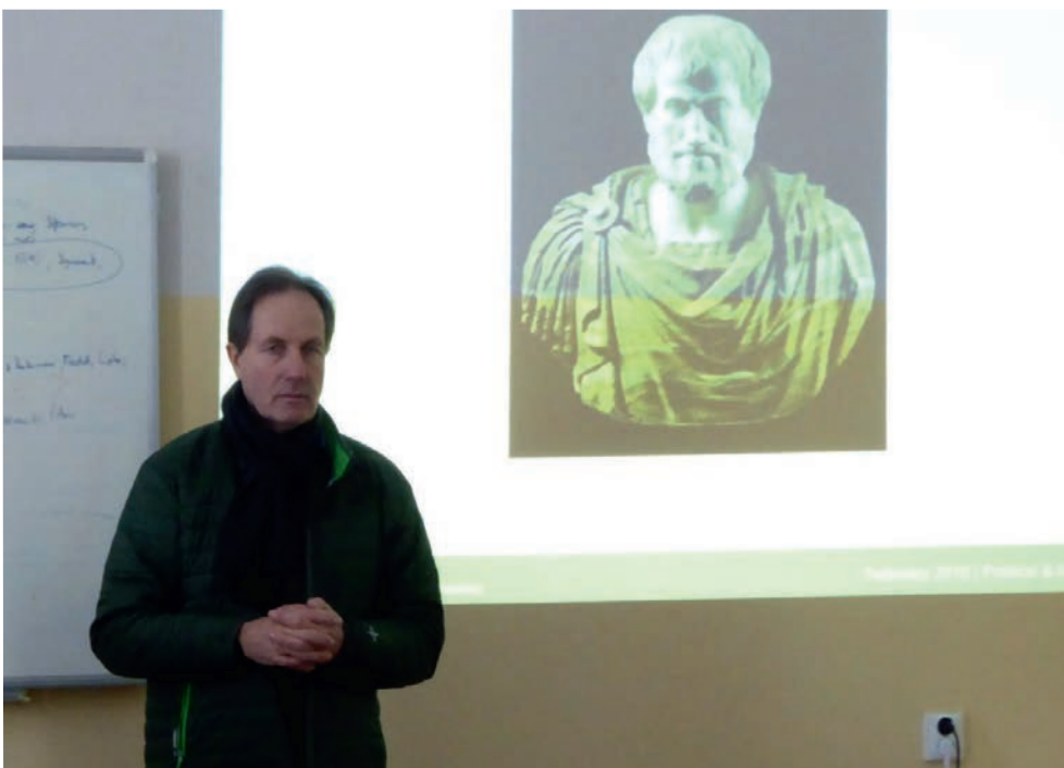
Особо ценным был контекст десяти основных вопросов, предложенный Хартвигом фон Шубертом: от рассмотрения идей Платона и Аристотеля о идеальном государстве и правлении до соотношения морали, веры и политики в учении Канта...

Предложенный независимый и авторский взгляд, вариативные подходы к изучению этих сложных тем сформировали серьезное проблемное поле религиозных контекстов в политике. Это может быть показателем эффективности проведения такого типа обсуждений и семинаров для формирования рефлексивного и критического мышления у современного религиозного сообщества, заинтересованного в духовном развитии, а также у тех, кто таковой путь отрицает. К числу последних, например, стоит отнести тех представителей различных общественных кругов и инициатив, которые причисляют деятельность Церкви к строго определенному императиву, в сферу которого политика никак не вписывается. Прошедшие курсы продемонстрировали, что обсуждение темы «Церковь. Политика. Война» во многом может являться индикатором оформления зрелого религиозного самосознания – как на уровне конфессионального контекста, так и сообщества в целом. ■