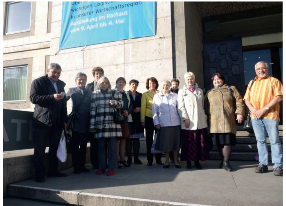
Группа из Самарского пропства перед зданием ратуши в Штутгарте