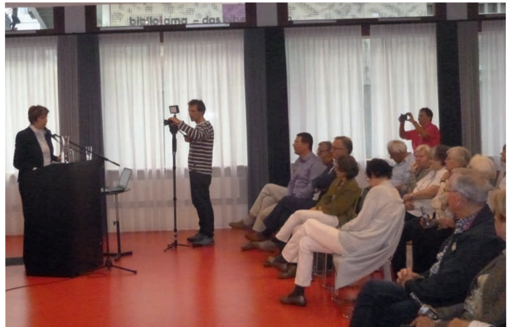
Встреча с представителями Фонда Густава Адольфа