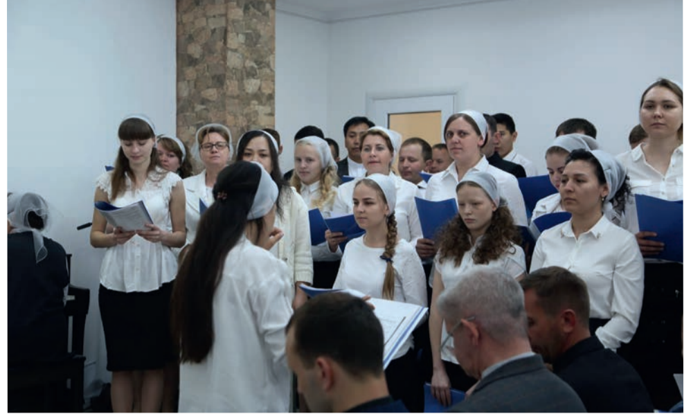
На богослужении пел сводный хор ЕЛЦКР (более 50 человек)...

здание церкви распахнуло свои двери. Это событие стало грандиозным для каждого прихожанина. Люди радовались и поздравляли друг друга с праздником. Всюду раздавалось приветствие: «Христос воскрес!», и в этот воскресный день пасхальной недели оно приобретало особый смысл.