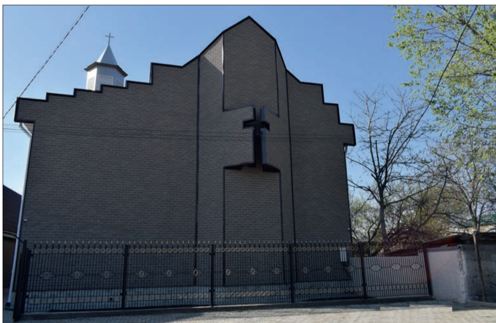
Новый молитвенный дом в Бишкеке был построен на месте прежнего, сгоревшего в январе 2015 года