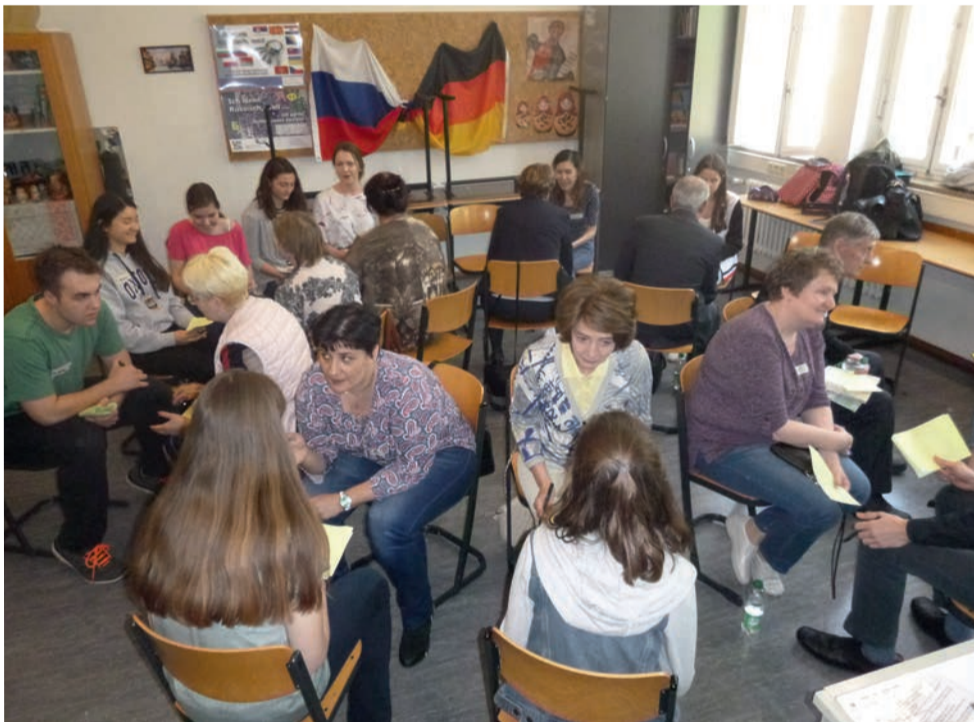
Дискуссия на русском языке между гостями и учениками гимназии им. Лейбница

В ходе поездки участники смогли убедиться, что Германию и Россию объединяет не только общая история, которая была полна как радостными, так и драматическими событиями, но и много общего в менталитете и отношении к жизни. ■