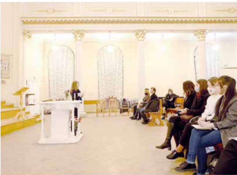
22 апреля в церкви св. Екатерины состоялась долгожданная встреча с представителями КГИОП и группой студентов...

По материалам интернет-сообщества vk.com/smolenskoeffriedhofsrb