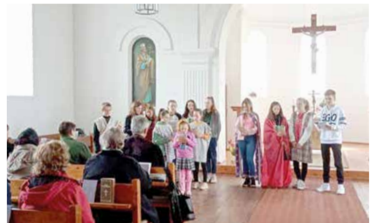
Пасхальная сценка детского хора