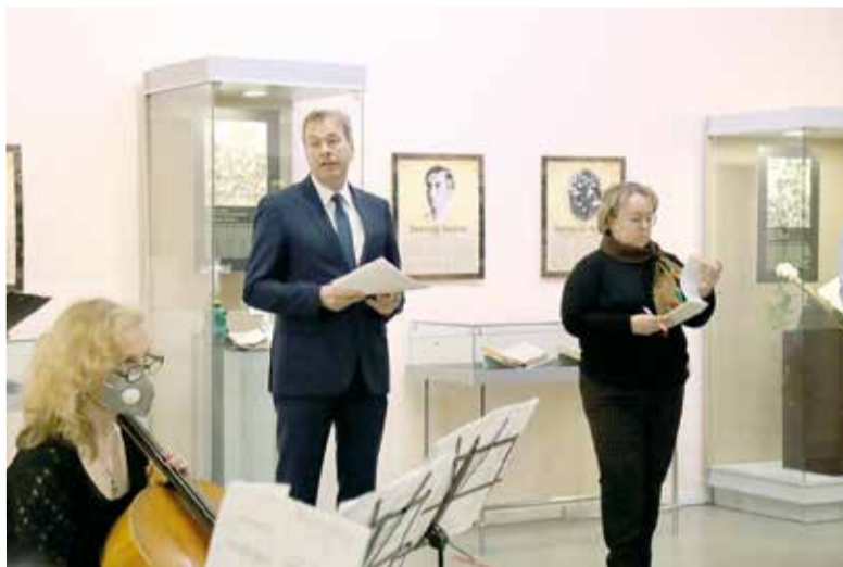
Приветственное слово генерального консула ФРГ Бернда Финке на открытии выставки