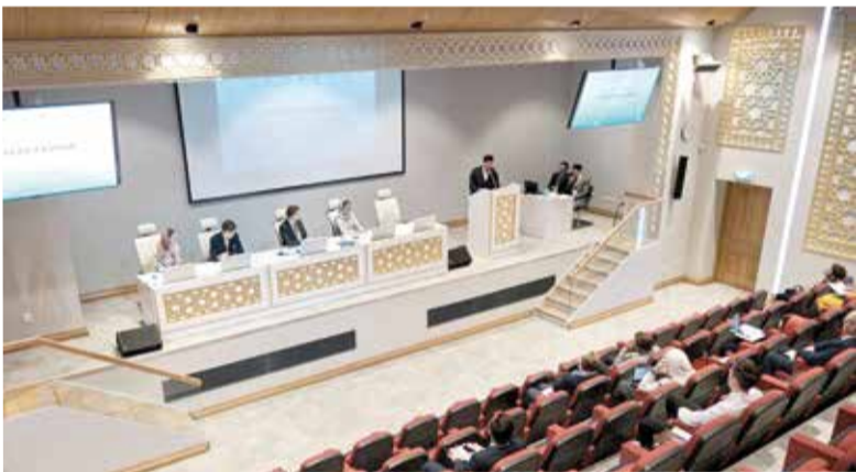
Форум состоялся в конференц-зале Московской соборной мечети...

Форум продолжился в рамках двух секций: «Диалог религий 2.0: молодежный взгляд» и «Религия, духовность, ценности в молодежной культуре». С докладами выступили молодые представители мусульманского сообщества, Римско-Католической Церкви, Евангелическо-Лютеранской Церкви Европейской части России, движения Фоколяров, Иисуса Христа последних дней (мормонов), православный блогер, ученые и аспиранты МГИМО, НИУ ВШЭ, РРГУ и другие. ■