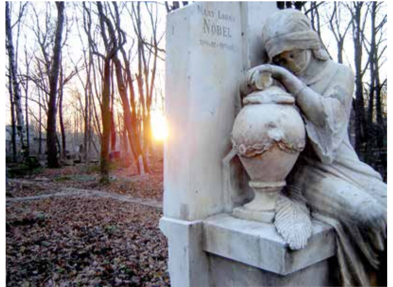
Смоленское лютеранское кладбище: тысячи известнейших и поистине великих имен. И всего десятки сохранившихся ныне полуразрушенных надгробий...

22 апреля в церкви св. Екатерины состоялась долгожданная встреча с представителями КГИОП и группой студентов – авторов проекта по восстановлению склепа семьи Бёкманн. Участники встречи затронули все аспекты охраны кладбища, реставрации надгробий и ухода за ними, работы и ответственности всех, имеющих к этому отношению.