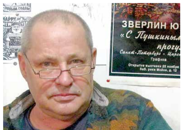
Автор картины – петербургский художник Юрий Зверлин