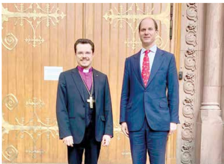
Архиепископ Дитрих Брауэр (слева) и герцог Константин Ольденбургский