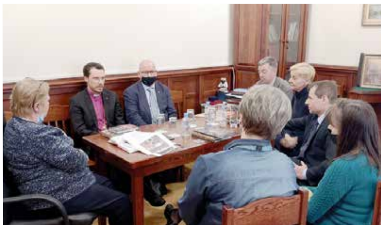
Во встрече приняли участие ведущие специалисты ГМИР, представители Отдела по связям с религиозными объединениями Администрации Санкт-Петербурга и представители Евангелическо-Лютеранской Церкви России

По окончании встречи гости из ЕЛЦР совершили экскурсию по обновленной экспозиции Музея, особое внимание они уделили залу «Протестантизм». ■