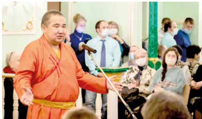
В мероприятиях Пасхального марафона ежегодно принимают участие представители Буддийской традиционной Сангхи России в Москве...