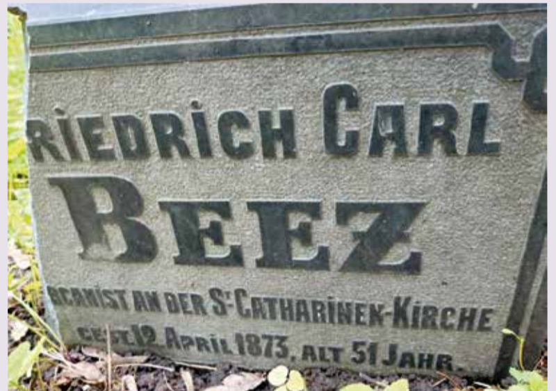
Надгробие органиста церкви св. Екатерины Фридриха Карла Беца на Смоленском лютеранском кладбище

Friedrich Carl Beez (1822–1873) – надгробие перенесено от могилы на несколько десятков метров, крест утрачен. Текст на немецком языке: «От благодарных друзей и учеников».