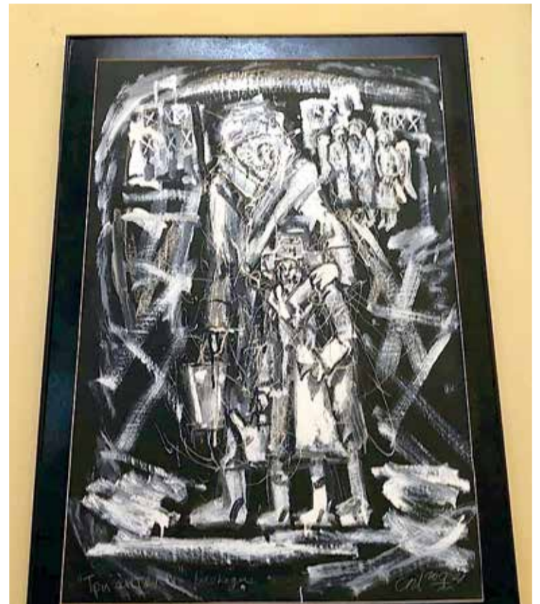
«Блокада. Три ангела» 2021 год. Черная бумага. Смешанная техника. 100x70 см