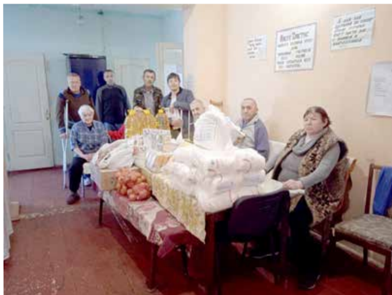
Благодаря собранным пожертвованиям приют обеспечен продуктами минимум на квартал