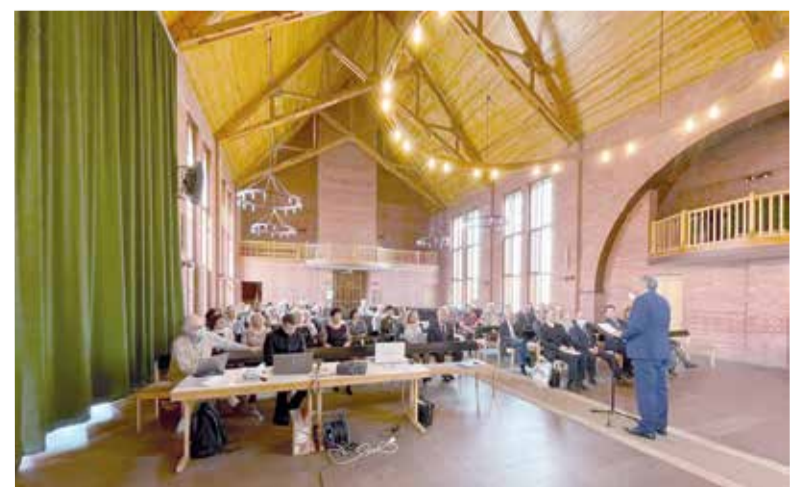
В течение дня прозвучали доклады, представленные руководителями общественных организаций российских немцев Омской области, Центрами немецкой культуры, служителями Церкви, представляющими различные традиционные конфессии немцев России...

Организаторы семинара могут быть довольны – основная его цель достигнута. Актив омских немцев осознает крайнюю необходимость комплексного взаимодействия с Церковью по вопросам сохранения и развития своей национальной идентичности. По итогам работы семинара можно вывести определенную триаду успешной деятельности немцев Омского Прииртышья, которая заключается в ответственности самих немцев за свою судьбу, конструктивном сотрудничестве с органами власти, духовном взаимодействии с традиционными конфессиями немцев России. ■