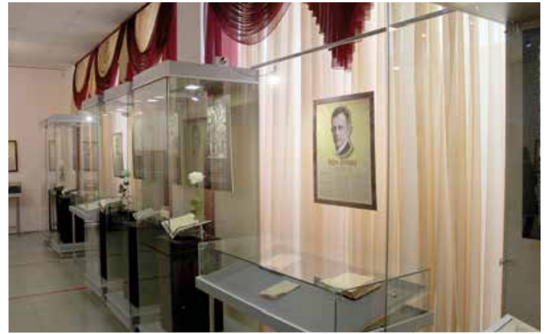
Материалы выставки среди экспонатов музея

На мероприятии также присутствовал генеральный консул Федеративной Республики Германии Бернд Финке. Он отметил вклад СССР в борьбу