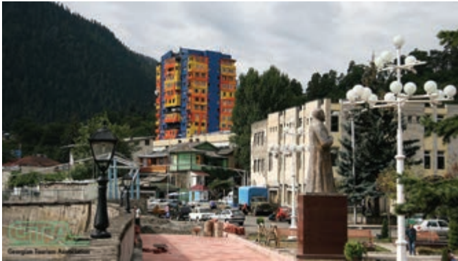
Die Stadt Borshomi ist bekannt für ihre reiche Natur und die Mineralquellen

BORSHOMI. Borshomi – einer der schönsten Kurorte Georgiens liegt im Westen des Landes, in Samzche-Dshawacheti. Die Stadt ist bekannt für ihre reiche Natur und die Mineralquellen. Zu den Zarenzeiten lebten hier die Romanows, die deutsche Architekten wie Remert, Rade, Karl Rahm, Feisen und andere nach Borshomi brachten. Von ihnen wurde das erste Kraftwerk und der Romanow-Palast gebaut und der Park angelegt. Nach dem Krieg beteiligten sich die deutschen Kriegsgefangenen am Bau des Tschitachewkraftwerks. Damals wuchs die Zahl der deutschen Siedler in Borshomi.