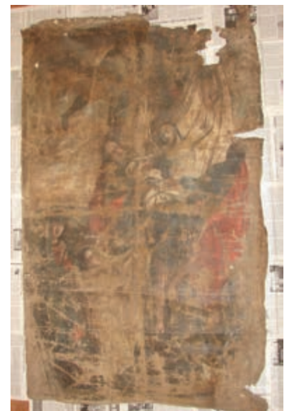
Altarbild, das die Berdjansker Gemeinde zurück erhielt