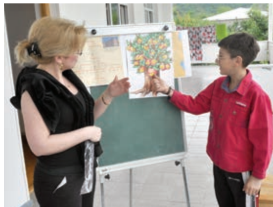
Wir sahen ungewöhnlich malerische Stammbäume und hörten faszinierende Familiengeschichten...