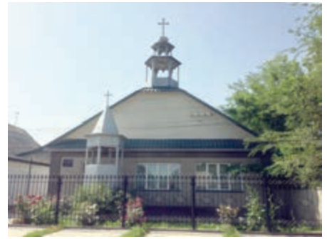
Kirchengebäude in Bischkek

Vor allem aber – und das ist wohl das Geheimnis ihres Erfolges – ist die kirgisische Kirche mit ihren vierzehn Gemeinden und fünf Pastoren im ganzen Land eine betende Kirche. Alles Tun und Handeln wird im Gebet bedacht; jedes Leiden und jede Not werden im Gebet gemeinsam vor Gott gebracht. Ich habe teilgenommen an der Gebetsstunde