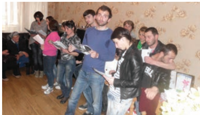
Die Jugendlichen lasen Texte über die Schöpfung und das Leben Jesu vor

mich und die 42 bei mir versammelten. 25 Menschen, darunter Deutschstämmige (Bauer, Mayer, Schwentke, Rade, Bormann, Kraus u. a.), äußerten damals den Wunsch am Gottesdienst teilzunehmen. So gründeten wir die Gemeinde in Borshomi, die erste