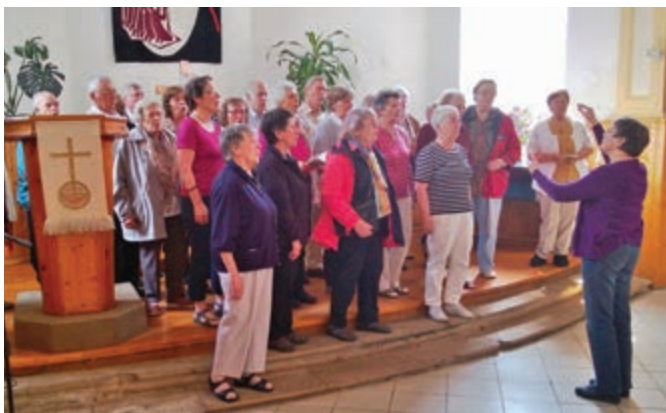
Am Schluss des Gottesdienstes führten die Brüder und Schwestern aus Deutschland spontan einige Chorwerke auf