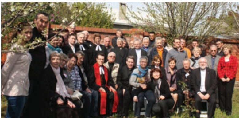
Synodale, Gäste und Gemeindeglieder im Garten des Gemeindehauses in Krasnodar