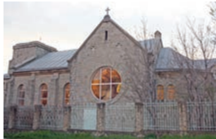
Kirchengebäude in Noworossijsk

Die Arbeit der Synode, die vom 15. bis zum 19. April tagte, wurde mit einem Gottesdienst im Gemeindehaus der Gemeinde Krasnodar eröffnet. Zum Thema der Synode „Jesus Christus spricht: du bist Petrus, und auf diesen Felsen will ich meine Gemeinde bauen, und die Pforten der Hölle sollen sie