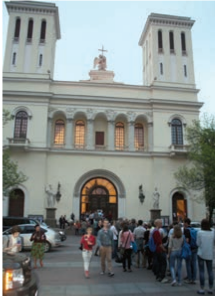
Schlange zur Petrikirche während der Nacht der Museen