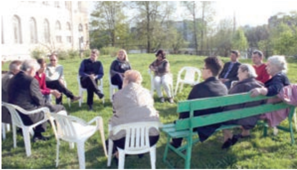
Teilnehmer der Sitzung und die Gäste aus der St. Annen- und St. Petrigemeinde