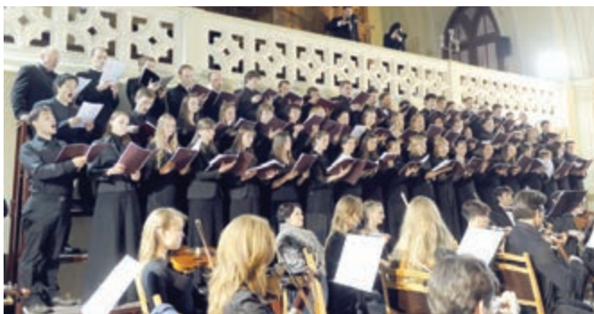
Aufführung der Matthäuspassion von Metropolit Hilarion (Alfew) in der Peter- und Paulkathedrale