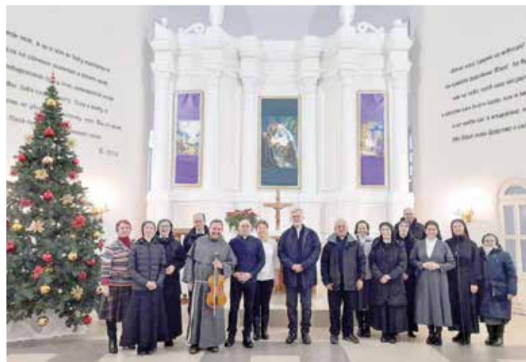
Участники встречи в лютеранской церкви св. Троицы

Участники встреч надеются, что они продолжатся и в будущем. ■