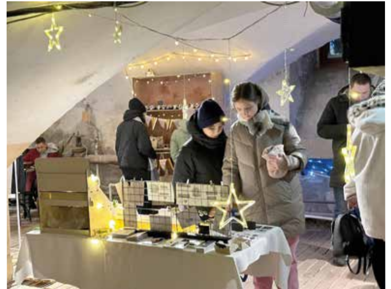
Для многих гостей ярмарки празднично украшенные катакомбы церкви стали настоящим чудом...

САНКТ-ПЕТЕРБУРГ. Погрузиться в праздничную атмосферу в уникальном пространстве в самом сердце Петербурга позволила многочисленным гостям рождественская ярмарка, которая прошла с 20 декабря по 8 января в кафедральном соборе свв. Петра и Павла (Петрикирхе).