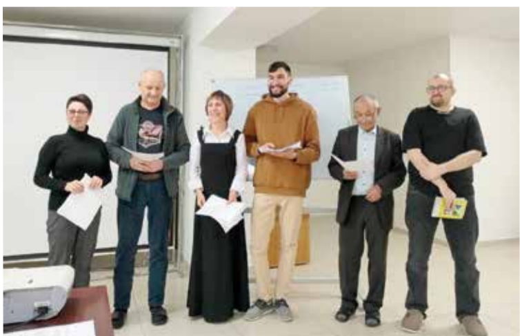
Участники семинара – группа «Дорога в дюнах»