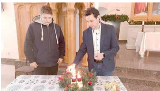
Зоркино (Саратовская обл.)