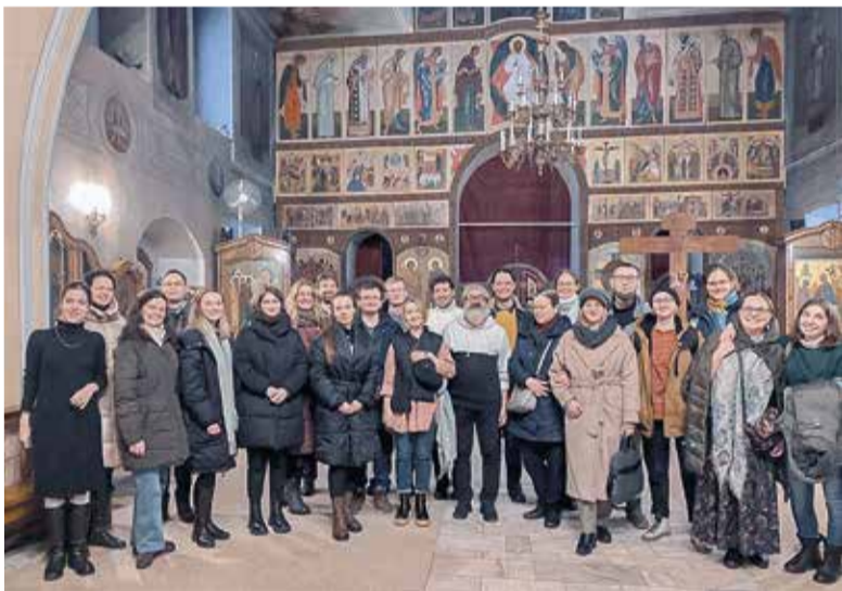
Дружеский визит в православный храм свв. Бессребренников Космы и Дамиана в Шубине, в котором приняла участие молодежь из ев.-лют. собора свв. Петра и Павла

в экуменическом богослужении в римско-католическом соборе Успения Пресвятой Девы Марии в Санкт-Петербурге . Он обратился к собравшимся с размышлением на текст Лк. 10,27.