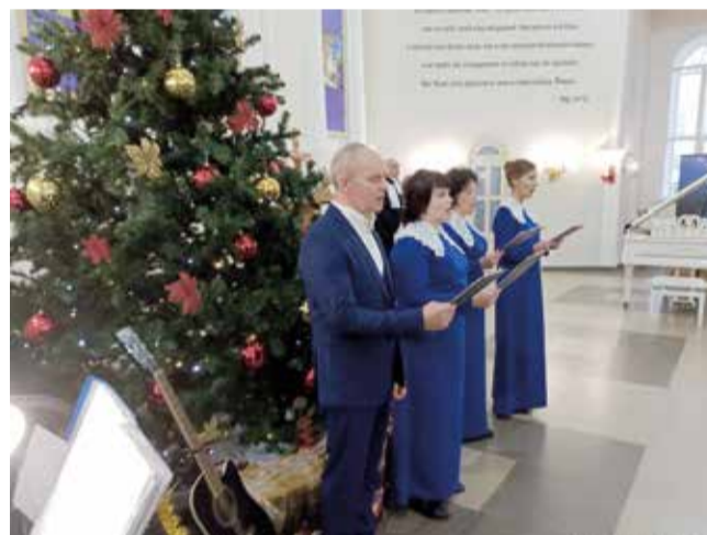
Маркс (Саратовская обл.)