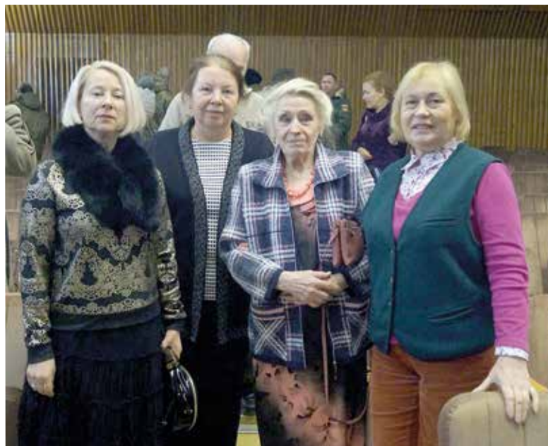
Представители общины Сарепты на конференции

вителями общественных национальных организаций, с которыми община Сарепты сотрудничает многие десятилетия. ■