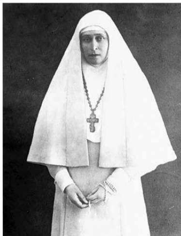
Елизавета Фёдоровна в одежде сестры Марфо-Мариинской обители

Очевидно, сильная любовь к мужу и его стране, сила веры в Иисуса Христа стали импульсом к этому духовному подвигу.