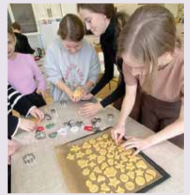
Всего в этом предпраздничном мероприятии приняло участие 19 детей и подростков

Всего в этом предпраздничном мероприятии приняло участие 19 детей и подростков. ■