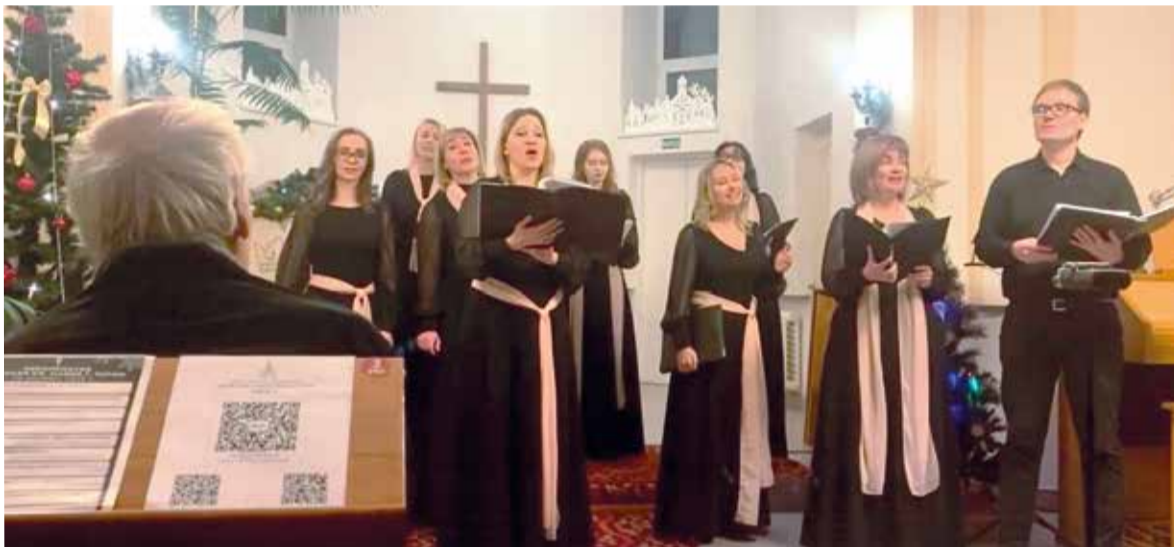
После 17-летнего перерыва дал концерт и принял участие в литургии хор «Junge Stimmen»...