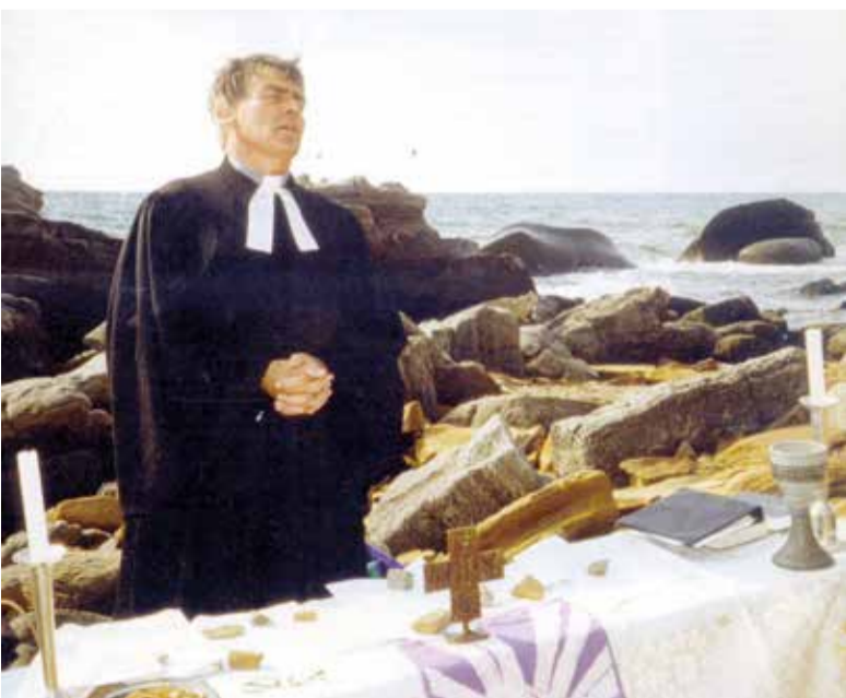
Пропст Манфред Брокманн проводит богослужение на берегу моря. Начало 2000-х годов