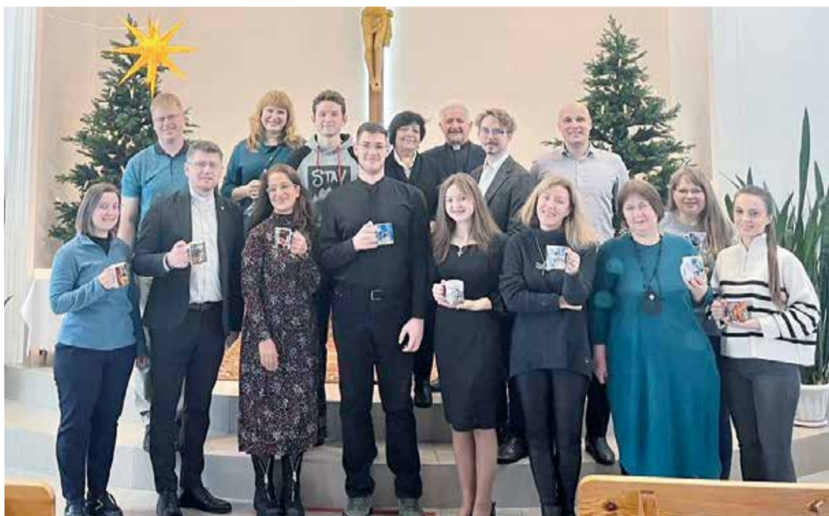
Калининград, Москва, Санкт-Петербург, Саратов, Уфа, Оренбург, Симферополь, Омск и Казань – такова была география участников...

Дай Бог, чтобы молодежное движение возрастало в наших общинах! ■