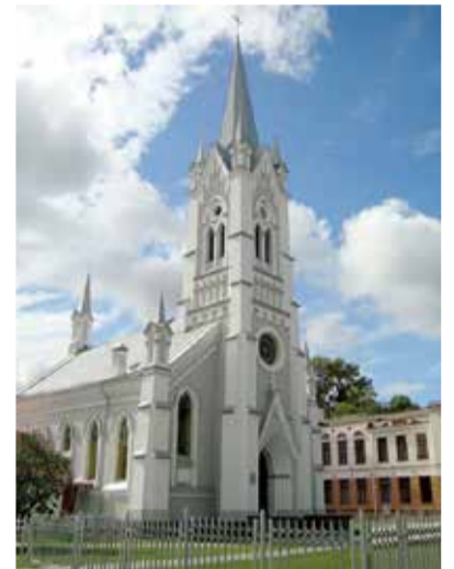
Церковь св. Иоанна в Гродно