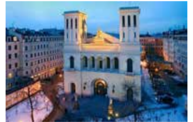
Кафедральный собор ЕЛЦР – церковь свв. Петра и Павла в Санкт-Петербурге