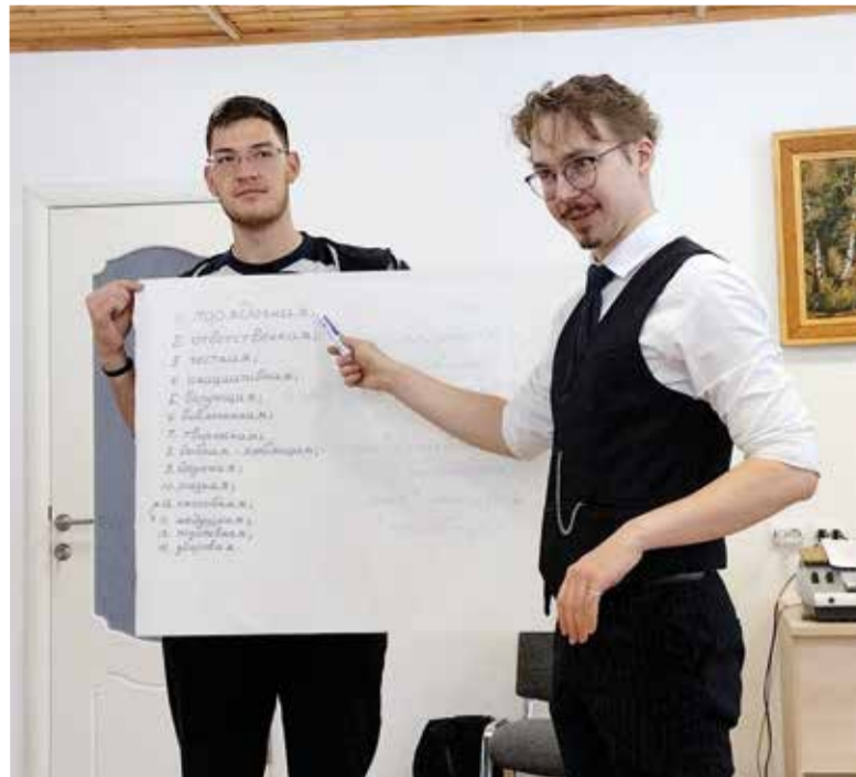
В семинаре приняли участие лидеры молодежного служения из Евангелическо-Лютеранской Церкви России...

Мы поднимали и вопросы о том, как мы ищем и создаем идеи для молодежной работы. На этом семинаре совместными усилиями мы собрали список