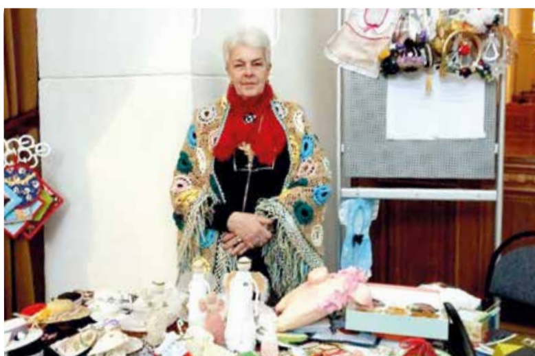
На диаконической ярмарке в кафедральном соборе свв. Петра и Павла

Диакония – это возможность для любого члена общины в свободное от работы время совершить свой малый духовный подвиг – одному или в группе. Это, прежде всего, возможность свидетельствовать словом и делом об Иисусе Христе людям, нуждающимся в любви Бога. ■