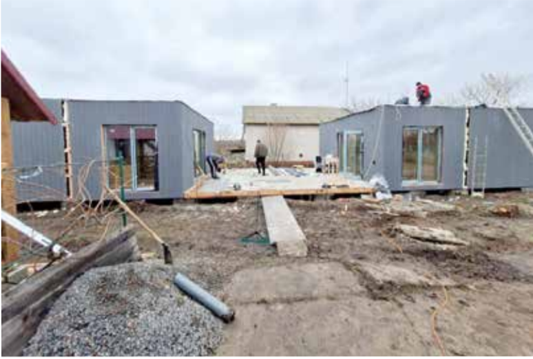
Модульные дома для беженцев строятся при поддержке ФГА на территории церковного центра в Петродолинском

«Конференция служителей с участием зарубежных гостей». Продолжение. Начало на с. 1