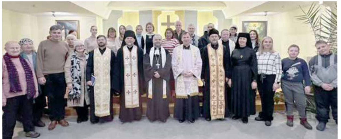
Участники экуменической молитвы в церкви св. Вознесения НЕЛЦУ

Активное общение участников продолжилось и по окончании официальной части встречи: ребята ближе познакомились друг с другом и планировали дальнейшие совместные мероприятия.