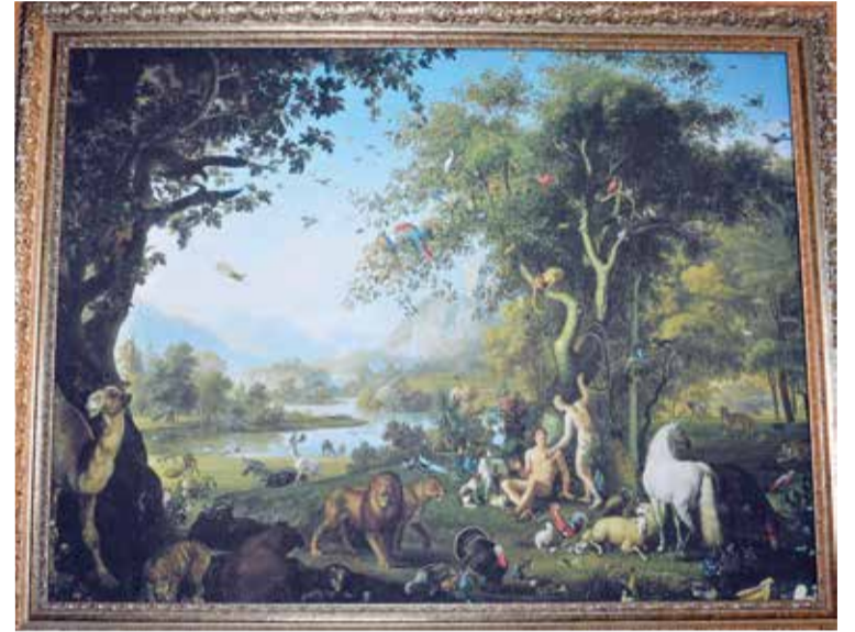
«Адам и Ева в земном раю» Венеслао Петера (кон. XVIII века) – одна из репродукций, представленных на выставке

На ней были представлены репродукции картин известных художников на библейские сюжеты. Вход на выставку был свободный, а посетителей сопровождали экскурсоводы. ■