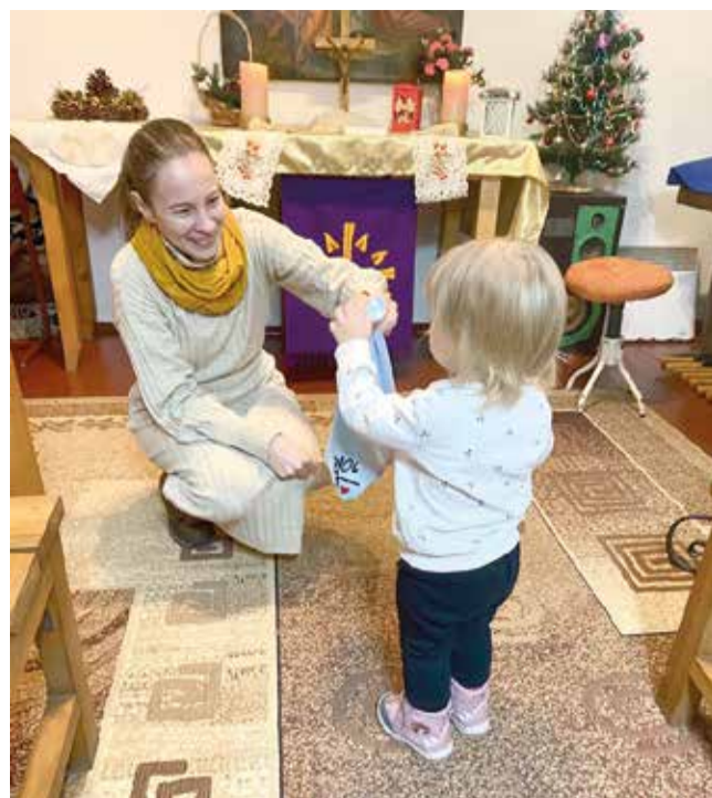
Кривой Рог (Днепропетровская обл.)