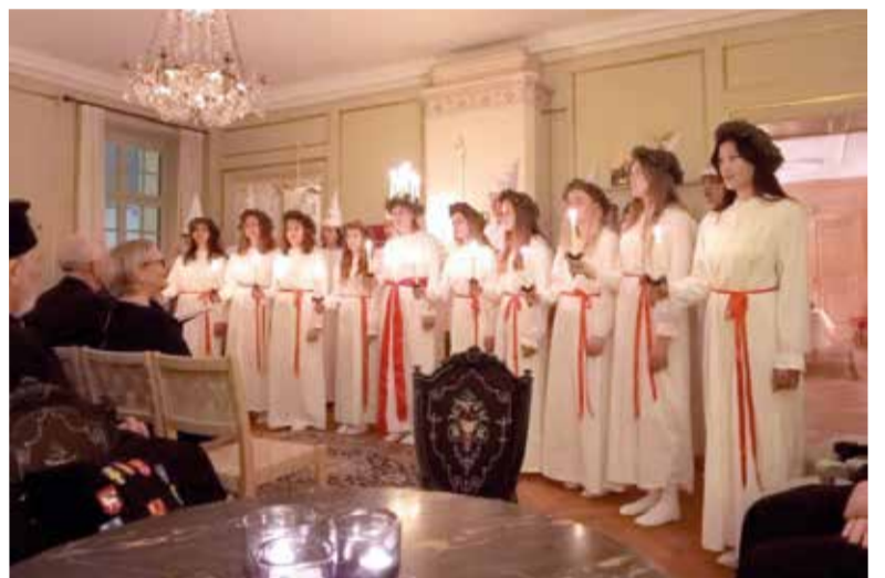
Празднование дня св. Люсии

объединяющего практически все христианские конфессии в этой стране. Участие в этом мероприятии приняли также представители местной украинской общины.