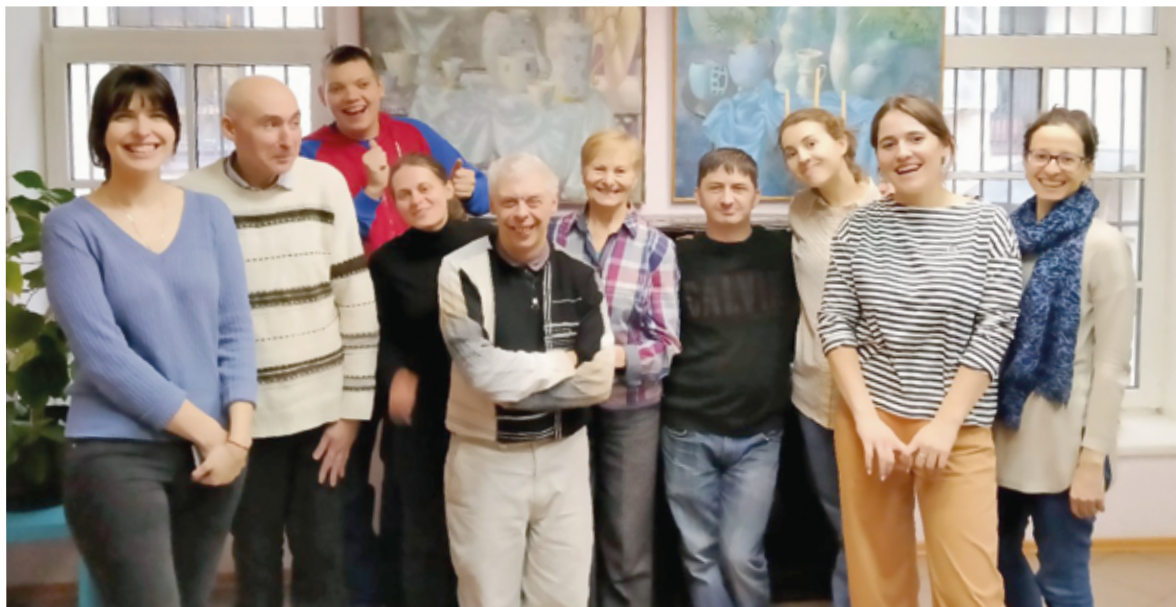
Подопечные из Дома Малецкого с волонтерами проекта «Суп и хлеб» во флигеле Петрикирхе

Надеемся, с Божьей помощью, наша дружба будет продолжаться еще долго, и мы вместе сможем сделать еще много добрых дел. К проекту «Суп и хлеб» всегда можно присоединиться в качестве волонтера. Ждем всех каждый четверг во флигеле с 14:00 до 16:00. ■