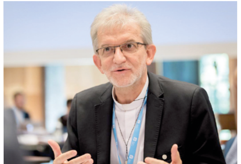
Пастор д-р Нестор Пауло Фридрих, вице-президент Всемирной Лютеранской Федерации в регионе Латинская Америка и странах Карибского бассейна; Капан-да-Каноя, Бразилия

Не для того Бог пробудил Иисуса из мертвых и отвалит камень от гроба, чтобы мы оставались бездейственными и пассивными перед грехом, который привел к распятию Иисуса. Вера в Иисуса Христа не меркнет и не исчезает перед лицом смерти. В боли мы заново встречаем Бога и заново узнаем в наших сестрах и братьях нашего ближнего. Среди вызванных коронавирусом боли и страдания мы также можем увидеть и знак надежды: люди солидарны, есть инициативы и идеи, как сдержать распространение вируса, сообщество верующих живет виртуально через совместные онлайн-богослужения и совместные онлайн-молитвы, людям, которые работают в сфере ухода и здравоохранения, выражается большая благодарность, прилагаются усилия к тому, чтобы, насколько это возможно, уменьшить потери, снова и снова мы видим знаки любви, и все стараются действовать объективно и с уважением. Наша сегодняшняя реальность бросает вызов всем