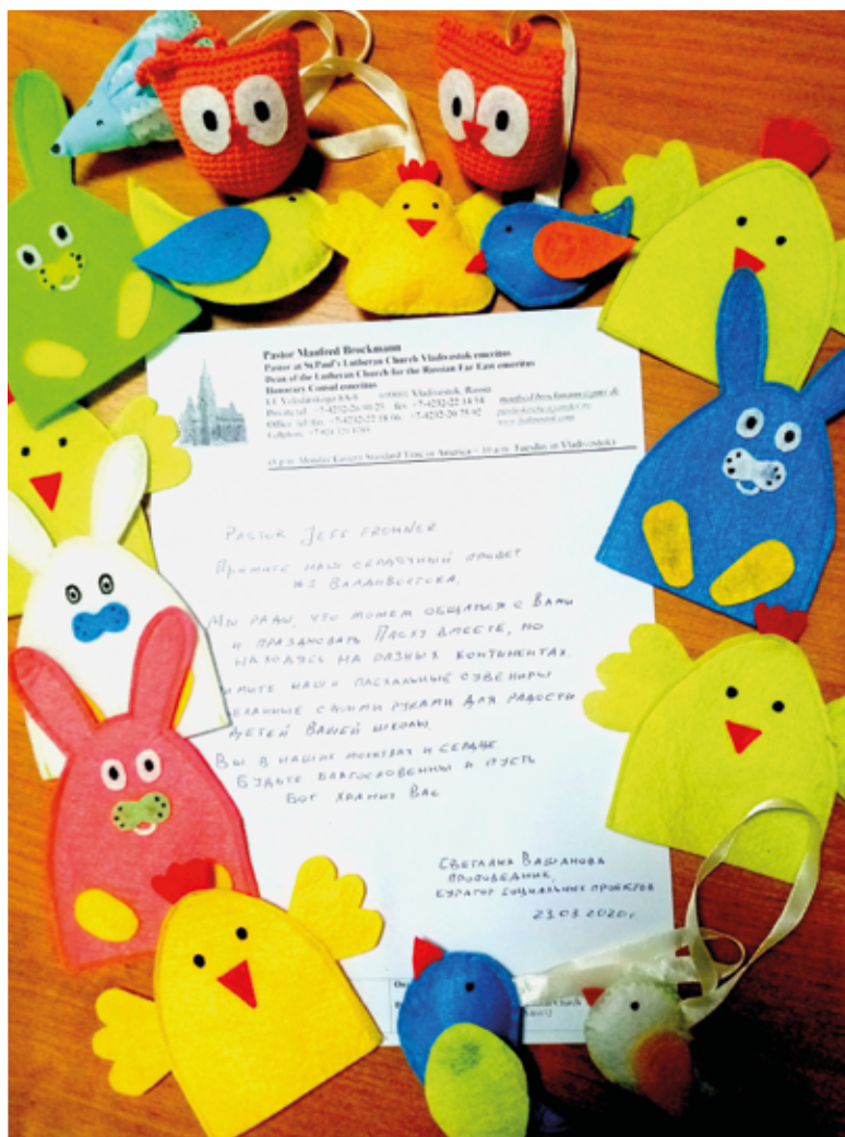
Письмо и поделки для лютеранской школы в Сан-Клементе