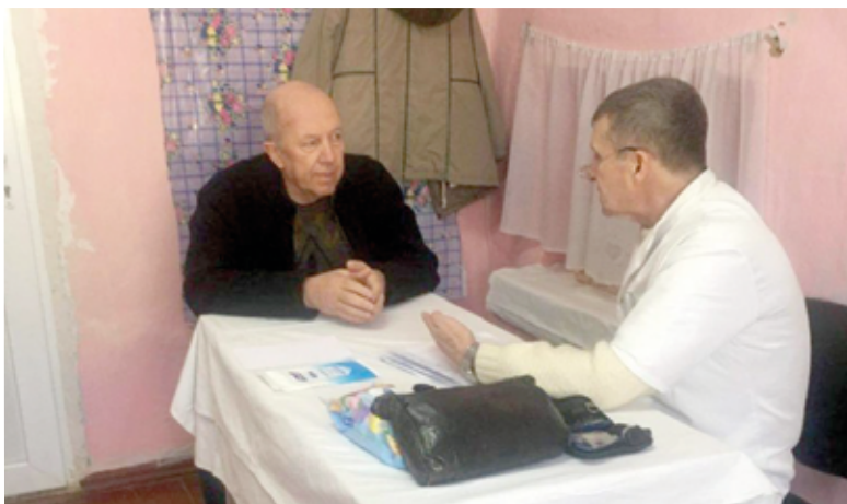
Прием в сельской амбулатории в рамках медицинской миссии

Это время надолго останется в моей памяти как неделя сострадания ближнему. Пусть Господь благословит всех врачей, медсестер, пасторов, прихожан наших общин, принявших активное участие в служении ближнему. ■