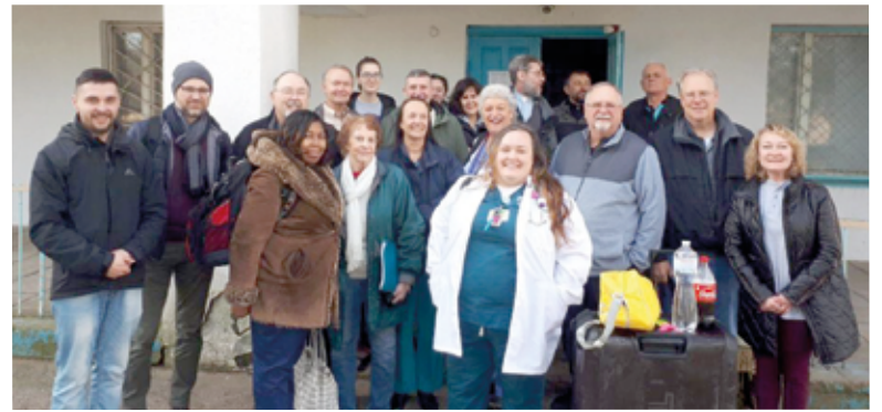
Международная команда медицинской миссии в Одесской области

После двух дней приема в Иосиповке были два дня очень успешного приема жителей в Петродолинском. Начав работу раньше указанного срока, мы заканчивали ее позже плана. Сотрудники местного фельдшерско-акушерского пункта оста-