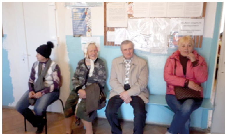
Прием в сельской амбулатории в рамках медицинской миссии