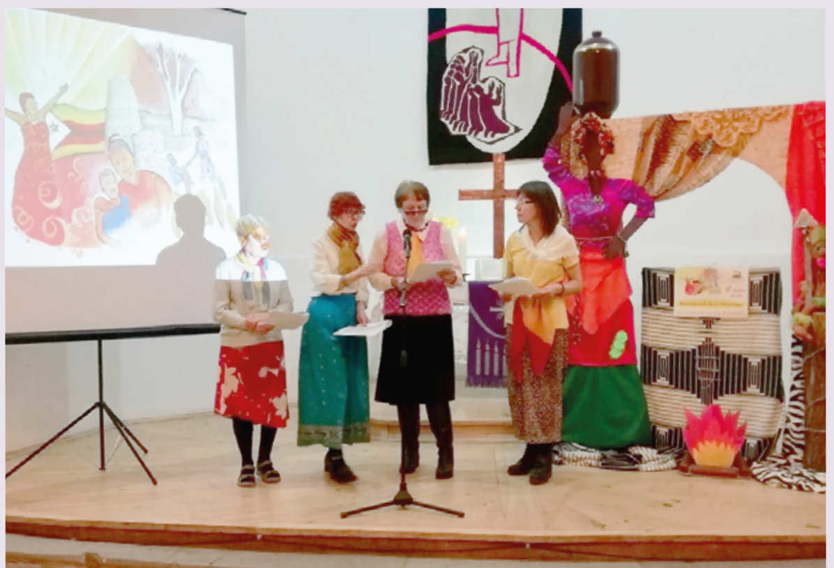
Рядом с женщинами, проводившими литургию в церкви св. Георга, стояли большие безмолвные искусственные фигуры африканок. Может, поэтому все слова молитв звучали так проникновенно...

Богослужение завершилось благословением и девизом этого ВДМ: «Встань, возьми свою постель и иди». Общение сестер из разных конфессий еще долго продолжалось в теплой обстановке за чаепитием. ■