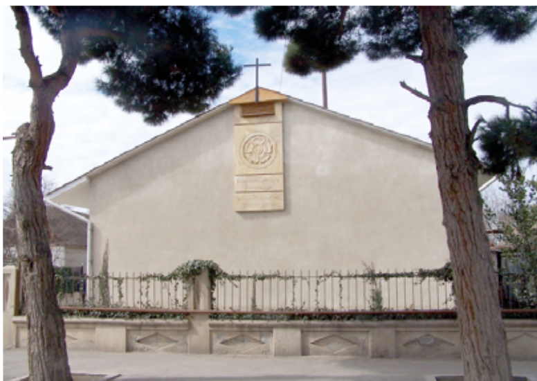
Церковь Мира в Рустави