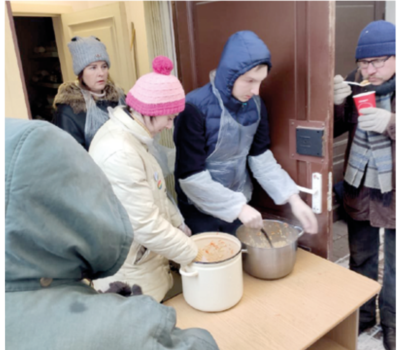
На раздаче обедов в проекте «Суп и хлеб» во дворе флигеля Петрикирхе

вить с ребятами в собственном помещении. Теперь наш церковный флигель стал местом, куда ребята идут с удовольствием и знают, что здесь им всегда рады. Обычно