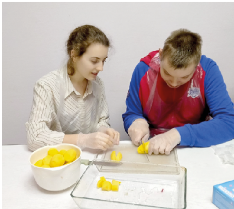
Мы учимся пользоваться картофелечисткой и чистим картошку, не так быстро, как обычно, зато с большим вниманием и любовью, практикуемся не плакать, когда режем лук, и пытаемся научиться мелко и без травм шинковать морковь...