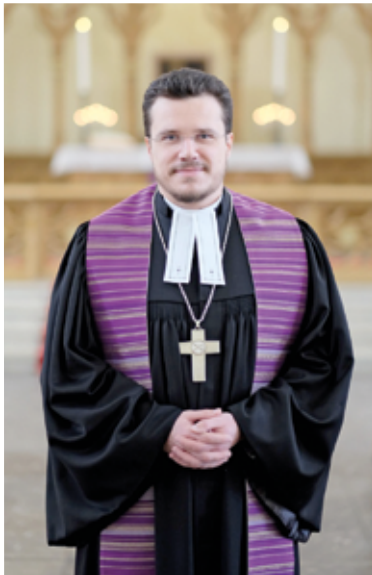
Архиепископ Евангелическо-Лютеранской Церкви России Дитрих Брауэр

Дорогие братья и сестры! «Пасха наша, Христос, заклан за нас» (1 Кор. 5).