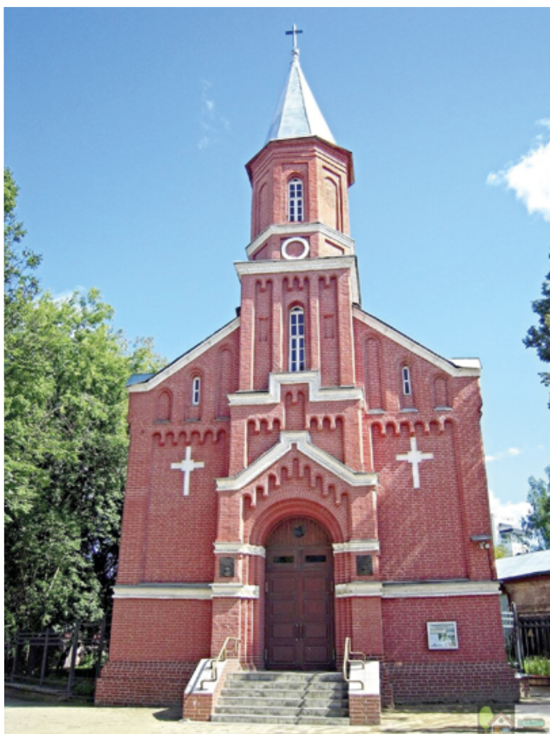
Лютеранская церковь св. Марии в Перми