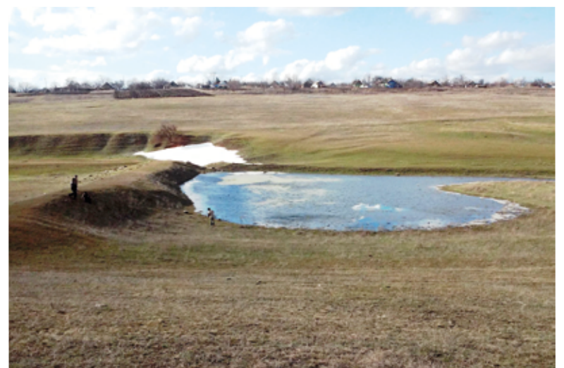
Село Яснополье, Одесской области – бывшее немецкое село Лихтенфельд – в наши дни