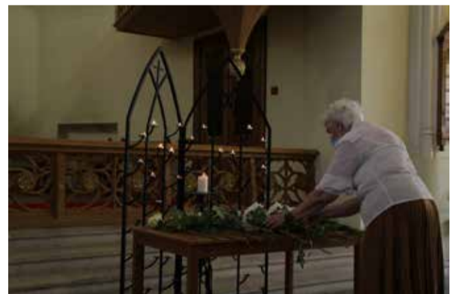
Молебен в кафедральном соборе свв. Петра и Павла в Москве.