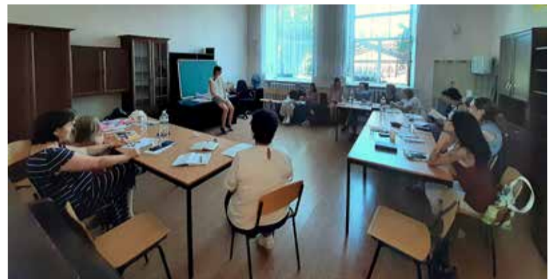
Семинар для учителей воскресных школ НЕЛЦУ

Воскресное богослужение с Причастием 8 августа стало завершением всех трех мероприятий. Лютеране Бердянска были рады принять гостей и ждут их также и в будущем. ■