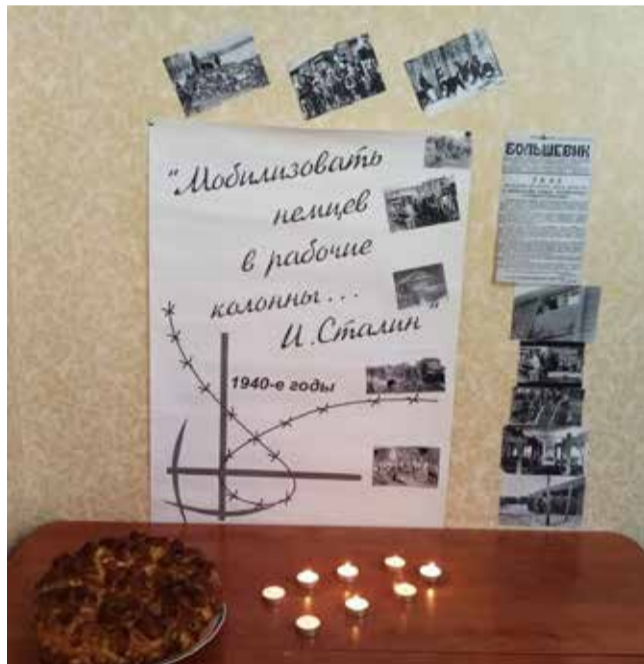
Памятное богослужение в Кременчуге (Полтавская обл.). Участники мероприятия посмотрели документальный фильм «Родина, которая была...», услышали истории жизни свидетелей трагедии. Также состоялась презентация и вручение книг, посвященных немецко-украинской истории.