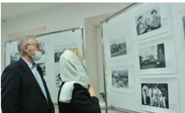
В церкви Спасителя Иисуса Христа в Берёзовском (Свердловская обл.) торжественно открылась фотовыставка о немцах Поволжья, посвященная 80-летию депортации. В исторической фотохронике представлено 36 снимков, которые рассказывают о жизни немецкой автономии на Волге.