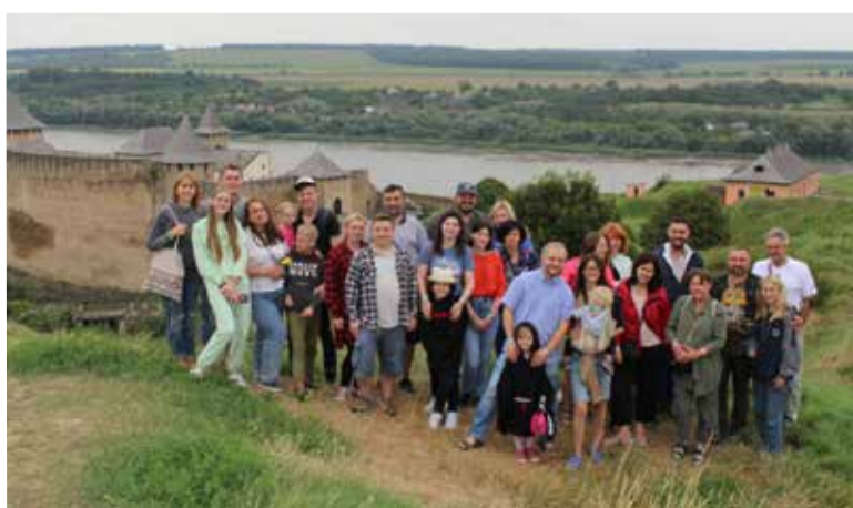
Участники мероприятия посетили Хотинскую крепость на р. Днестр (Черновицкая обл.)