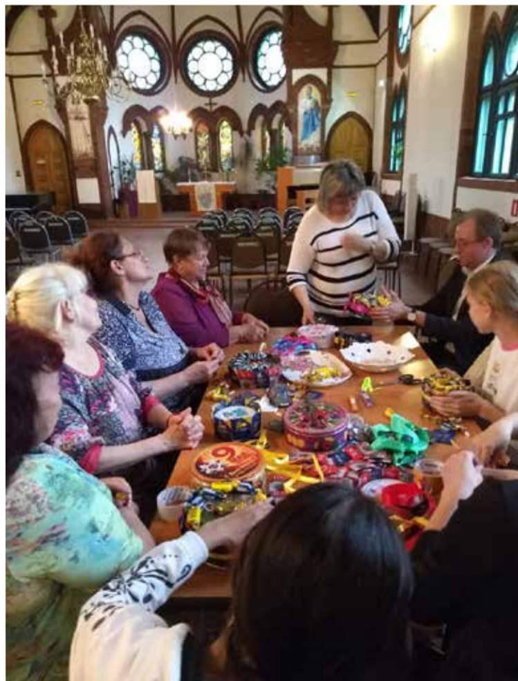
Участники праздника занимаются изготовлением подарков из конфет

Надеемся, что подобные встречи продолжатся в будущем. ■