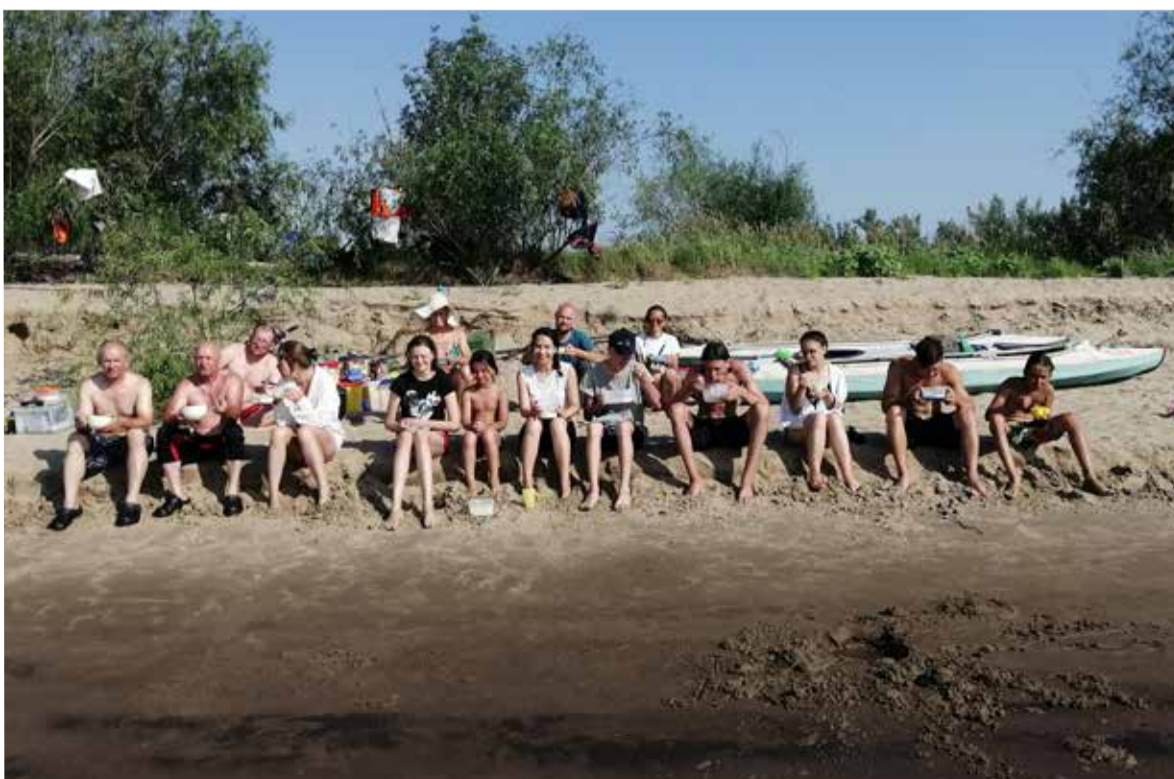
Чудесная команда из 17 человек, интересный маршрут, хорошие места для стоянок...

Во вторник мы опять активно гребли – 17 км в Маркс по спокойной воде. Участники нашего лагеря из Саратова сразу уехала домой, а мы, представители ульяновской общины, остались ночевать в церкви Маркса и с колокольни наблюдали, как сильный дождь поливал место нашей предыдущей стоянки. ■