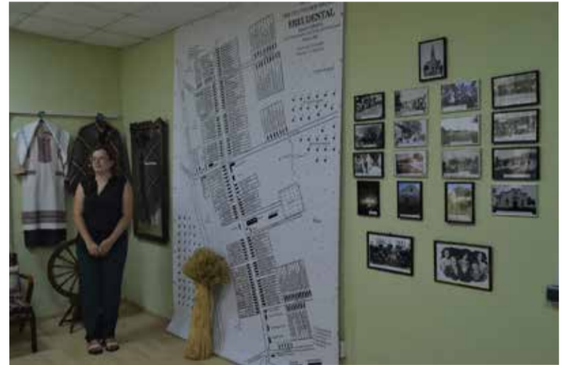
Привлекает внимание восстановленная архивная карта села, на которой указаны не только улицы, их названия, дома, кирха, колодцы, поля, виноградники, а также указаны имена и фамилии тех, кто жил в домах...

Экспозиция находится на втором этаже сельского дома культуры. Среди представленных экспонатов много архивных фото-