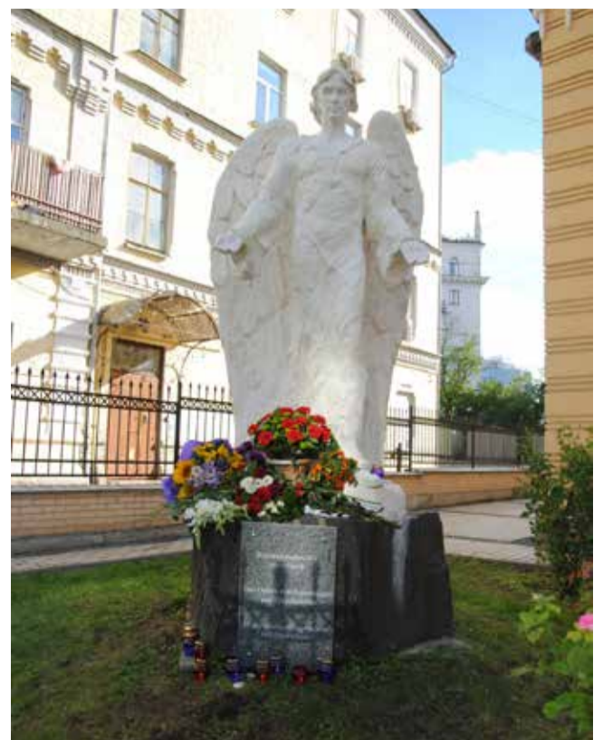
28 августа в Киеве рядом с церковью св. Екатерины у подножья скульптуры ангела была открыта мемориальная доска, посвященная всем жертвам депортации и репрессий, а также прошло памятное богослужение.