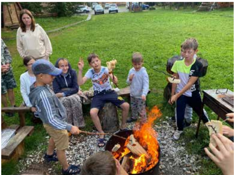
Дети пекли хлеб на костре...

В духовную часть программы выезда вошли два библейских урока для детей на тему «Прощение» по тексту Мф. 18,21–35 и «Причина страха» по тексту Быт. 3,1–10. ■