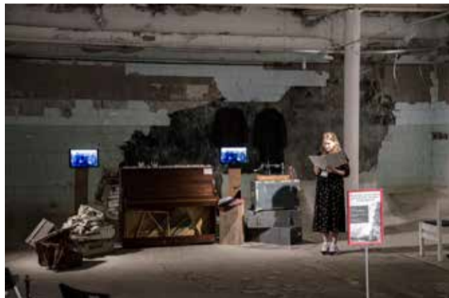
28 и 29 августа в катакомбах (в бывшей чаше бассейна) кафедрального собора свв. Петра и Павла в Петербурге прошла акция «Последний чемодан». Она повествовала о горестях, выпавших на долю советских немцев во время депортации, а также призвала задуматься о ценности материальных вещей в нашей жизни сегодня.

«День памяти и скорби» или «День памяти жертв политических репрессий» – так называется в церковном календаре Союза ЕЛЦ день 28 августа. В этом году исполнилось 80 лет с момента выхода указа «О переселении немцев, проживающих в районах Поволжья» 28 августа 1941 года, который положил начало депортации советских немцев из разных регионов страны в Сибирь, на Урал и в Казахстан. Во многих общинах Союза ЕЛЦ прошли памятные мероприятия, посвященные этой трагической дате.