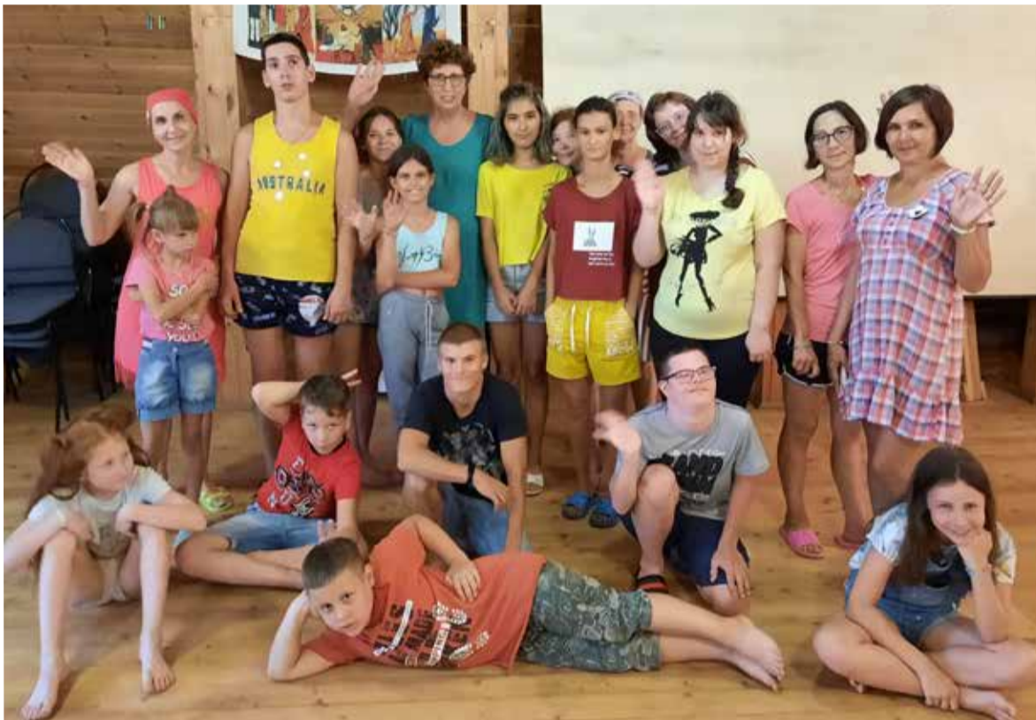
Участники лагеря вместе с организаторами

Дни пролетели, лагерь закончил свою работу. Но мы с ребятами еще встретимся в церкви св. Георга на библейских часах и репетициях к спектаклям нашего театра «Встань и иди», совершим много хороших дел или просто поболтаем во время чаепития. ■