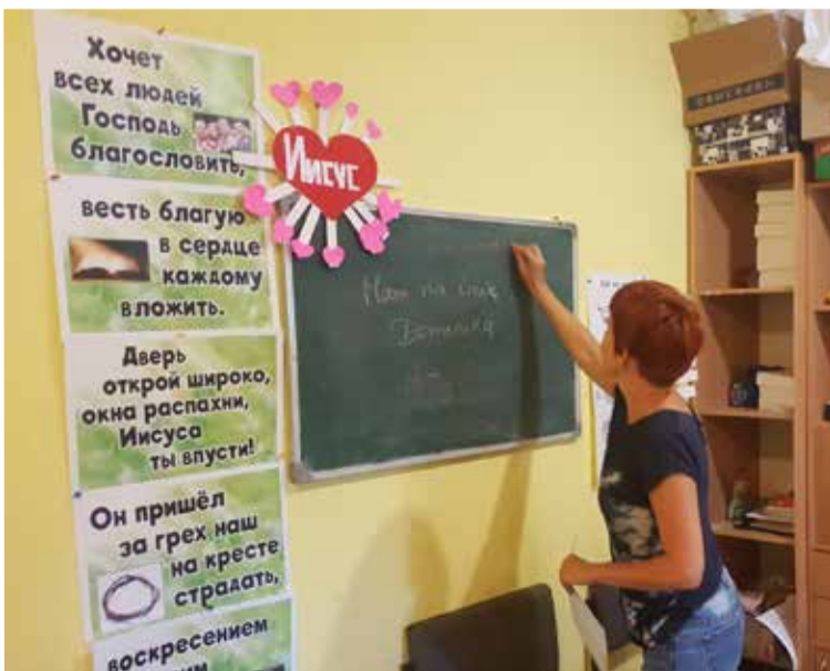
Языковые занятия в лагере

Сердечно благодарим Генеральное консульство Республики Польша в Харькове за книги в подарок для детей и уже традиционное участие в торжественном окончании лагеря. ■