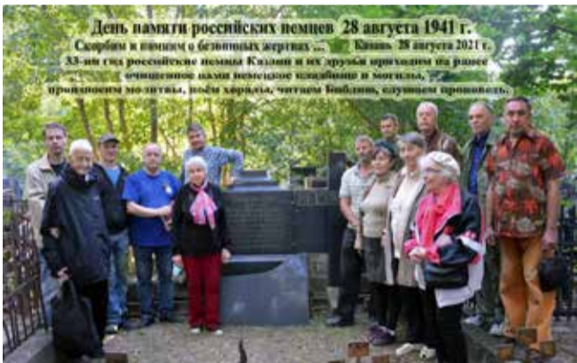
Община Казани ежегодно в этот день собирается на немецком кладбище, где проводит молитву.