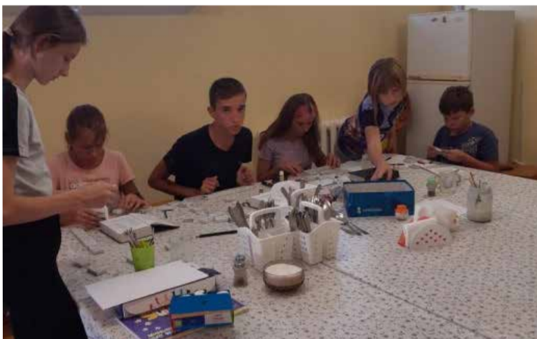
Творческие занятия в лагере