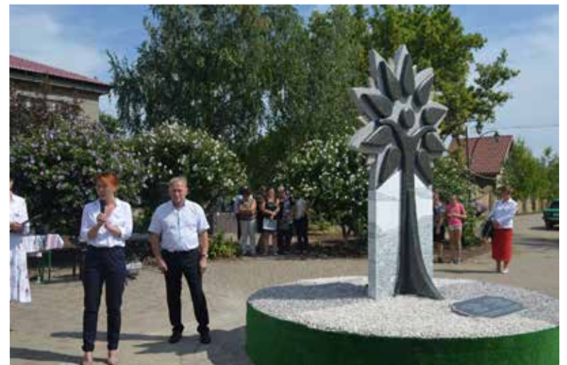
Центральным символом памятника основателям колонии является дерево. Оно олицетворяет жизнь, бессмертие, бесконечность...