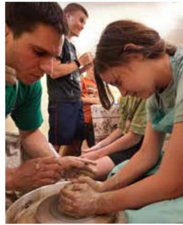
Ребята смогли опробовать гончарный круг...