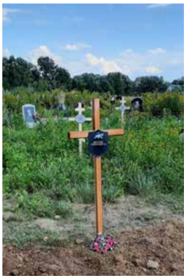
Памятный знак на месте перезахоронения на кладбище в пос. Рассвет

После Второй мировой войны кладбище, к сожалению, не сохранилось, и территория рядом стала активно застраиваться. В 2013 году начались археологические исследования в этом районе, после которых и было принято решение о перезахоронении останков. ■