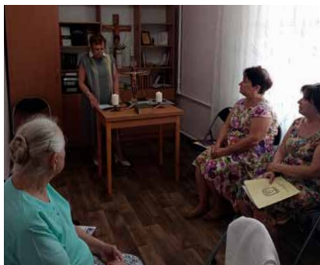
Памятное богослужение в общине Запорожья.