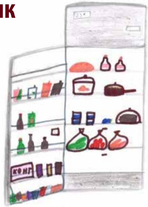
С точки зрения психолога, холодильник может рассказать о многом

Тогда наши усилия в воспитании детей будут сохранены в их жизни, прежде всего, как «духовное наследие семьи». ■