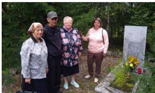
Утром 29 августа прихожане общины Анжеро-Судженска (Кемеровская обл.) пришли к памятнику «Жертвам политических репрессий», который находится в новом микрорайоне. Недалеко от красивых девятиэтажных жилых домов, в глубине хвойных деревьев и стоит неприемный, скромный памятник. Убрали траву, возложили цветы, помолились и отправились в помещение общины, чтобы провести памятное богослужение.