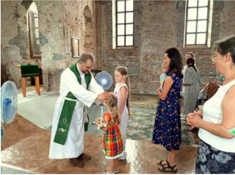
Воскресное богослужение с Причастием в церкви Христа Спасителя стало завершением всех трех мероприятий...