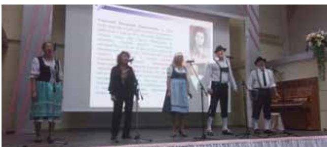
В г. Отрадном (Самарская обл.) 28 августа самарская община св. Георга и центр немецкой культуры «Надежда» провели памятное мероприятие. Город Отрадный строили немцы-трудармейцы, там находился один из лагерей трудармии Самарской области.

«День памяти и скорби» или «День памяти жертв политических репрессий» – так называется в церковном календаре Союза ЕЛЦ день 28 августа. В этом году исполнилось 80 лет с момента выхода указа «О переселении немцев, проживающих в районах Поволжья» 28 августа 1941 года, который положил начало депортации советских немцев из разных регионов страны в Сибирь, на Урал и в Казахстан. Во многих общинах Союза ЕЛЦ прошли памятные мероприятия, посвященные этой трагической дате.