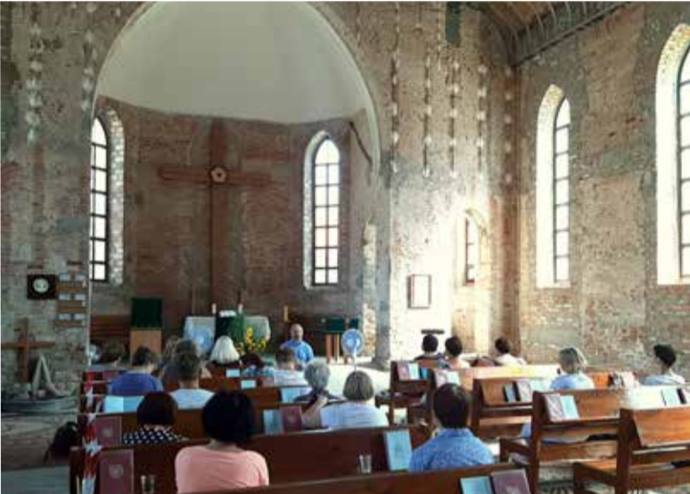
Реколлекции для общин Запорожской области проводит епископ Павел Шварц