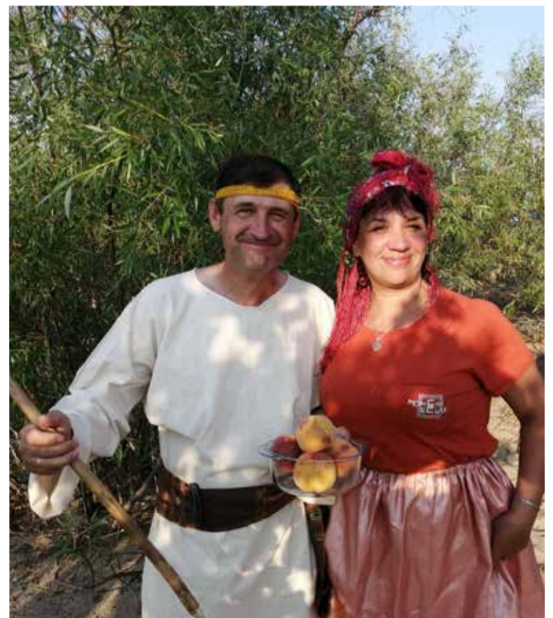
История исхода «в лицах»

Благодарим Господа за всё, что Он сделал для нас руками наших братьев и сестер, которые заботились о нашем быте и уюте, развлечениях и о главном – о служении Господу Словом. ■