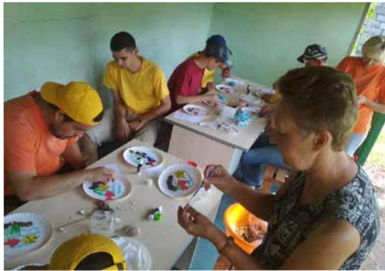
Совместная творческая работа группы «Капелька» и Центра в Прегольском

У всех возникло желание поделиться своей радостью и вдохновением. Поэтому участники группы «Капелька» решили посетить реабилитационный центр для детей и подростков с ограниченными возможностями «Особый ребенок» в пос. Прегольский –