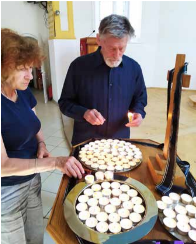
Памятное богослужение в церкви св. Георга в Самаре 29 августа.