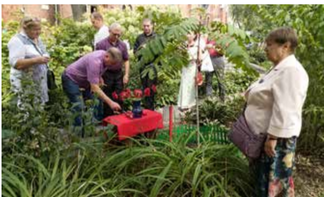
Памятное мероприятие в церкви св. Павла во Владивостоке.