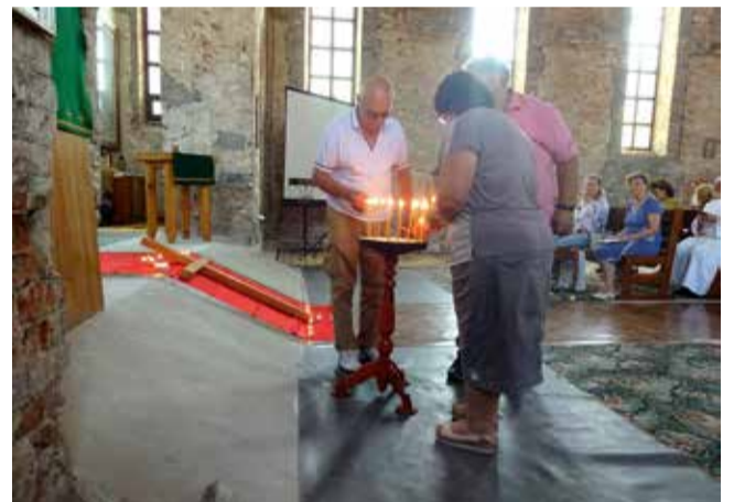
В церкви Христа Спасителя в Бердянске (Запорожская обл.) прошло памятное богослужение, а затем мероприятие, проведенное совместно с центром немецкой культуры «Фройндшафт», на котором звучали рассказы участников событий.