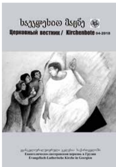
Обложки «Церковных вестников» разных лет