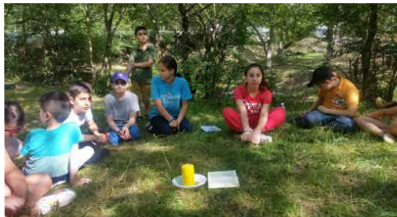
Детское богослужение на природе неподалеку от Марткопского монастыря