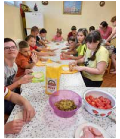
Все вместе готовили пиццу...

том индивидуальных особенностей всех детей, с упором на то, чтобы дети могли социализироваться в коллективной деятельности.