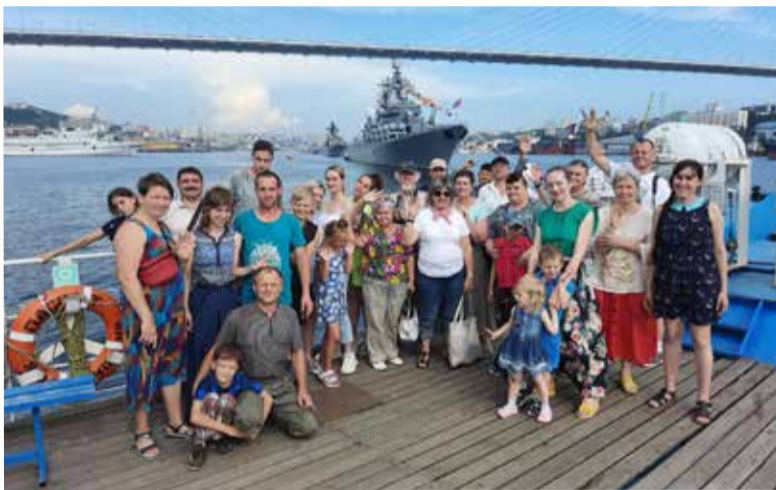
Участники семинара «Новая волна»

Подарки на память, добрые пожелания, надежды на новые встречи и плодотворную работу стали завершением семинара. ■