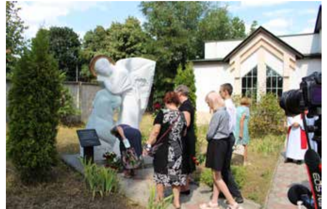
Возложение цветов перед скульптурой «Скорбный ангел» после молитвы в церкви св. Вознесения в Харькове.