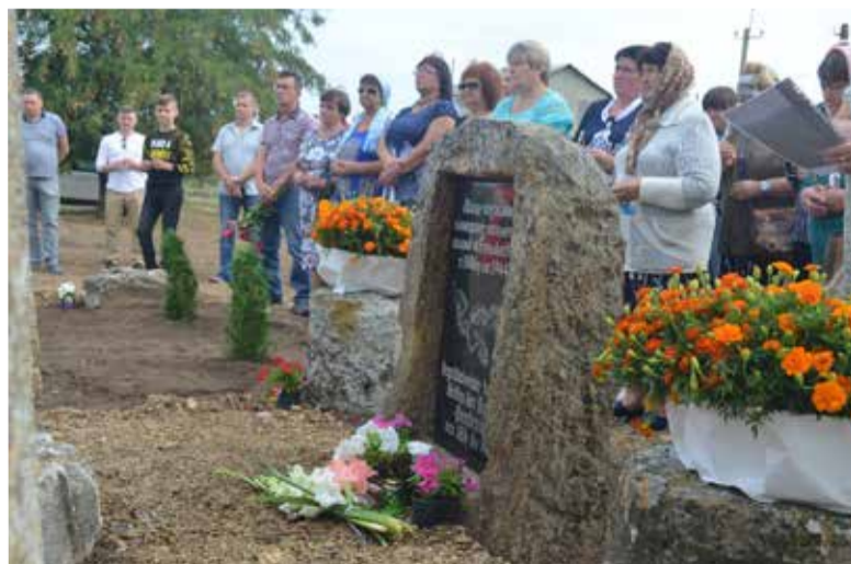
Поминальная молитва на немецком кладбище в Мирном