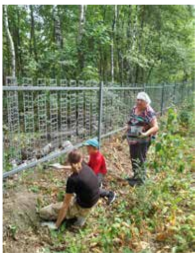
В этом году основной работой на кладбище стала покраска забора...