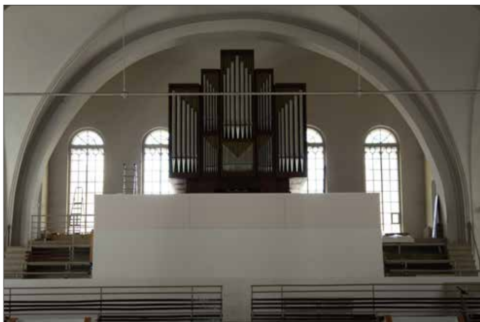
Орган фирмы Willi Peter стал подарком для общины св. Анны и св. Петра к юбилею Реформации