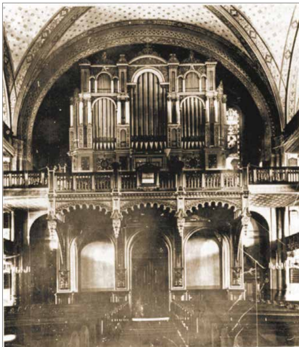
Орган фирмы Walker, установленный в Петрикирхе в 1840 году