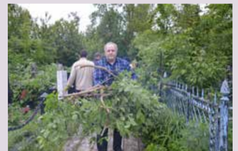
3 июня прихожане церкви св. Екатерины и представители Немецкого Дома встретились на немецком кладбище, чтобы выполнить работы по благоустройству