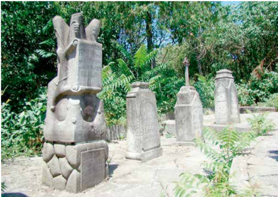
Немецкое кладбище в Асурети (Елизабетталь)