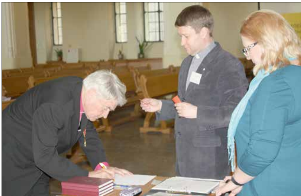
Голосование на Синоде