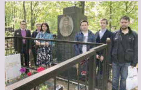
Молебен на Введенском кладбище у могил епископов Московского консисториального округа