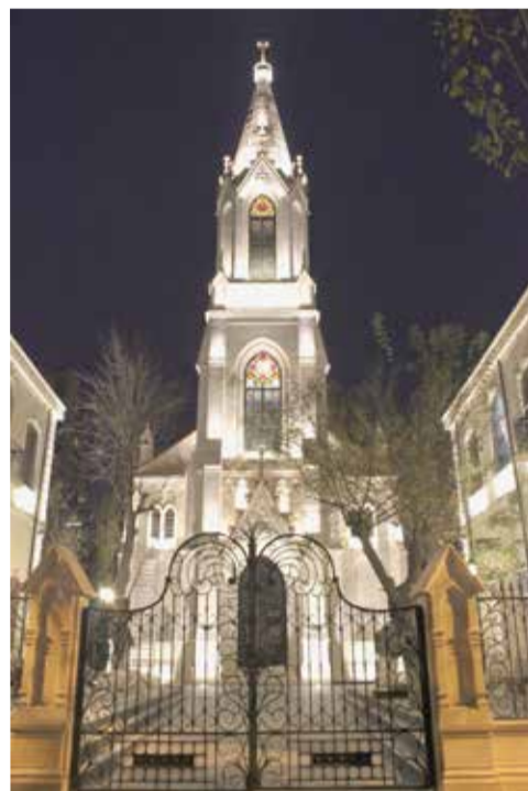
Церковь Спасителя в Баку используется сейчас как концертный зал филармонии. Община проводит в здании еженедельные воскресные богослужения