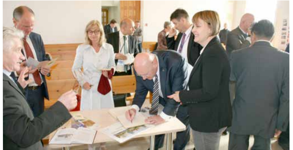
Представители делегации оставили свои пожелания в книге визитов