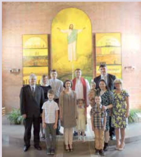
Крещаемые дети с родителями и крестными родителями в церкви Христа

Омск. В день праздника Пятидесятницы, 4 июня, в церкви Христа состоялось особенное праздничное богослужение, на которое собрались прихожане общин Омской области. Многие из них проделали большой путь, чтобы вместе с единовверцами из разных общин разделить радость праздника сошествия Святого Духа. Во время земной жизни Иисус говорил ученикам Своим об Утешителе, который придет Ему на смену. И этот Утешитель есть Дух Святой. Дух Божий живет в каждом, кто призывает Бога в свою жизнь.