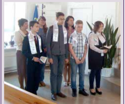
Конфирманты и преподаватели воскресной школы на богослужении 11 июня

Уфа. 11 июня в общине Уфы прошла конфирмация выпускников детской воскресной школы.