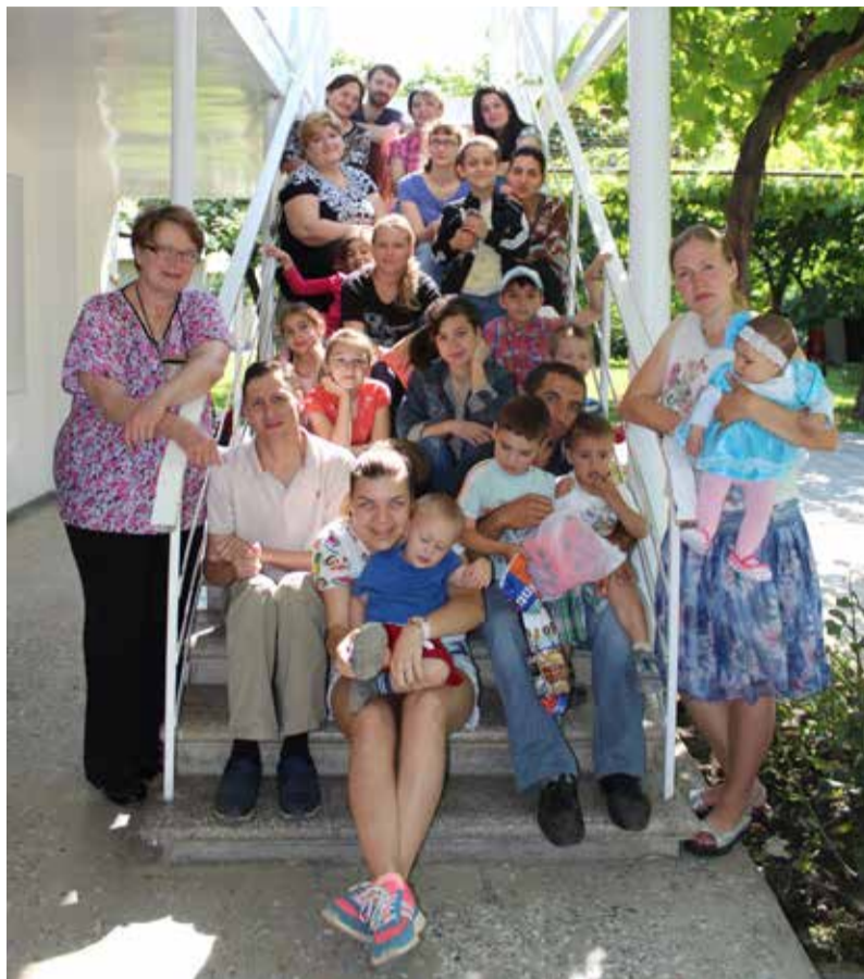
Участники семейного лагеря в Кварели

На рукоделии за стол усаживалась вся семья, и мы часто наблюдали, что папы и мамы рисовали и раскрашивали, клеили и мастерили с не меньшим азартом, чем дети.