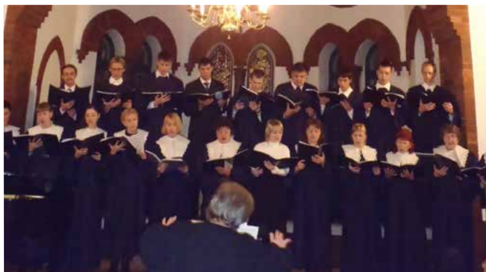
Хор общины св. Павла г. Владивостока