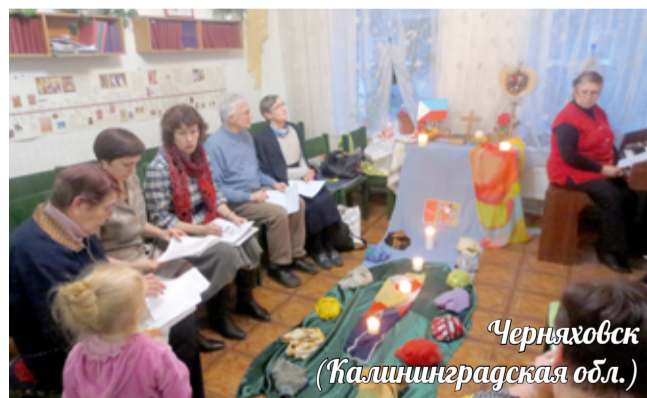
Черняховск (Калининградская обл.)