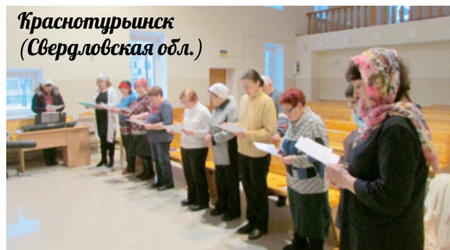
Краснотурьинск (Свердловская обл.)