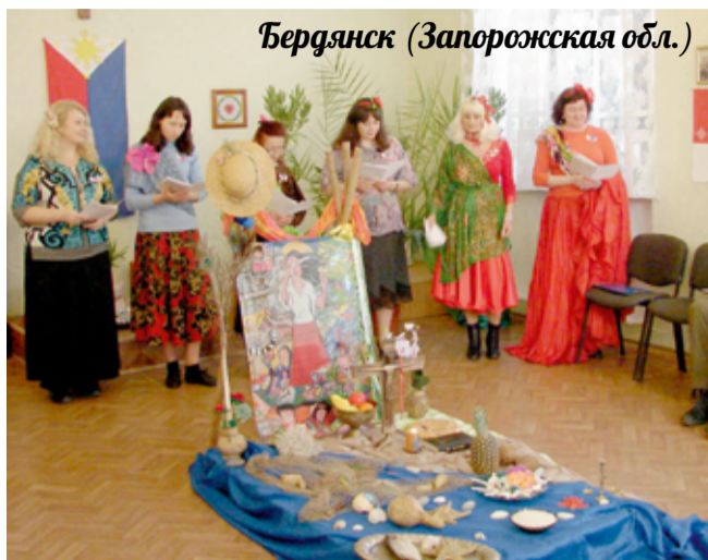
Бердянск (Запорожская обл.)