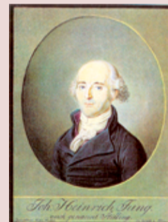
Иоганн Генрих Юнг-Штилинг

330 лет исполняется в этом году со дня рождения Иоганна Альбрехта Бенгеля (1687-1752). Если Юнг-Штилинг происходил из Зигерланда на западе Германии, где было развито горное дело и царил социальная нужда, то Бенгель, родившийся недалеко от Штутгарта, был швабским теологом, который в своем углубленном изучении Библии приблизился к пиетизму, главенствовавшему тогда в вюртембергском протестантизме и за его пределами. «Пиетизм» означает «благочестие», и для этого течения Библия является источником всей совокупности знаний и «совестью мира». Учение пиетизма о благочестии и строгость его веры взяли с собой на Кавказ переселенцы из Вюртемберга. Отчасти это и было причиной их переселения, поскольку они считали, что на Кавказе они смогут жить свободнее, без вмешательства государства и Церкви в дела их веры. ■