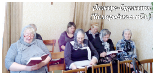
Анжеро-Судженск (Кемеровская обл.)