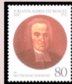
Иоганн Альбрехт Бенгель