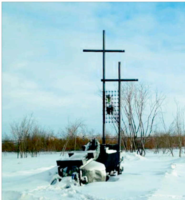
Мемориал трудармейцам в Воркуте