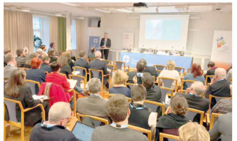
Генеральный секретарь ВЛФ пастор Мартин Юнге выступает на Консультационной встрече в Хёэре (Швеция)

По материалам ВЛФ и сайта www.lutherancathedral.ru