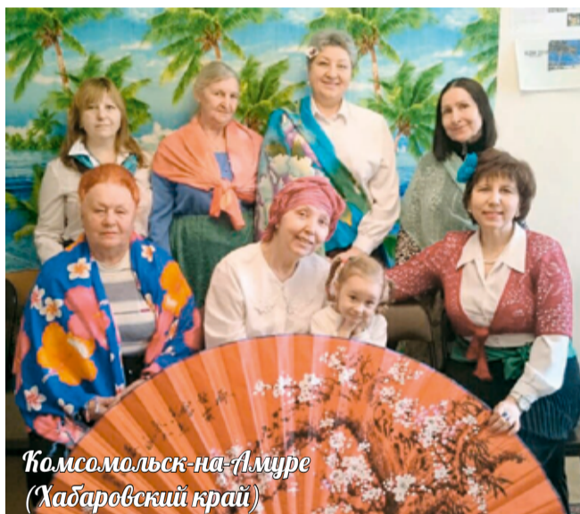
Комсомольск-на-Амуре (Хабаровский край)