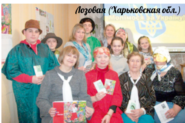
Лозовая (Харьковская обл.)