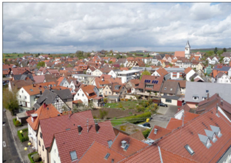
Швайххайм. Вид на город сегодня

В эти годы у людей развились противоречивые чувства: с одной стороны, воспоминания о недостаточном для них Траубенберге и Катариненфельде, где они чувствовали себя дома – «drhoimd» (непереводимо!); с другой стороны, усиливалось желание