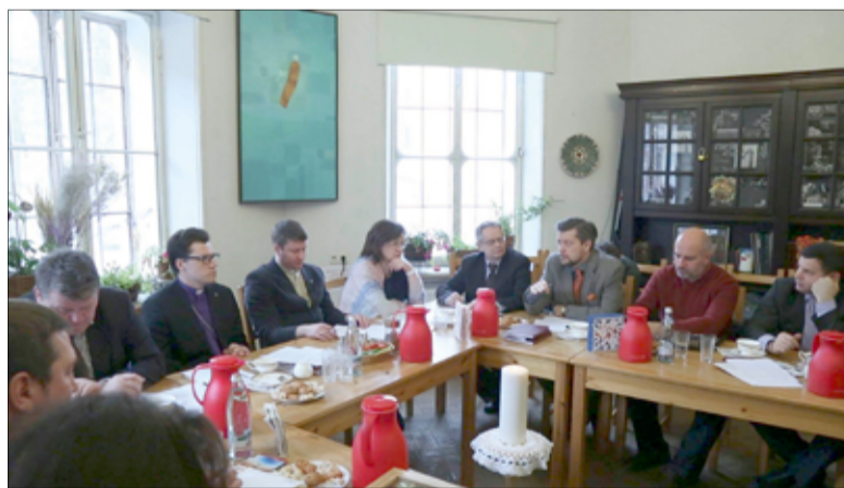
На втором заседании Оргкомитета были окончательно определены центральные мероприятия года...