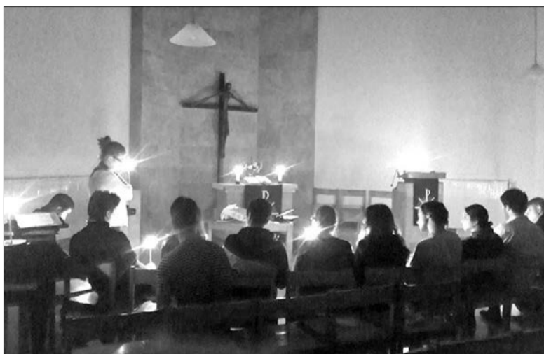
МОЛОДЕЖНОЕ БОГОСЛУЖЕНИЕ В ЦЕРКВИ ПРИМИРЕНИЯ, ПРОШЕДШЕЕ ВО ВРЕМЯ ВСТРЕЧИ КООРДИНАТОРОВ

Эта встреча в очередной раз показала, что, несмотря ни на что, мы едины во Христе, и пока мы вместе, мы можем многое! ■