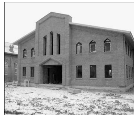
СТРОЯЩИЙСЯ ДИАКОНИЧЕСКИЙ ЦЕНТР В УФЕ

УФА. С 20 по 25 ноября в лютеранских общинах г. Уфы, г. Стерлитамака, с. Пришиб состоялись встречи с епископским викарием Евангелической Лютеранской Церкви европейской части России (ЕЛЦ ЕР) Норбертом Хинтцем. В ходе этих встреч проводились библейские занятия, богослужения, а также посещение католической церкви с. Алексеевка и лютеран г. Давлеканово.