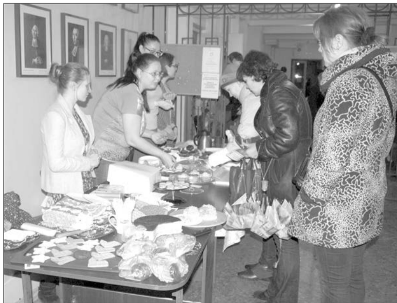
КУЛИНАРНЫЙ КРУЖОК УГОЩАЛ ПОСЕТИТЕЛЕЙ «ФАНТАСТИЧЕСКОЙ» ВЫПЕЧКОЙ

Ее сменил концерт хора общины под руководством кантора Сергея Силаевского. Гости услышали вокальные и органные произведения композиторов эпохи Ренессанса Хасслера и Изаака, барочных композиторов Пёрселла и Резона, петербургского композитора XX века Валерия Гаврилина и даже духовные песнопения из старинной русской традиции.