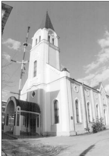
ЦЕРКОВЬ СВ. ЕКАТЕРИНЫ, ПОСТРОЕННАЯ В 1768 ГОДУ, НЫНЕ – МАЛЫЙ ЗАЛ ФИЛАРМОНИИ

Первые лютеране в г. Архангельске появились со времени прибытия в город первых иностранцев – голландских купцов. Немецкая слобода г. Архангельска начала формироваться сразу после основания города в 1584 году. В Немецкой слободе проживали многие влиятельные купцы и чиновники, которые оказали большое влияние на развитие города: Кейли, Грели, Родде, Бекеры, Брандты, Морганы, Кларки, Клафтоны, Классены, дес Фонтейнесы, Линдесы, Штоппы, Гернетты, Пецы, Ротерсы, Гувелякены, Мейеры. Наличие большого числа иностранцев и иногородних привело к консолидации жителей в свои религиозные общины: евангелическую (реформатско-лютеранскую), англиканскую, католическую, иудейскую, магометанскую. Они