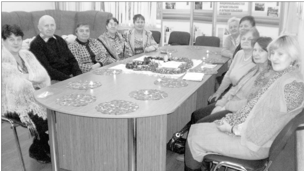
ПРИХОЖАНЕ ОБЩИНЫ НА БИБЛЕЙСКОМ ЧАСЕ

Полтора века приход имел устойчивую и многочисленную паству. В 1916 году, например, в Архангельске значилось 2836 лиц лютеранского вероисповедания, что для двадцатитысячного города было немало!