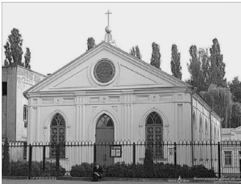
ЦЕРКОВЬ СВ. ЕКАТЕРИНЫ