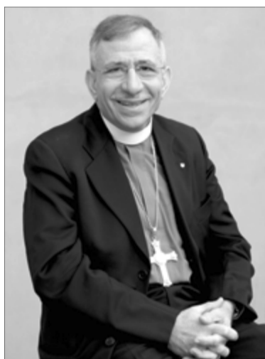
ПРЕЗИДЕНТ ВСЕМИРНОЙ ЛЮТЕРАНСКОЙ ФЕДЕРАЦИИ ЕПИСКОП ЕВАНГЕЛИЧЕСКО-ЛЮТЕРАНСКОЙ ЦЕРКВИ В ИОРДАНИИ И НА СВЯТОЙ ЗЕМЛЕ МУНИБ ЮНАН

«Слава в вышних Богу, и на земле мир, в человеках благоволение» (Лк. 2,14)