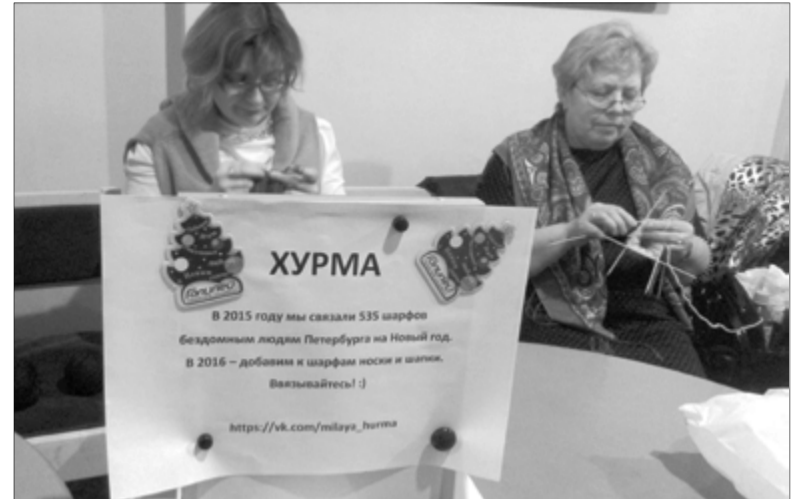
БЛАГОТВОРИТЕЛЬНАЯ ОРГАНИЗАЦИЯ «НОЧЛЕЖКА» УЖЕ С 1990 ГОДА ПОМОГАЕТ БЕЗДОМНЫМ ЛЮДЯМ В ПЕТЕРБУРГЕ ВЕРНУТЬСЯ К ОБЫЧНОЙ ЖИЗНИ...

«Хурма» довольно быстро перестала быть «индивидуаль-