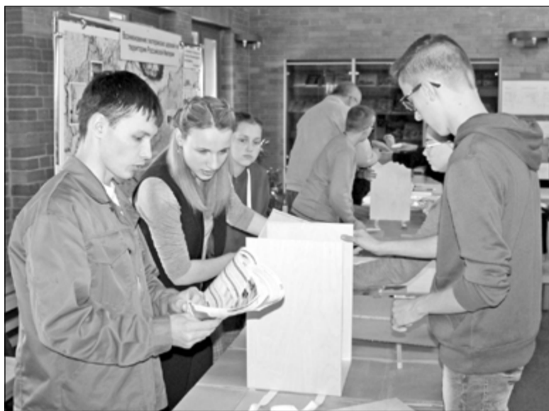
УЧАСТНИКИ КОНФЕРЕНЦИИ МАСТЕРЯТ КАХОН