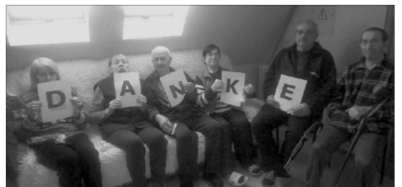
ЖИТЕЛИ ДОМА ИНТЕРНАТА ВСТРЕЧАЮТ ГОСТЕЙ

В течение всего 2016 года развивался контакт между домом-интернатом и двумя евангелическо-лютеранскими общинами Москвы: св. Петра и Павла при кафедральном соборе и общиной Эммаус. Общины собирали и отправляли в Задорожье вещи, подарки, пожертвования.