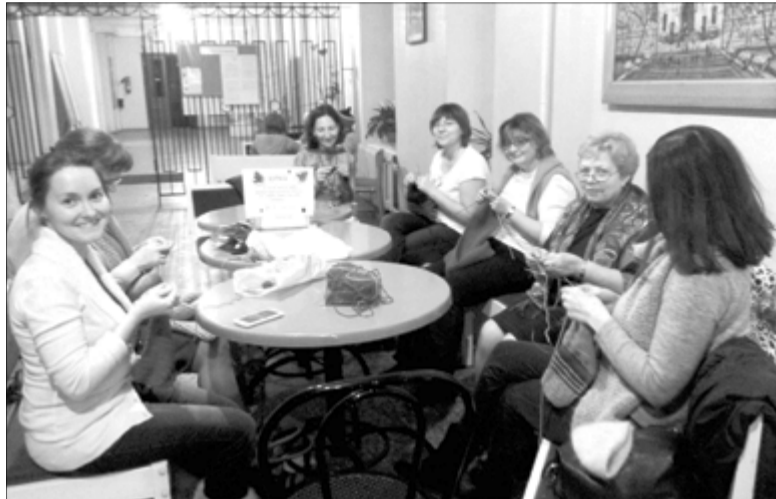
УЧАСТНИЦЫ ВСТРЕЧИ НЕ ТОЛЬКО ПОЗНАКОМИЛИСЬ ДРУГ С ДРУГОМ В РЕАЛЬНОЙ ЖИЗНИ И ПОРАБОТАЛИ ВМЕСТЕ, НО И ПОГОВОРИЛИ О ПРОБЛЕМАХ ЦЕЛЕВОЙ АУДИТОРИИ ПРОЕКТА, ПОДЕЛИЛИСЬ ОПЫТОМ И РАЗЛИЧНЫМИ СЕКРЕТАМИ ВЯЗАНИЯ...

Один из таких проектов – «Хурма» – существует уже второй год.