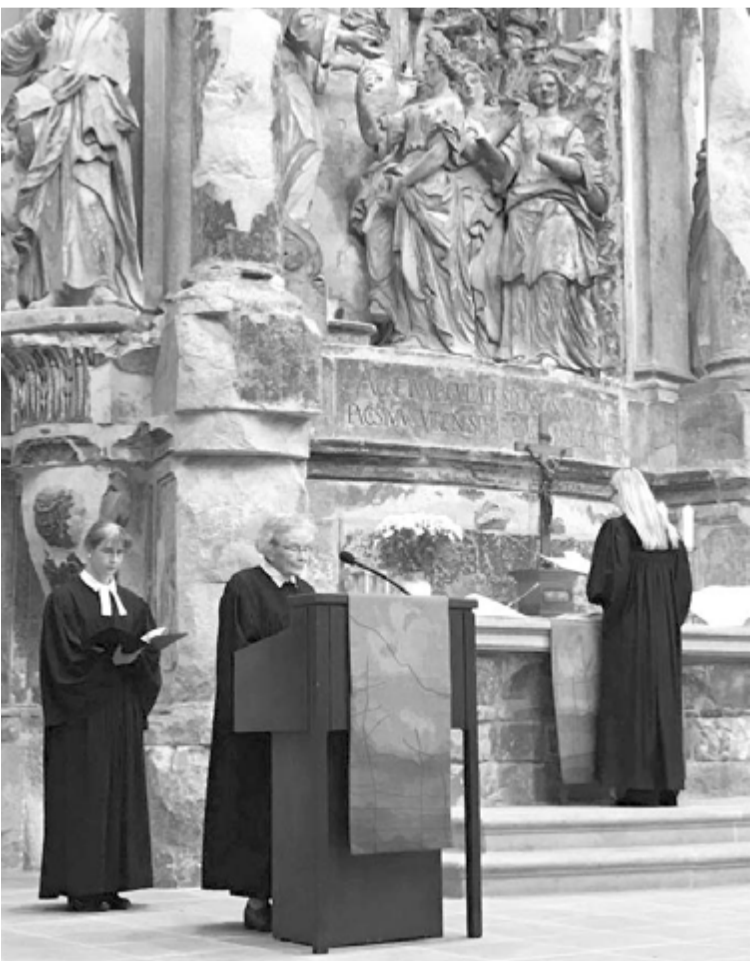
ПРАЗДНИЧНОЕ БОГОСЛУЖЕНИЕ В ЦЕРКВИ ТРЕХ ВОЛХВОВ ПРОВЕЛИ ВОСЕМЬ ЖЕНЩИН-ПАСТОРОВ

По материалам сайта www.lutherancathedral.ru