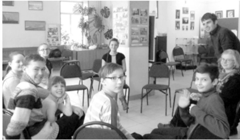
УЧАСТНИКИ БИБЛЕЙСКОЙ НЕДЕЛИ В ЦЕРКВИ СВ. ГЕОРГА