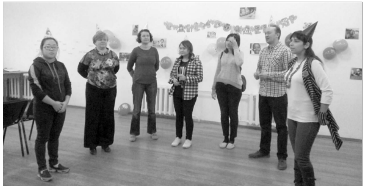
НА НАС НАДЕЛИ КОЛПАКИ, ДАЛИ ДУДКИ, МЫ ВСТАЛИ В ХОРОВОД И НАЧАЛИ ЗНАКОМСТВО...

Путешествие в мир детства завершилось. Но каждый из участников сможет продолжить его с детьми своей общины. ■