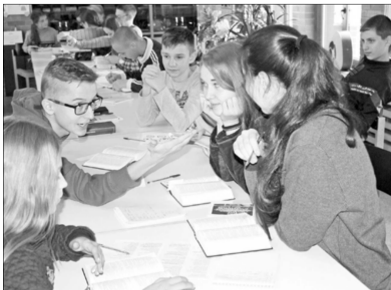
ДИСКУССИИ НА БИБЛЕЙСКИХ ЗАНЯТИЯХ