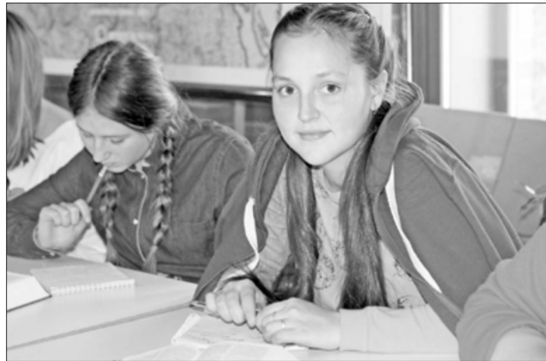
НА ПРОТЯЖЕНИИ ВСЕЙ НЕДЕЛИ УЧАСТНИКИ ПРОХОДИЛИ ТАК НАЗЫВАЕМЫЙ «АЛЬФА-КУРС»...

В один из вечеров участники конференции познакомились с работой координационных центров по мо-