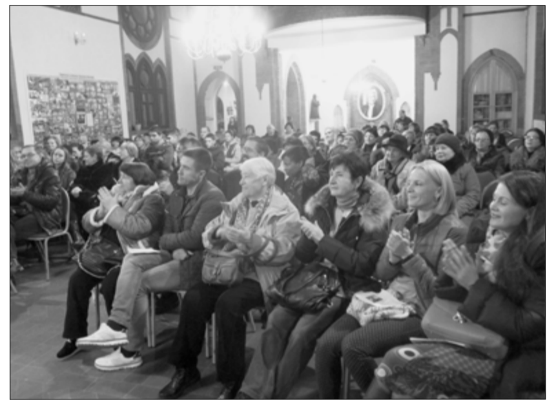
УЧАСТНИКИ ДИСКУССИИ ЗАДАЛИ РЕФЕРЕНТАМ МНОГО ВОПРОСОВ

Эти Дни культуры вновь показали, какое важное место в культурной и социальной жизни города Владивостока занимает церковь св. Павла. Организаторы сердечно благодарят всех помощников, оказавших содействие для проведения Дней культуры. ■