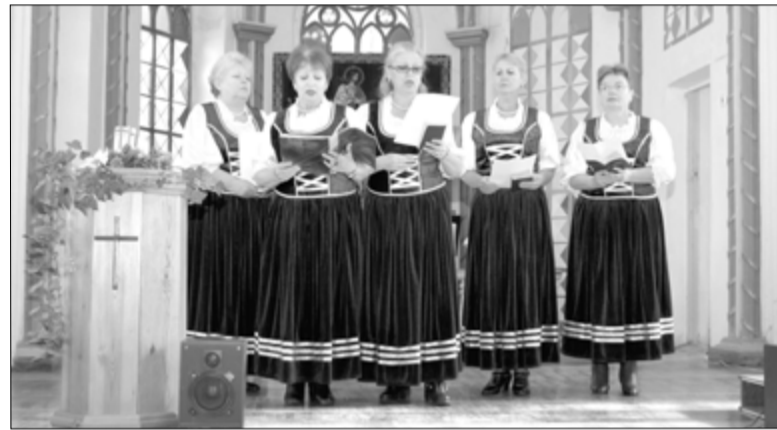
КОНЦЕРТ НЕМЕЦКОЙ НАРОДНОЙ И ДУХОВНОЙ ПЕСНИ

Организаторов порадовало присутствие большого количества народа – места не хватало не только на скамьях, но даже в коридоре церкви. Эта встреча для многих стала подарком. Несмотря на холодную погоду, в кирхе царил атмосфера тепла, дружбы и уюта. ■