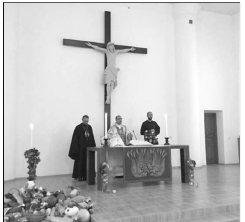
НА ПРАЗДНИЧНОМ БОГОСЛУЖЕНИИ 9 ОКТЯБРЯ

В эту церковь в течение многих лет приходили верующие на встречу с Богом и с единовещными. В течение многих лет перед алтарем возносили молитвы и отдавали Ему свои надежды, печали и радости. Изменилось внутреннее убранство церкви, посажены и растут другие деревья и цветы, сменяют друг друга родители, дети, внуки, приходят новые люди. Но Бог – всё Тот же, верный Своим обещаниям, приходит к нам – как 100, 150 и 2000 лет тому назад. ■