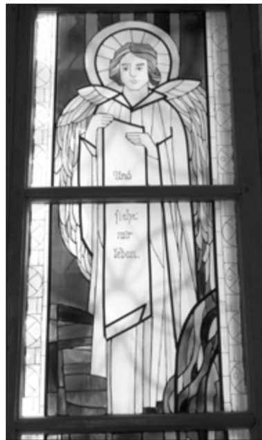
ВИТРАЖ В ЦЕРКВИ СВ. ЕКАТЕРИНЫ

На территории Советского Союза началось строительство новой жизни, с новой идеологией, в которой не было места вере в Бога – только вере в коммунистические идеалы и вождей марксизма-ленинизма.