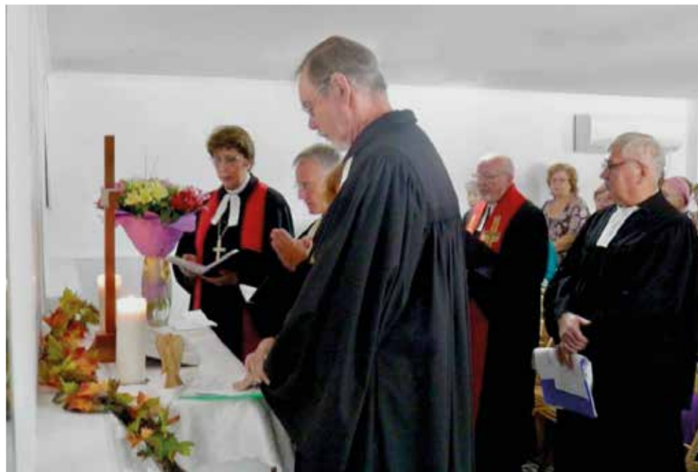
На торжественном богослужении 9 сентября