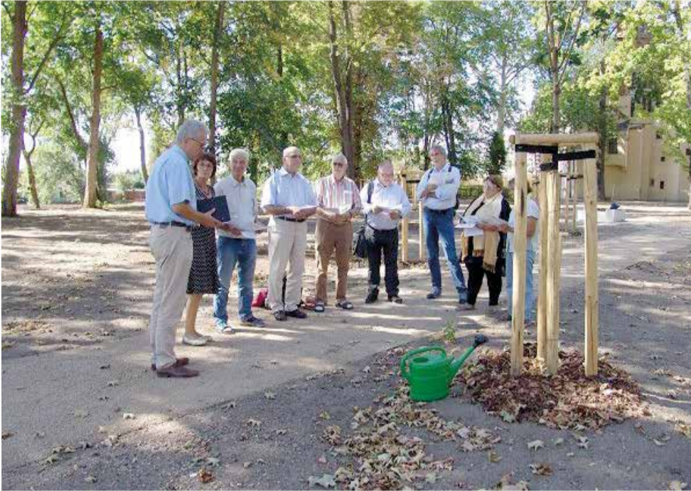
Литургия перед посадкой дерева № 488 в Саду Лютера в Виттенберге