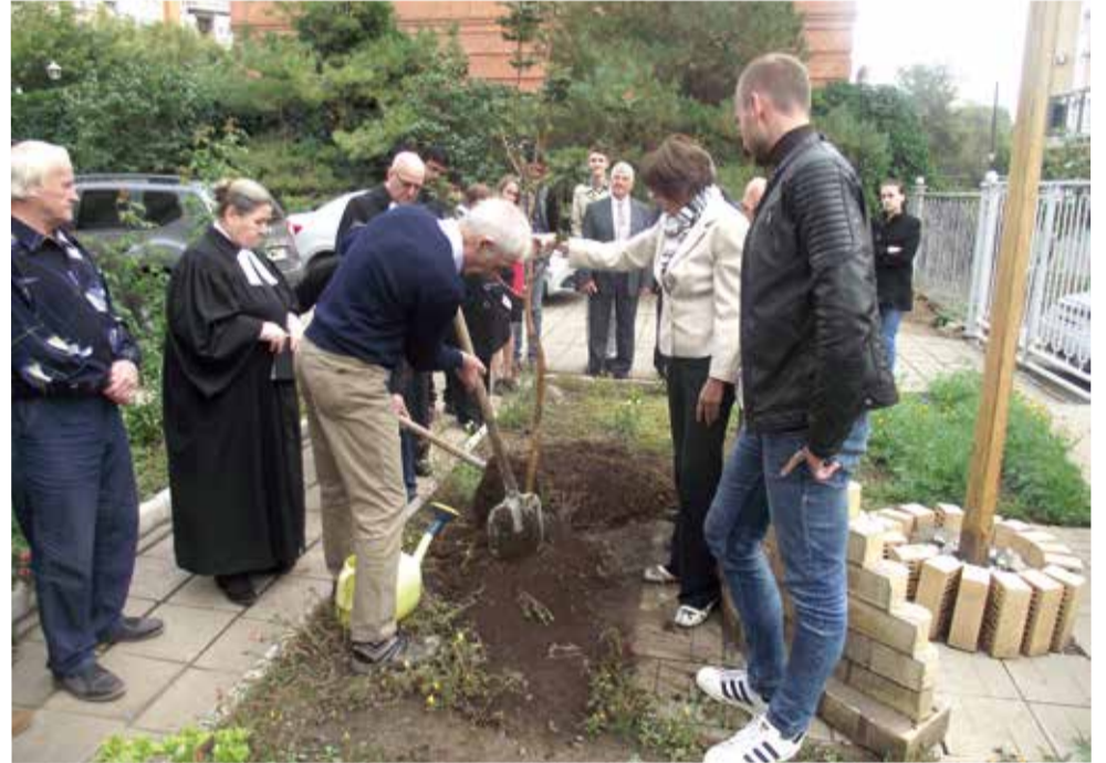
Посадка рябины в саду молитвенного дома в Оренбурге в сентябре 2017 года