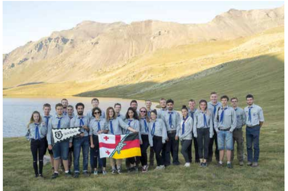
Скауты из Эслингена и молодежь из ЕЛЦГ в походе в Лагодехском национальном парке

Во время похода в Лагодехский национальный парк, расположенный на северо-востоке Грузии, группа показала, что она в состоянии превзойти свои возможности. Запланированный поход был довольно сложным, поэтому эти три дня похода были очень напряженными. Участники поддерживали друг друга, и вся группа совершила восхождение на вершину почти в 3000 метров. Кульминационным моментом было вручение грузинским участникам галстуков (атрибутов скаутского костюма) на озере Чёрных скал –