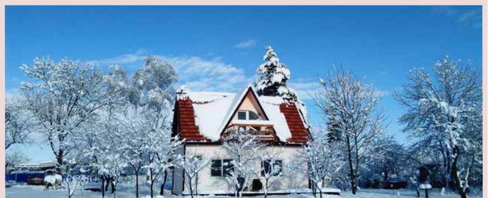
Гостевой дом «Роза Лютера»