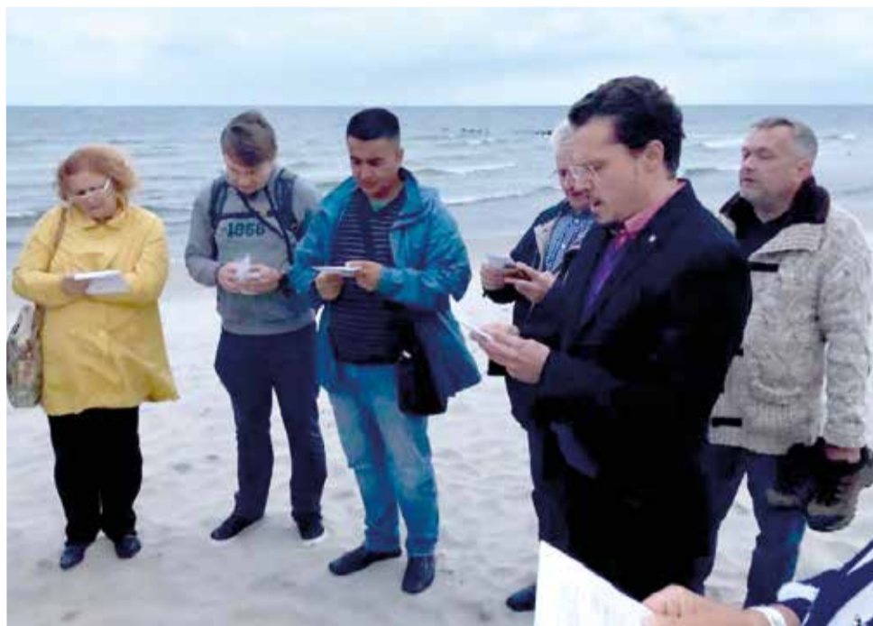
Вечерняя молитва на берегу моря открыла конференцию

Архиепископ ЕЛЦ России Дитрих Брауэр официально открыл пасторскую конференцию, сделав доклад о 12 принципах миссионерского служения, унаследованных христианской Церковью от апостолов. После доклада Архиепископа пасторам