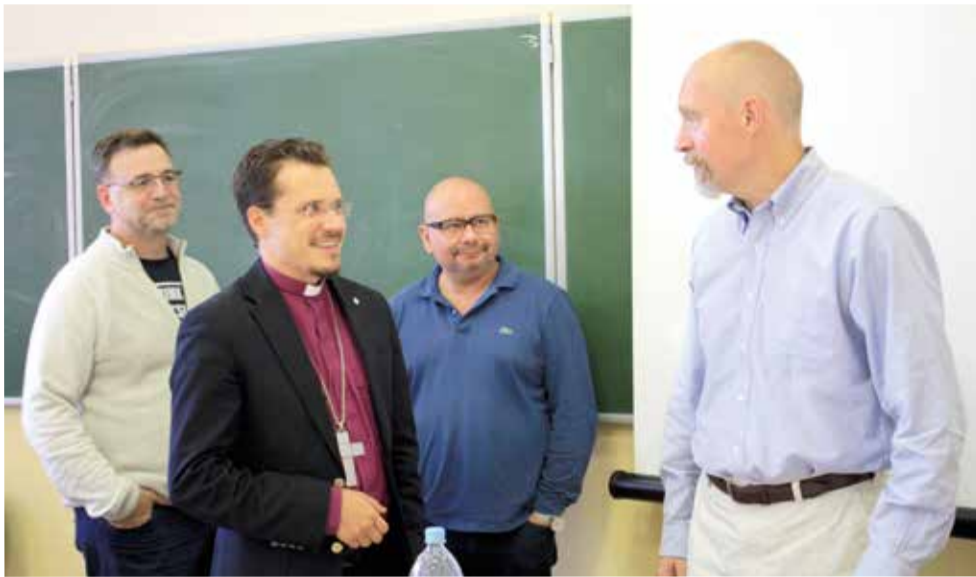
Архиепископ Дитрих Брауэр с преподавателями в семинарии