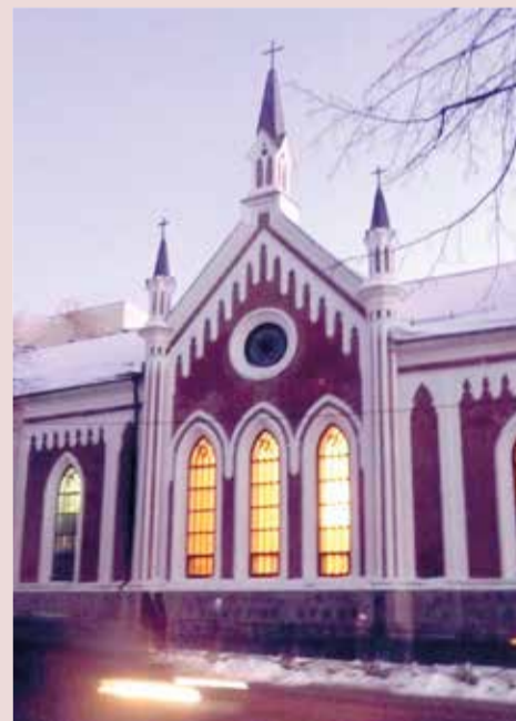
Церковь св. Екатерины

Для путешественников в г. Казани есть возможность остановиться при церкви св. Екатерины.