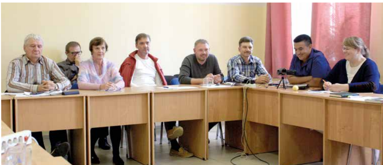
Все студенты живо интересовались предметом изучения – активно участвовали в дискуссиях, задавали много вопросов...

Все студенты живо интересовались предметом изучения – активно участвовали в дискуссиях, задавали много вопросов. В перерывах мы всегда обсуждали услышанное и делились своим опытом. Это было полное погружение в христианское общение. Там у меня возникла ассоциация с первыми христианскими общинами, жившими в любви и гармонии. ■